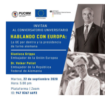
Pontificia Universidad Católica Madre y Maestra