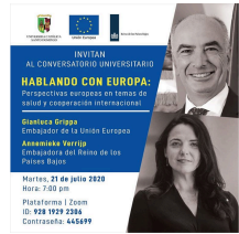
Universidad Católica Santo Domingo