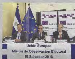
Embajador de la UE en El Salvador, Andreu Bassols (derecha), en la bienvenida a los observadores que tendrán durante las elecciones.

"En respuesta a las invitaciones del Gobierno Salvadoreño y del Tribunal Supremo Electoral (TSE), la Unión Europea (UE) ha enviado a la Misión de Observación Electoral para observar las elecciones legislativas y municipales", comenta la organización en el comunicado.