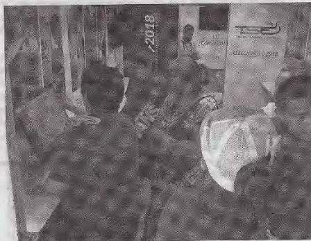
Salvadoreños practican las maneras de votar en simuladores colocados en el "Vota Bus".