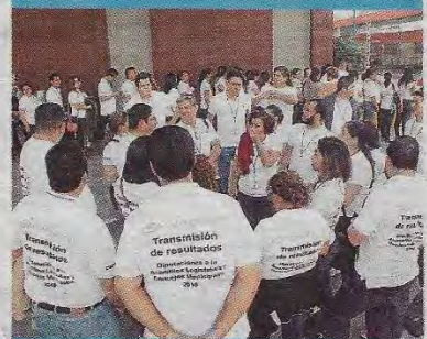
Los digitadores de Smartmatic esperaban frente al pabellón las indicaciones para el simulacro. (A. U.)