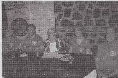
Miembros del Intercambio y Solidaridad (CIS) felicitan al pueblo salvadoreño, quien acudió a las urnas para votar por sus candidatos favoritos.

“Hay complejidad del sistema electoral, que puede abrir la puerta a que algunas personas tengan confusiones, pero esto forma parte de la soberanía y decisión de un país. Creo que es bueno que todos tengamos en cuenta que tenemos que encontrar sistemas electorales que