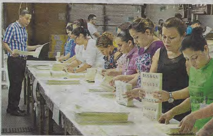
Magistrados del TSE verifican proceso de impresión de papeletas

En Usulután, el TSE detectó que el candidato del PDC,