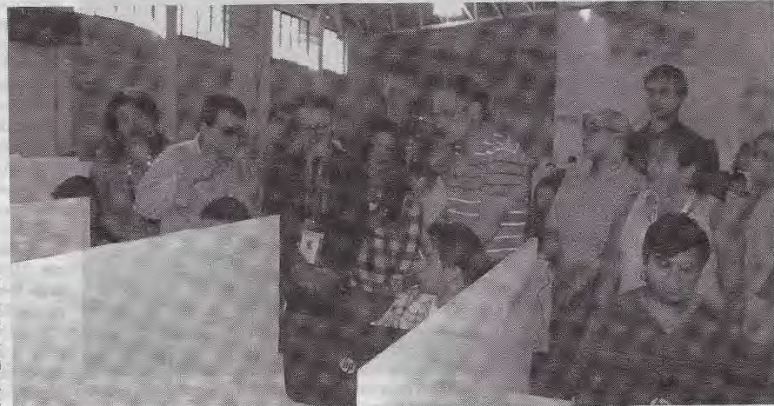
Julio Olivo, magistrado presidente del TSE, supervisa la prueba de transmisión de resultados que fue calificada como positiva.

del 95% de las actas se logró transmitir durante la prueba, la digitación anónima resultó muy exitosa y la consulta de errores que pudiesen darse, estamos satisfechos y creemos que podremos transmitir", recalco Téllez.