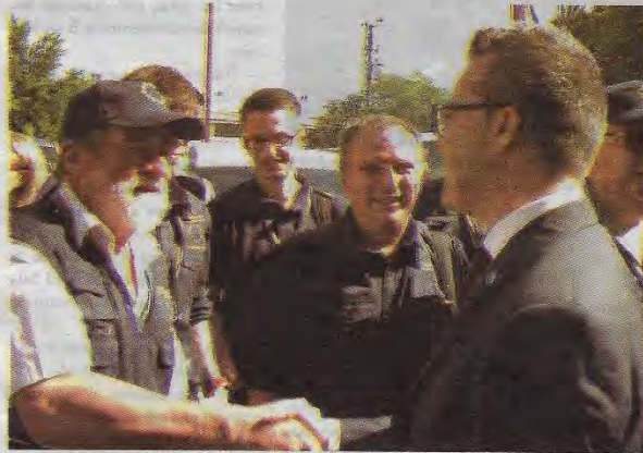
Alexander Gray, jefe adjunto de la Misión de la Unión Europea, saluda a observadores que participarán en las elecciones del próximo domingo.

“Este día me han invitado para hablar sobre retos y desafíos del sistema electoral salvadoreño, y el primero es que puedan asistir todos los integrantes de las Juntas Receptoras de Votos. Estamos hablando de las 9 mil 422 (JRV) y el dato positivo que tenemos es que hay 75 mil integrantes de estas juntas, que es una cifra nunca antes vista en la organización de elecciones salvadoreñas. An-