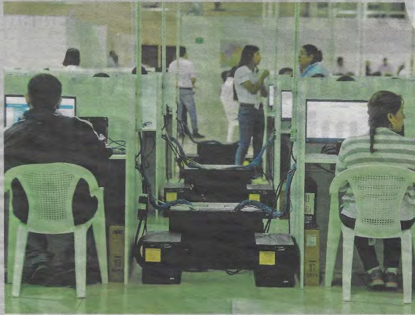
El TSE ha buscado que los sistemas de Smartmatic y A-web (tecnología de Corea) estén sincronizados para agilizar la transmisión.