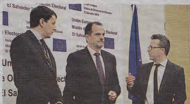
La Misión de Observación Electoral de la Unión Europea presentó este martes su primer informe tras las elecciones de diputados y alcaldes, el domingo pasado. /MARCELA MORENO