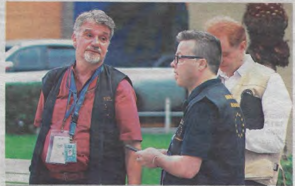
OBSERVADORES. EN EL SIMULACRO DE AYER TAMBIÉN PARTICIPARON LOS OBSERVADORES INTERNACIONALES QUE ESTÁN EN EL PAÍS PARA EVALUAR EL PROCESO DE ELECCIÓN.

V "La buena noticia es que esto (problemas de logística) se ha dado en el simulacro y nos reuniremos con la empresa que brinda el servicio de transporte para revisarlo". FERNANDO ARGÜELLO, MAGISTRADO DEL TRIBUNAL SUPREMO ELECTORAL