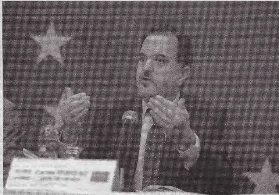
Carlos Iturgaiz, eurodiputado jefe de Misión de la MOE UE en el país.

mulcros y las especulaciones de algunos actores políticos en contienda, el jefe de Misión de la MOE UE reafirmó que llevan ya un mes en el país y que este tema ha sido recurrente en todas las reuniones que han sostenido, pero consideró que los simulacros se aplican para evaluar y transparentar los procesos electorales.