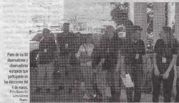
Parte de los 80 observadores y observadoras europeas que participarán en las elecciones del 4 de marzo.

“La Misión de Observación Electoral de la Unión Europea (MOE UE) está integrada por 80 personas, entre observadores y observadoras que tendrán presencia en los 14 departamentos de El Salvador, donde 28 de ellos serán a largo plazo”.