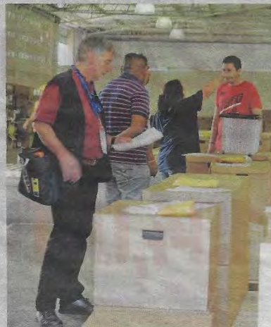
En el simulacro hubo participación de observadores electorales nacionales e internacionales.

Eso sí, señaló que si no se resuelven los inconvenientes y estos surgen el día de la elección, crecería la desconfianza entre los ciudadanos en todo el proceso electoral.