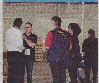
La transmisión electoral tuvo observación nacional e internacional. (A. U.)