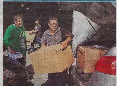
Algunos escáneres fueron trasladados por la tarde a los centros de votación. (A. URBINA)