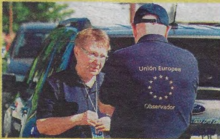
Observadores de la Unión Europea.

El día de la elección habrá entre 80 a 80 observadores de la UE y nueve analistas de tecnología.