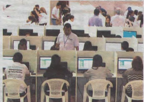
DIGITADORES. AYER TAMBIÉN SE PUSO A PRUEBA EL PROCESO DE DIGITACIÓN DE DATOS QUE DURÓ HASTA HORAS DE LA MADRUGADA DE HOY, Y QUE SERÁ EVALUADO POSTERIORMENTE POR EL TSE.