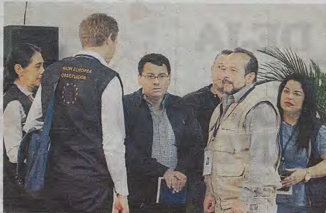
Magistrados informaron que escrutinio final avanza en un 76.65% de diputados.

complejidad", declaró Olivo. Según Olivo el organismo ha dado nuevas instrucciones a las mesas, y se ha "frenado" el envío de actas al TSE.