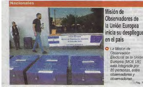
Misión de Observadores de la Unión Europea inicia su despliegue en el país

La Misión de Observación Electoral de la Unión Europea (MOE UE) está integrada por 80 personas, entre observadores y observadoras.