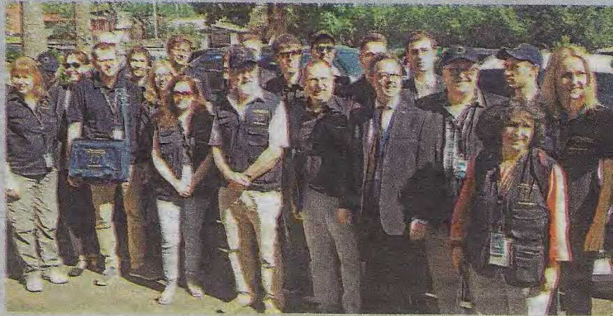
La Unión Europea desplegó ayer a 28 observadores en los 14 departamentos.

LA COMPLEJIDAD DEL PROCESO ELECTORAL SALVADOREÑO HACE QUE OBSERVADORES SE INTERESEN EN CONOCERLO, ASEGURAN FUNCIONARIOS DEL TSE.