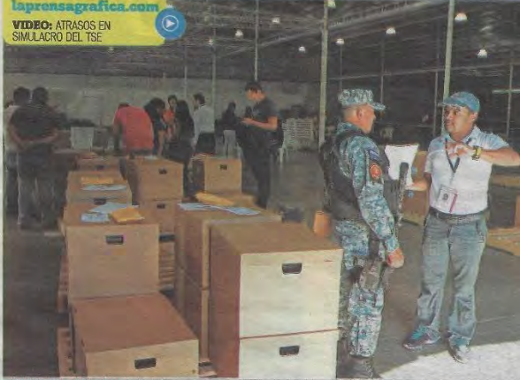
RETRASO POR TRANSPORTE. EL PROBLEMA PRINCIPAL EN EL SIMULACRO QUE REALIZÓ AYER EL TSE FUE AL MOMENTO DE TRASLADAR LOS EQUIPOS DE TRANSMISIÓN A LOS CENTROS DE VOTACIÓN.