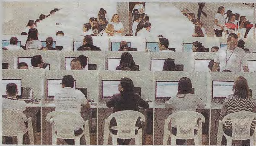
El centro de transmisión administrado por Smartmatic realiza una doble verificación a los resultados. (A. URBINA)