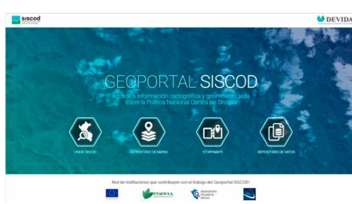
Presentación del SISCOD - Video