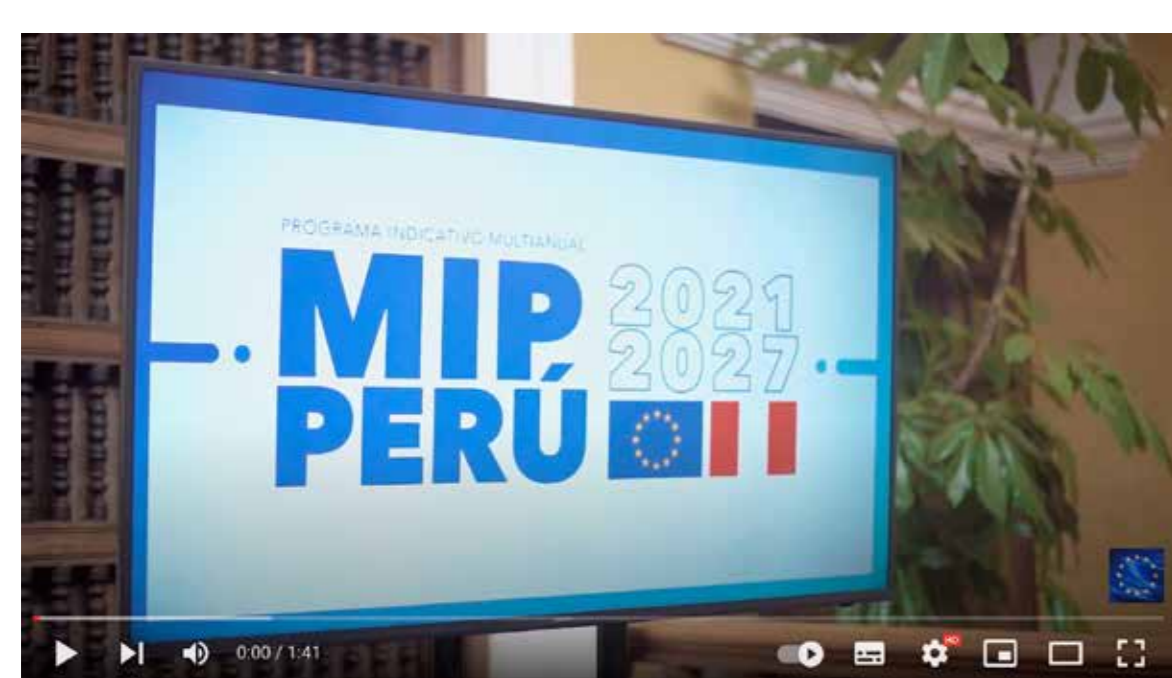
Presentación MIP Perú 2021-2027 | Video Resumen