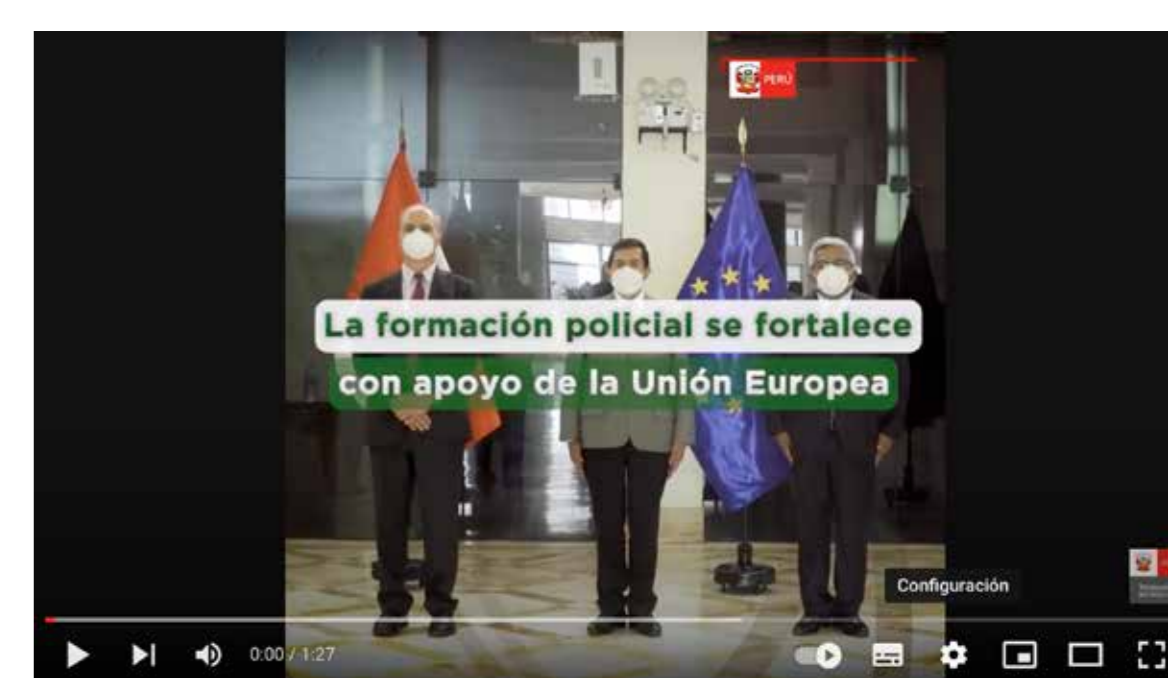
Entrega de biblioteca virtual contra la criminalidad - Video