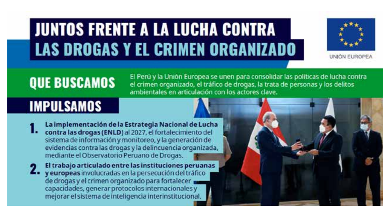
Lucha contra las drogas y crimen organizado - Ficha de proyecto