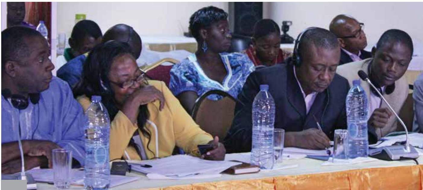
Des représentants de l'industrie du bois du Cameroun participent à un atelier organisé par le Centre pour l'environnement et le développement et ClientEarth sur le Règlement de l'UE dans le domaine du bois, à Yaoundé, avril 2013