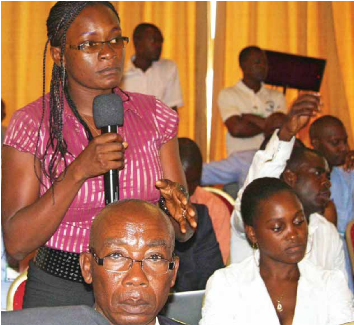
Une participante lors d'une réunion plénière au Forum sur la Gouvernance Forestière, Yaoundé, avril 2013