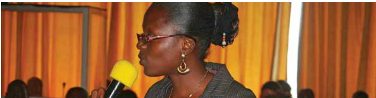
Une participante lors d'une réunion plénière au Forum sur la Gouvernance Forestière, Yaoundé, avril 2013