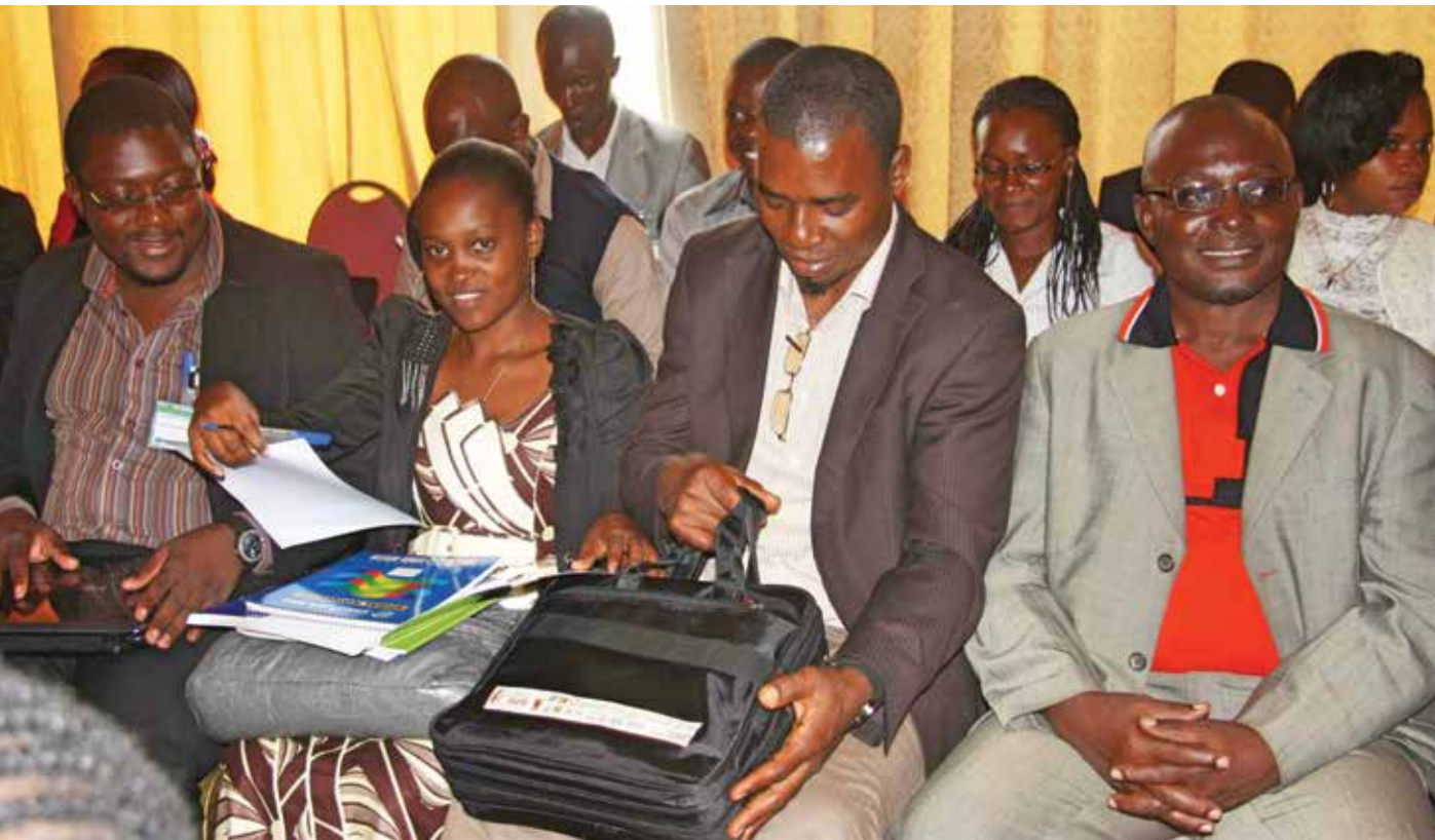
Des représentants de la société civile au Forum sur la Gouvernance Forestière, Yaoundé, avril 2013