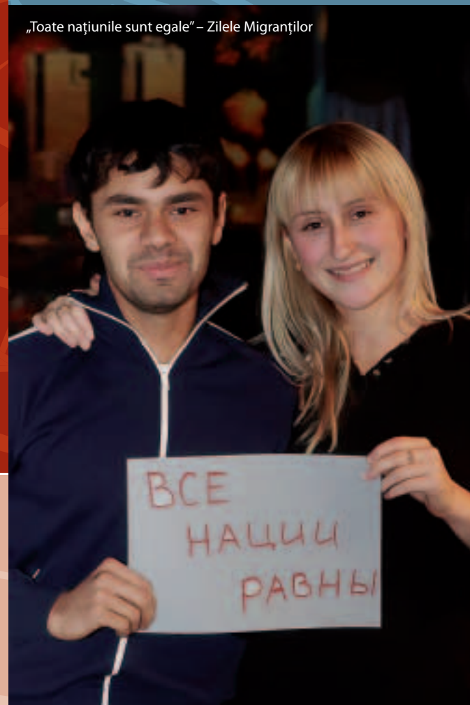
„Toate națiunile sunt egale” – Zilele Migranților