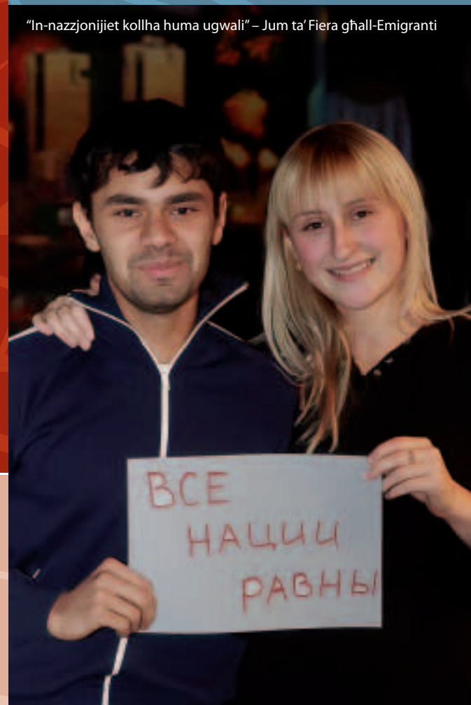
"In-nazzjonijiet kollha huma ugwali" – Jum ta' Fiera għall-Emigranti