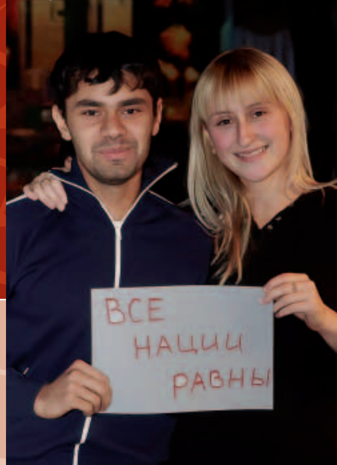
«Toutes les nations sont égales» – fête de la Journée internationale des migrants