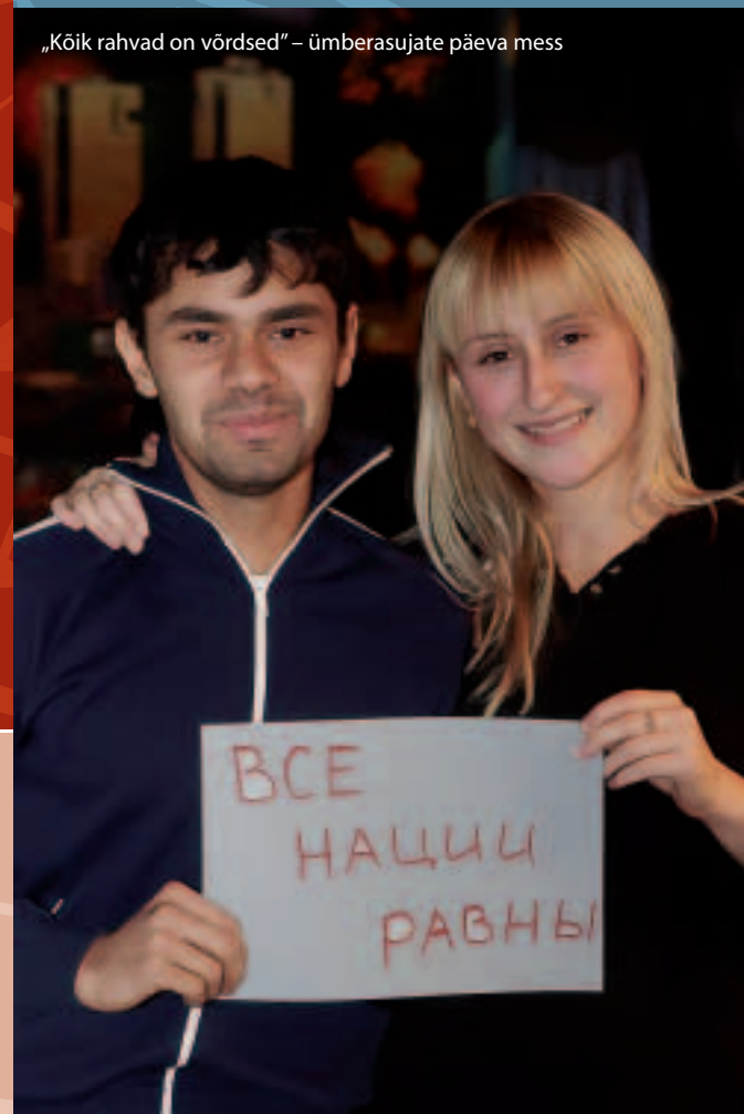
„Kõik rahvad on võrdsed“ – ümberasujate päeva mess