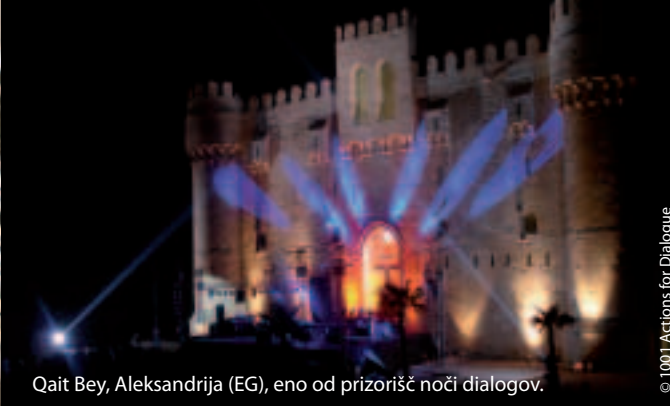
Qait Bey, Aleksandrija (EG), eno od prizorišč noči dialogov.