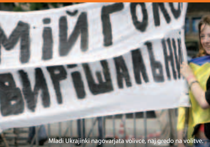
Mladi Ukrajinki nagovarjata volivce, naj gredo na volitve.

Torej, kako to deluje? EU in vse njene sosede so se dogovorili o tem, kako bodo zgradili tesnejše odnose in podprli reforme v tri- do petletnem obdobju. Skupne zaveze so zapisane v tako imenovanih akcijskih načrtih. V okviru »Evropskega sosedskega in partnerskega instrumenta« (ENPI) je na voljo strokovno znanje in financiranje (skoraj 12 milijard € v času od 2007 do 2013) za pomoč pri posodobitvi in reformi.