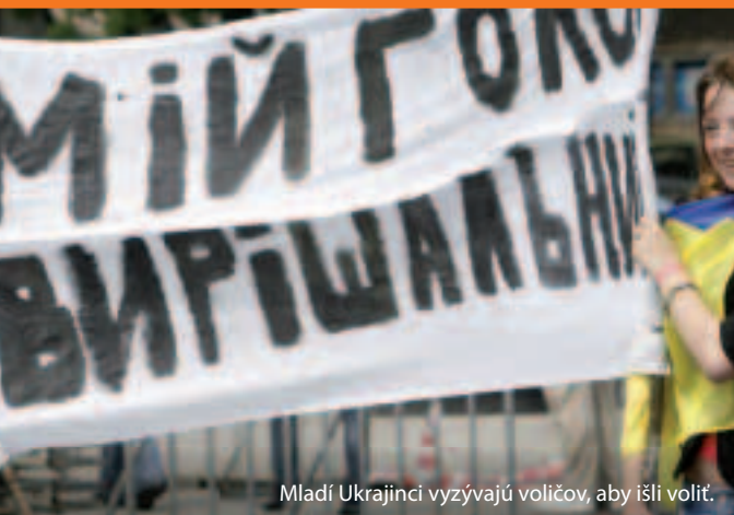
Mladí Ukrajinci vyzývajú voličov, aby išli voliť.

Ako to teda funguje? EÚ a každý z jej susedov sa dohodli na spôsobe budovania bližších vzťahov a podporovania reforiem počas troj- až päťročného obdobia. Spoločné záväzky sú uvedené v tzv. akčných plánoch. V rámci „Nástroja Európskeho susedstva a partnerstva“ sa poskytujú odborné poznatky a finančné prostriedky (takmer 12 miliárd EUR od roku 2007 do roku 2013) na podporu modernizácie a reforiem.