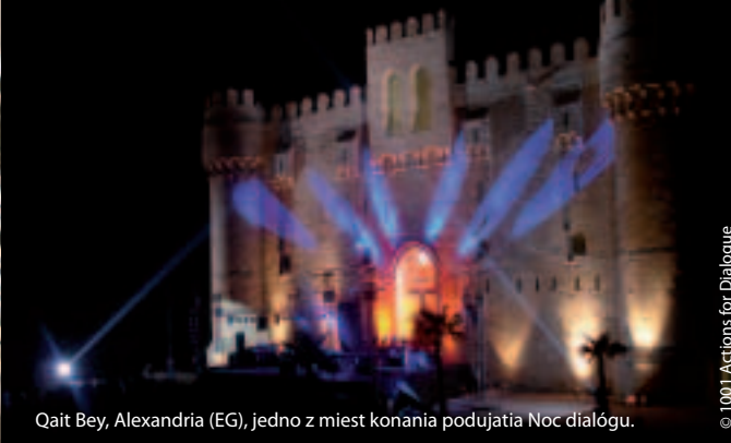
Qait Bey, Alexandria (EG), jedno z miest konania podujatia Noc dialógu.