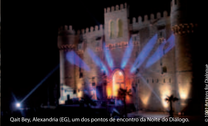
Qait Bey, Alexandria (EG), um dos pontos de encontro da Noite do Diálogo.