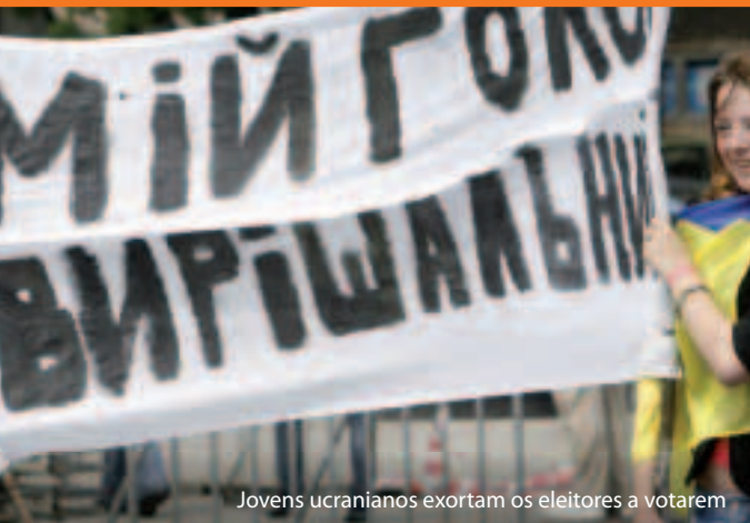
Jovens ucranianos exortam os eleitores a votarem

Como funciona? A UE e cada um dos seus vizinhos definem as condições para criar relações mais próximas e apoiar reformas durante um período de três a cinco anos. Os compromissos conjuntos são explicados nos designados Planos de Acção. São disponibilizados conhecimentos técnicos e financiamento (quase 12 mil milhões de euros de 2007 a 2013) através do “Instrumento Europeu de Vizinhança e Parceria” (IEVP) para apoiar a modernização e a reforma.