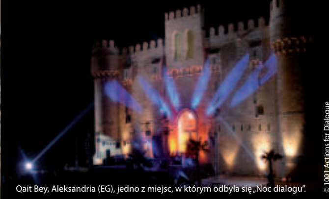
Qait Bey, Aleksandria (EG), jedno z miejsc, w którym odbyła się „Noc dialogu”.