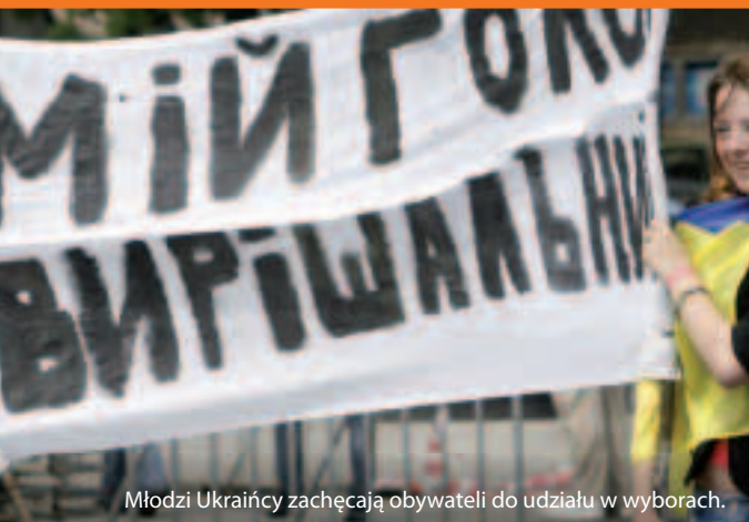
Młodzi Ukraińcy zachęcają obywateli do udziału w wyborach.

W jaki sposób to działa? UE i każde z sąsiadujących państw są zgodne co do sposobów budowania bliższych relacji i wspierania reform w okresie od trzech do pięciu lat. Wspólne zobowiązania określone są w tzw. planach działania. Wiedzę specjalistyczną i środki finansowe (blisko 12 mld euro na lata 2007-2013) można uzyskać w ramach „Europejskiego Instrumentu Sąsiedztwa i Partnerstwa” (EISP) z przeznaczeniem na pomoc w procesie modernizacji i wprowadzania reform.