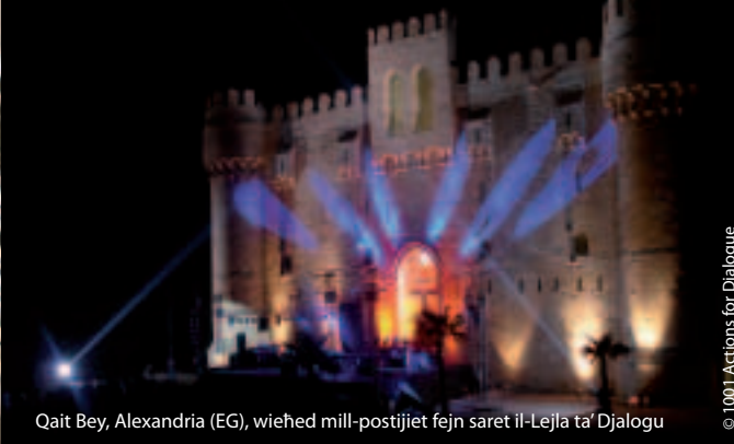
Qait Bey, Alexandria (EG), wiehed mill-postijiet fejn saret il-Lejla ta' Djalogu