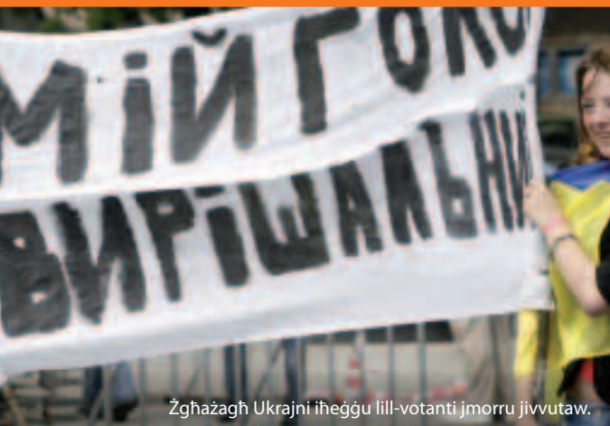
Zgħażaġh Ukraini iheggu lill-votanti jmorru jivvutaw.

Allura kif taħdem? L-UE u kull wieħed mill-ġirien tagħha jaqblu fuq kif jibnu relazzjonijiet aktar mill-qrib u jappoġġjaw riformi fuq perjodu ta' tlieta sa ħames snin. L-impenni kongjunti huma mfissra f'hekk imsejja Pjanijiet ta' Azzjoni. Il-ħila u l-finanzi (kważi €12-il biljun mill-2007 sal-2013) huma disponibbli taħt l-Istrument tal-Viċinat u l-Partenarjat Ewropew' (ENPI) sabiex jgħinu bil-modernizzazzjoni u r-riforma.