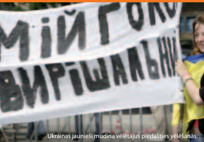
Ukrainas jaunieši mudina vēlētājus piedalīties vēlēšanās.

Kā gan tas viss tiek īstenots? ES un ikviena kaimiņvalsts vienojas par to, kā veidot ciešākas attiecības un atbalstīt reformas 3–5 gadu ilgā laikposmā. Visus kopīgās apņemšanās aspektus izklāsta tā dēvētajos rīcības plānos. Eiropas Kaimiņattiecību un partnerattiecību instruments (EKPI) ir gan praktisku zināšanu, gan finansējuma avots (gandrīz 12 miljardi eiro no 2007. līdz 2013. gadam) modernizācijas un reformu atbalstam.