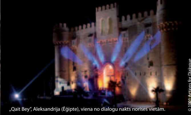
„Qait Bey”, Aleksandrija (Ēģipte), viena no dialogu nakts norises vietām.