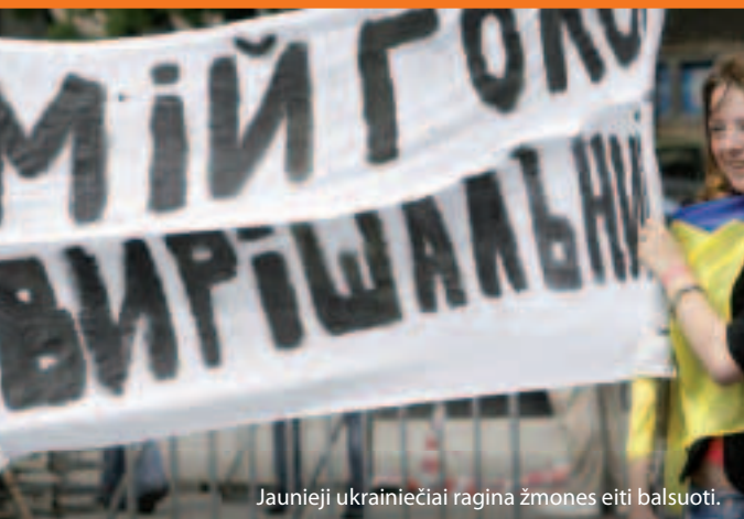
Jaunieji ukrainiečiai ragina žmones eiti balsuoti.

Tad kaip ji veikia? ES su kiekviena savo kaimyne susitaria, kaip 3–5 metų laikotarpiu galima būtų sustiprinti abipusius ryšius ir paremti reformas. Bendri įsipareigojimai išdėstomi vadinamuosiuose veiksmų planuose. Pagal „Europos kaimynystės ir partnerystės priemonę“ modernizacijai ir reformoms paremti gali būti skiriamos konsultacijos ir finansavimas (beveik 12 milijardų 2007–2013 m.).