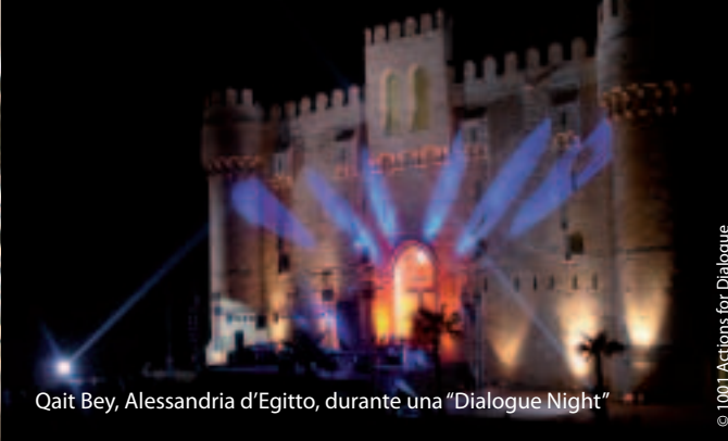
Qait Bey, Alessandria d’Egitto, durante una “Dialogue Night”