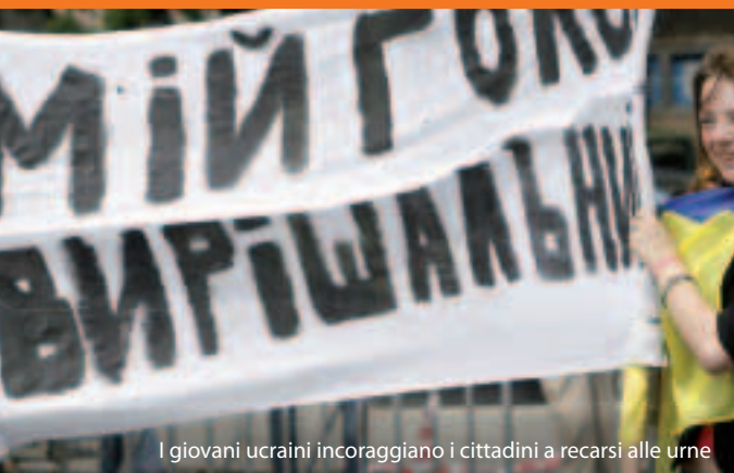
I giovani ucraini incoraggiano i cittadini a recarsi alle urne

Ma come funziona? L'UE raggiunge un'intesa con ognuno dei paesi confinanti in merito alle modalità da utilizzare per dare vita a relazioni solide e sostenere le riforme durante un periodo di 3-5 anni. Gli impegni congiunti sono successivamente enunciati nei cosiddetti piani d'azione. Per assecondare gli sforzi di ammodernamento e riforma sono disponibili know-how e finanziamenti (quasi 12 miliardi di euro dal 2007 al 2013) nell'ambito dello strumento europeo di vicinato e partenariato (ENPI).