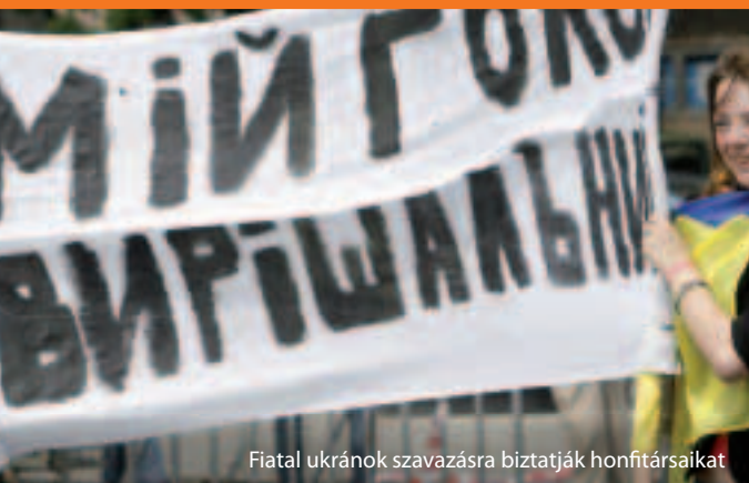
Fiatalkoruk szavazásra biztatják honfitársaikat

Hogyan működik az európai szomszédságpolitika? Az EU és szomszédai megegyeznek arról, hogyan lehetne szorosabb kapcsolatot kialakítani egymással és 3–5 éves időtartamú reformprogramokat támogatni. A közös kötelezettségvállalásokat úgynevezett cselekvési tervekben fektetik le. Az Európai Szomszédsági és Partnerségi Támogatási Eszköz keretében szakértelmet és (2007 és 2013 között mintegy 12 milliárd euró értékben) finanszírozást biztosítanak a korszerűsítés és a reformok elősegítésére.