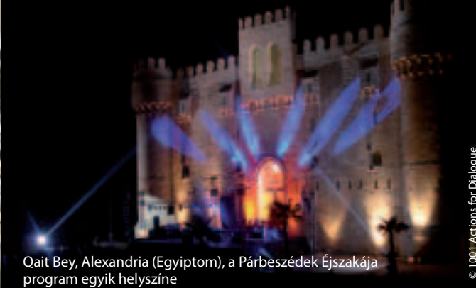
Qait Bey, Alexandria (Egyiptom), a Párbeszédék Éjszakája program egyik helyszíne