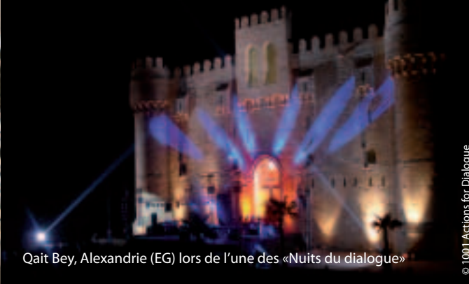
Qait Bey, Alexandrie (EG) lors de l'une des «Nuits du dialogue»