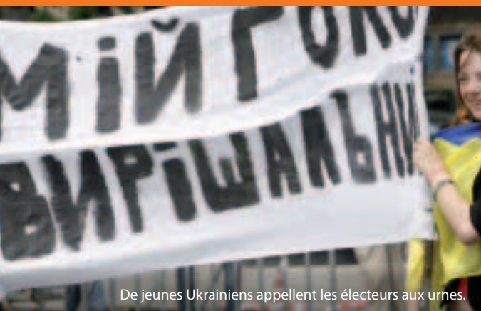
De jeunes Ukrainiens appellent les électeurs aux urnes.

Comment remplit-elle cet objectif? L'Union européenne et ses pays voisins conviennent d'engagements communs, qui visent un rapprochement et le soutien de réformes sur une période de trois à cinq ans. Ces engagements sont énoncés dans des plans d'action. Au titre de l'instrument européen de voisinage et de partenariat (IEVP), ces pays bénéficient d'une expertise et d'une aide communautaire qui s'élève à près de 12 milliards d'euros pour la période 2007-2013 en vue d'encourager la modernisation et la réforme.