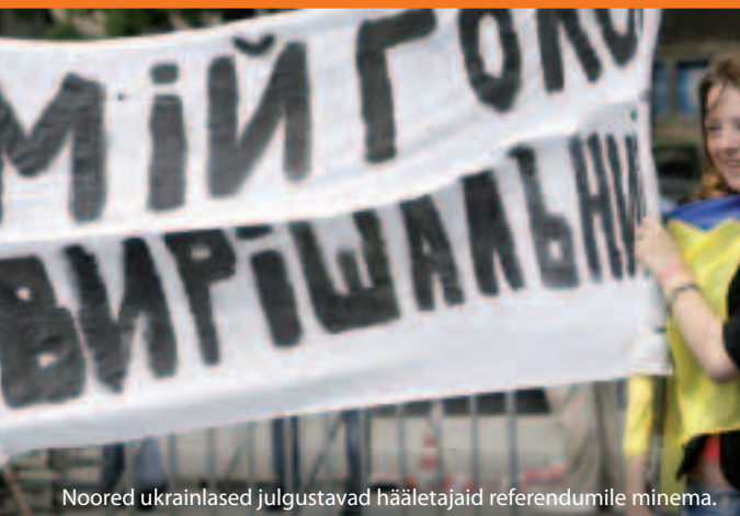
Noored ukrainlased julgustavad hääletajaid referendumile minema.

Niisiis kuidas see toimib? EL ja kõik ta naabrid lepivad kokku, kuidas sõlmida tihedamaid suhteid ja toetada reforme kolme- kuni viieaastase perioodi lõikes. Ühised kohustused sätestatakse niinimetatud tegevuskavades. Kaasajastamise ja reformide toetuseks pakub oskusteadmisi ja rahastamist (2007. aastast 2013. aastani peaaegu 12 miljardit eurot) Euroopa naabus- ja partnerlusvahend (ENPI).