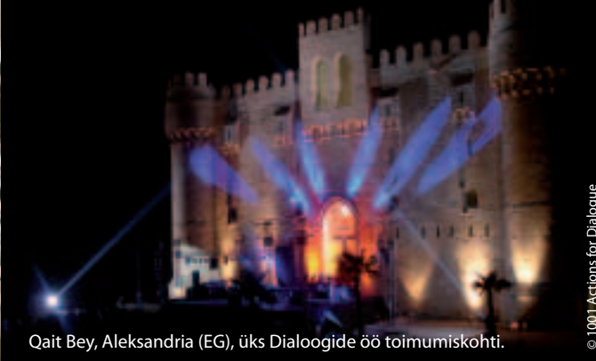
Qait Bey, Aleksandria (EG), üks Dialogide öö toimumiskohti.