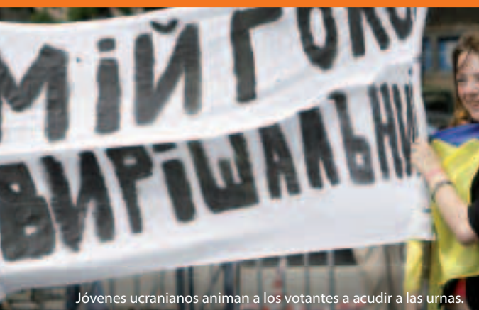
Jóvenes ucranianos animan a los votantes a acudir a las urnas.

¿Pero cómo funciona? La UE y cada uno de sus vecinos acuerdan cómo establecerán relaciones más estrechas y apoyarán reformas a lo largo de un periodo de entre tres y cinco años. Los compromisos conjuntos se explican en detalle en los denominados Planes de acción. El “Instrumento Europeo de Vecindad y Asociación” (IEVA) proporciona el asesoramiento y la financiación (cerca de 12 000 millones de euros para 2007-2013) para ayudar en la modernización y reforma.