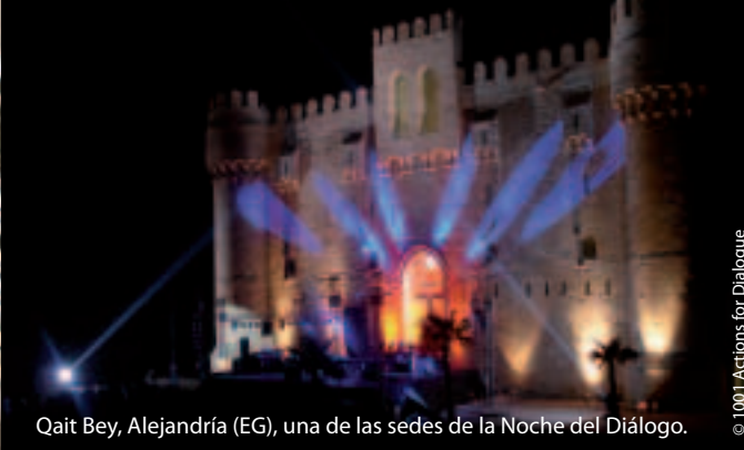
Qait Bey, Alejandría (EG), una de las sedes de la Noche del Diálogo.