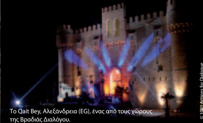
Το Qait Bey, Αλεξάνδρεια (EG), ένας από τους χώρους της Βραδιάς Διαλόγου.