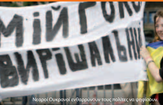
Νεαροί Ουκρανοί ενθαρρύνουν τους πολίτες να ψηφίσουν.

Πώς λειτουργεί; Η Ε.Ε. και κάθε μία από τις γειτονικές της χώρες συμφωνούν για τους τρόπους οικοδόμησης στενότερων σχέσεων και υποστήριξης μεταρρυθμίσεων για διάστημα τριών έως πέντε ετών. Οι κοινές δεσμεύσεις αναλύονται στα επονομαζόμενα Σχέδια Δράσης. Τεχνογνωσία και χρηματοδότηση (σχεδόν 12 δις € από το 2007 έως το 2013) διατίθενται μέσω του «Ευρωπαϊκού Μηχανισμού Γειτονίας και Εταιρικής Σχέσης» (ENPI), προς υποστήριξη του εκσυγχρονισμού και της μεταρρύθμισης.