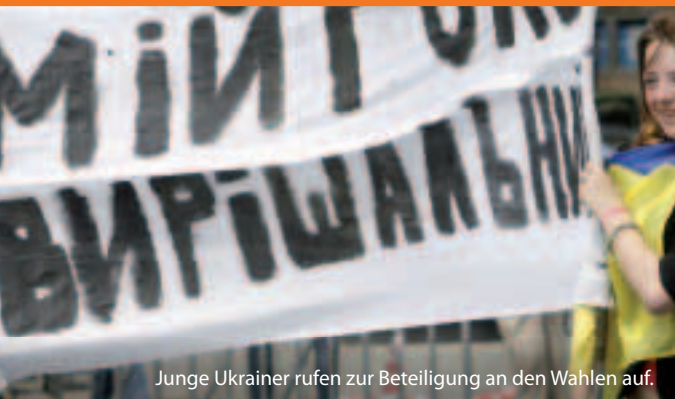
Junge Ukrainer rufen zur Beteiligung an den Wahlen auf.

Wie funktioniert sie nun? Die EU vereinbart mit jedem Nachbarland, wie über einen Zeitraum von drei bis fünf Jahren die Beziehungen ausgebaut und Reformen unterstützt werden können. Die gemeinsamen Verpflichtungen werden in so genannte Aktionspläne aufgenommen. Sachkenntnisse und Finanzierungsmittel (in Höhe von fast 12 Milliarden Euro von 2007 bis 2013) werden im Rahmen des „Europäischen Nachbarschafts- und Partnerschaftsinstruments“ (ENPI) für die Förderung von Modernisierung und Reformen zur Verfügung gestellt.