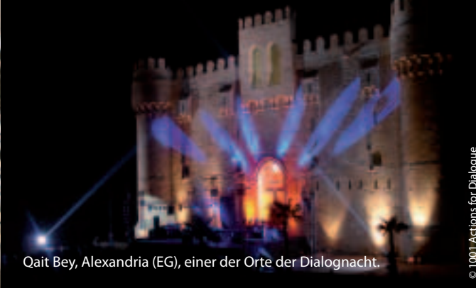
Qait Bey, Alexandria (EG), einer der Orte der Dialognacht.