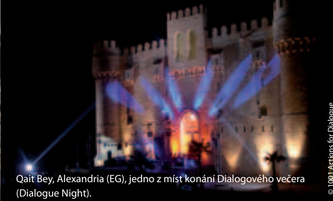
Qait Bey, Alexandria (EG), jedno z míst konání Dialogového večera (Dialogue Night).