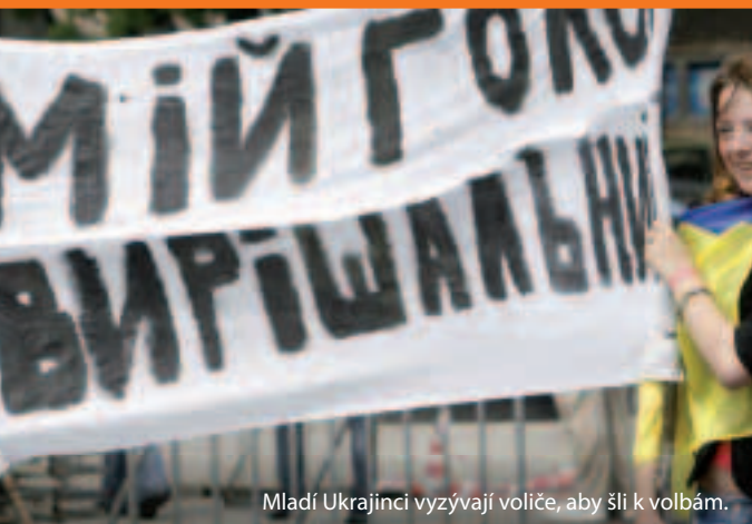
Mladí Ukrajinci vyzývají voliče, aby šli k volbám.

Jak to tedy funguje? EU a každý z jejích sousedů se dohodnou na tom, jak v průběhu tří až pětiletého období budou budovat užší vztahy a podporovat reformy. Společné závazky jsou vyjádřeny v takzvaných Akčních plánech. Pomocí při modernizaci a reformách jsou odborné znalosti a finanční prostředky (téměř 12 miliard eur v letech 2007 až 2013), které jsou dostupné v rámci Evropského nástroje sousedství a partnerství (ENPI).