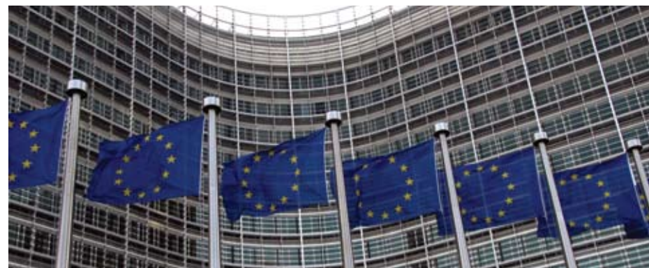
Європейська Комісія, розміщена у будівлі Берламон в Брюсселі, є однією з основних інституцій Євросоюзу

Наступні розділи цієї брошури більш детально познайомлять вас з роллю ЄС як найбільшого донора програм допомоги в світі, а також з програмами співпраці України з Європейським Союзом.