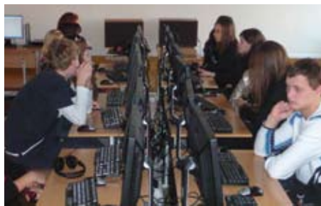
Редакція новин в Інституті журналістики КНУ ім. Тараса Шевченка, створена в рамках проекту, фінансованого ЄС

Загальний бюджет програми TACIS у 7,3 мільярди євро за 15 років є значною сумою, яка все ж таки може вважатися обмеженою з огляду на серйозність тих проблем, що потребували вирішення. Але за допомогою TACIS було досягнуто докорінних змін та відчутного розвитку. За 15 років свого існування програма TACIS стала брендом дієвої допомоги та співпраці з Європейським Союзом. Програма TACIS ініціювала процеси, які в більшості випадків обумовили сталі зміни в суспільстві, економіці та інших пріоритетних галузях країн-партнерів ЄС.