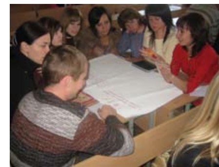
Учні середніх шкіл України брали активну участь у реалізації багатьох проектних завдань

«Міністерство впевнене, що досягнення та результати Проекту допоможуть українським вчителям виховувати учнів з громадянською компетенцією та відповідними знаннями, навичками, повагою до цінностей та відношенням, що є необхідним для того, аби вони стали відповідальними та активними громадянами.»