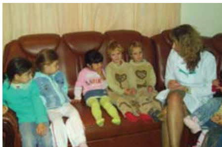
Заняття психолога з дітьми в ході Проекту

Проект передбачав підготовку і проведення ряду заходів серед ромів, що проживають майже в 30 з 40 таборах області. Основними заходами були: залучення до співпраці партнерів та волонтерів; проведення опитування населення в місцях їх масового проживання; зустрічі спеціалістів-медиків, освітян, правників з жінками та підлітками; поширення інформації серед ромів про напрямки роботи Фонду; вивчення санітарних та екологічних умов проживання сімей ромів, особливо неповних сімей та дітей-сиріт; про-