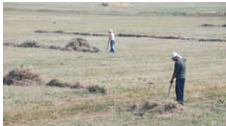
Проект виконується на території трьох країн – України, Росії та Молдови

Євразійські степи — унікальні екосистеми, яких у світі лишилося дуже мало. Євразійські степи мають неабияке значення, адже вони відіграють значну роль у балансі екосистем світу. Знищення степової екосистеми призведе до неминучих наслідків, що позначатимуться на всіх екосистемах світу, й насамперед — на європейських. Головним завданням проекту є пошук та практичне випробування таких механізмів управління степовими територіями, які сприятимуть розвитку сільських територій, з одного боку, та збереженню степових екосистем — з іншого.