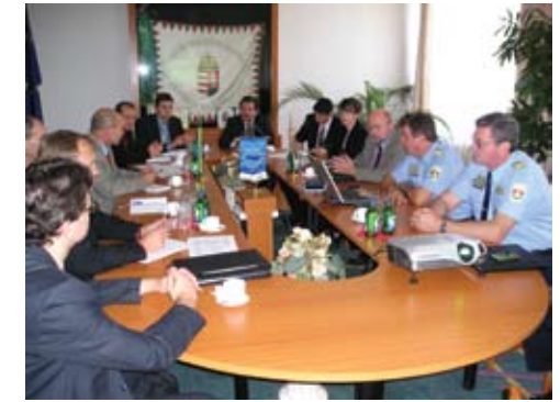
Українські та угорські прикордонники обговорюють шляхи реформування процесу підготовки персоналу під час робочого візиту до Угорщини