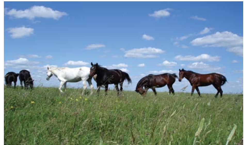
Кони – важливі представники степової екосистеми

голова Одеського прес-клубу «Порто-Франко», в ході прес-туру українських журналістів до безпосереднього місця виконання Проекту у 2008 році