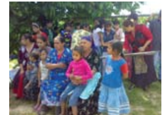
Зустріч медиків з ромськими жінками та дітьми