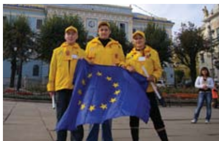
Волонтери на святкуванні Дня міста в Чернівцях під час проведення Фестивалю добросусідства Україна-Румунія, жовтень 2008 року

Запланований бюджет програм в рамках ЄІСП на 2007-2010 роки становить понад 490 мільйонів євро. Бюджет 2007 року склав 120 мільйонів євро. Цю суму було збільшено на 22 мільйони євро завдяки Механізму сприяння реформам управління, яку було виділено для Енергетичного компоненту програм 2007 року. Бюджет на 2008 рік склав 122 мільйони євро та 16,6 мільйонів євро в рамках Механізму сприяння реформам управління.