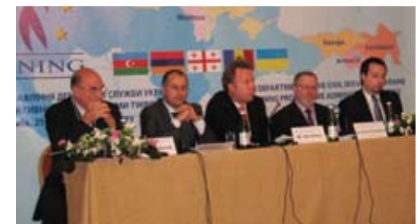
Друга щорічна конференція країн Чорноморського регіону з питань інструменту Твіннінг (25 вересня 2008 року)

Окрім виконання вимог, викладених в двосторонніх угодах ЄС з країнами-