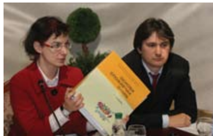
Презентація посібника «Основы потребительских знаний» для українських шкіл, Київ, 10 червня 2008 року

Проект є спільною ініціативою ЄС та ПРООН. Його загальною метою є збільшення впливу громадянського суспільства на економічне життя країни згідно з європейськими стандартами. Проект працює у чотирьох взаємопов'язаних напрямках: (1) поширення в Україні європейського досвіду та практик захисту споживачів, незалежного тестування та інформування про безпеку товарів та послуг; (2) покращан-