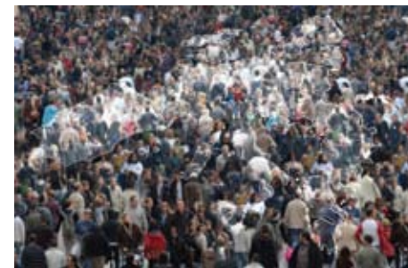
ЄС активно працює над вирішенням питань глобального характеру, таких як екологія, дотримання прав людини, цифрова нерівність та інші

Ці п'ять тематичних програм ІСР підтримують заходи в усіх країнах, що розвиваються, в тому числі, і в країнах СНД.