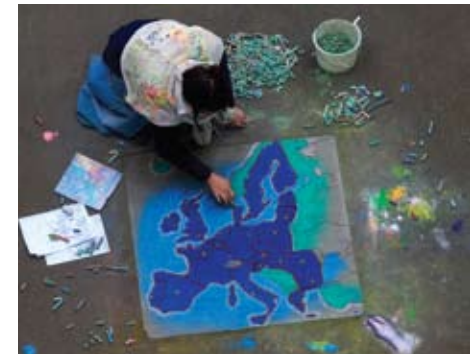
Зовнішні кордони ЄС не повинні стати новою лінією поділу в Європі. Європейська політика сусідства має на меті співпрацю з країнами-партнерами, сприяючи їх процвітанню та стабільності

З 2007 року, який позначає початок нового бюджетного циклу в ЄС, фінансову та технічну підтримку Європейської політики сусідства та країн, що в неї входять, забезпечує Європейський інструмент сусідства та партнерства. Більш детально цей механізм описаний в наступному розділі.