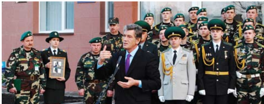
Президент України відкриває Навчальний центр підготовки молодших спеціалістів Державної прикордонної служби України в Оршанці, березень 2008 року