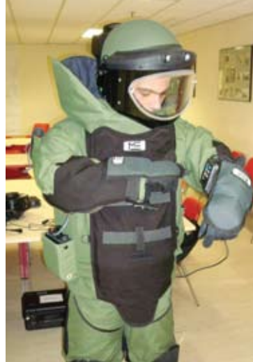
Український прикордонник під час тренінгу в навчальному центрі польської прикордонної служби

Проект виконано Міжнародною організацією з міграції (МОМ) за підтримки партнерів з країн ЄС та фінансування Європейського Союзу і Державного Департаменту США. Проект спрямовано на реформування та удосконалення процедур набору, підготовки та кар'єрного росту персоналу Державної прикордонної служби України (ДПСУ), а також на надання службі необхідної технічної допомоги та обладнання, вдосконалення правової бази у сфері охорони державного кордону, з метою зміцнення спроможності України вирішувати проблеми безпеки кордонів. МОМ надала підтримку ДПСУ у запровадженні шестимісячної системи набору та навчання персоналу, яка відповідає європейській практиці. Проект допоміг ДПСУ повністю перевести свій штат на професійну основу, відмовившись від призову восени 2008 року. Також було розроблено два посібники для ДПСУ: «Посібник з прикордонного контролю» та «Кадровий посібник» та підручник «Окремі нормативні акти Європейського Союзу у галузі прикордонного контролю».