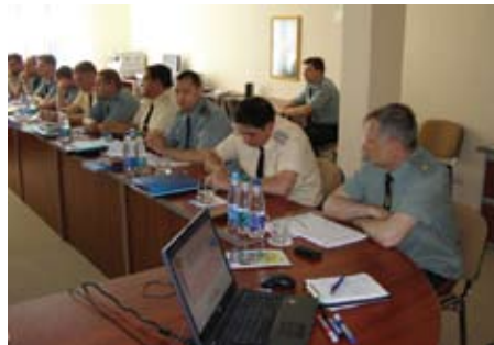
Один з навчальних семінарів на тему прихильності до здорового способу життя