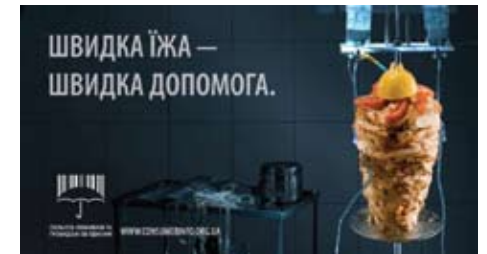
Проект ініціював проведення хвилі соціальної реклами “Швидка їжа - швидка допомога», яка закликає людей не вживати в їжу “джанк-фуд”

Проект спільно з Міносвіти України розробив навчально-методичний посібник “Основы потребительских знаний”. Навчальний посібник створено як наскрізний (1-12 класи) курс за вибором. Програмі курсу побудовано таким чином, що він може вивчатися як окремий предмет, так і забезпечувати школярів споживчим знанням через їх інтеграцію до змісту інших предметів. В основу курсу покладена необхідність навчити школярів умінню орієнтуватись на ринку товарів та послуг, знаходити інформацію споживчого характеру та ефективно реалізовувати свої споживчі права.