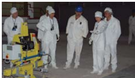
Інспекція на ЧАЕС під проводом Державного комітету ядерного регулювання України

Деякі інші приклади співпраці наведені у наступних розділах.