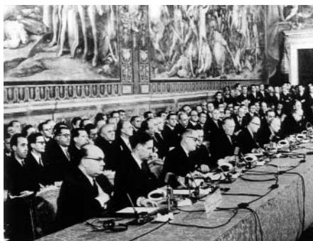
Лідери урядів шести країн підписують Римський договір

Британія) вирішили заснувати Європейську асоціацію вільної торгівлі (ЄАВТ). Відповідну конвенцію було підписано в Стокгольмі 4 січня 1960 року.