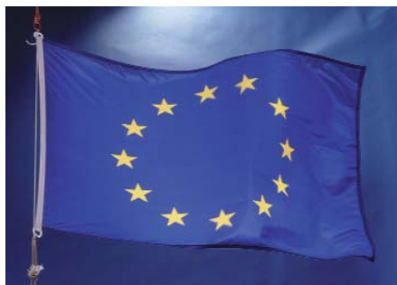
Прапор Європейського Союзу

19-21 листопада - підписано Хартію нової Європи.