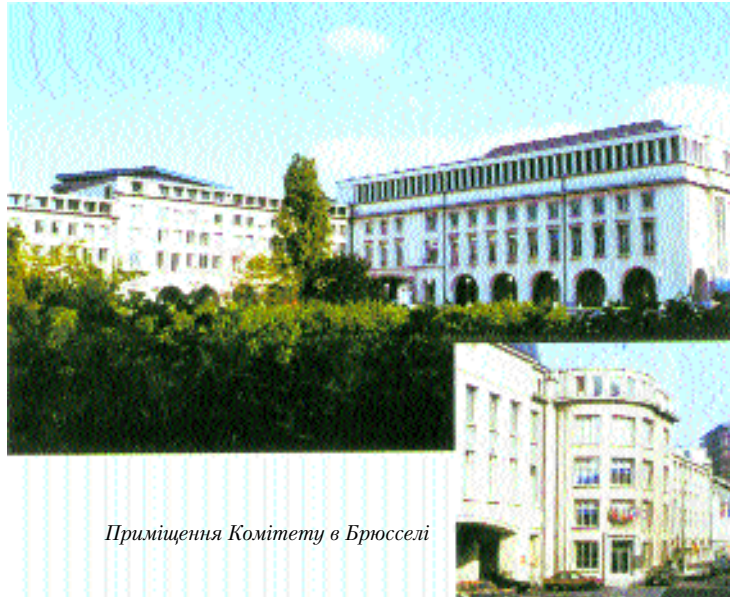
Приміщення Комітету в Брюсселі