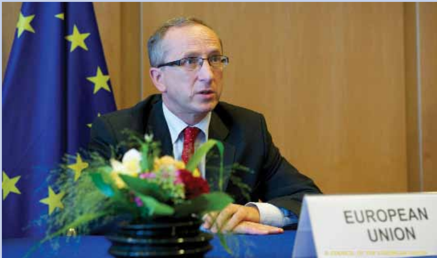
10 вересня 2012 року новопризначений Голова Представництва ЄС в Україні Посол Ян Томбінський вручив вірчі грамоти Президенту України Віктору Януковичу.