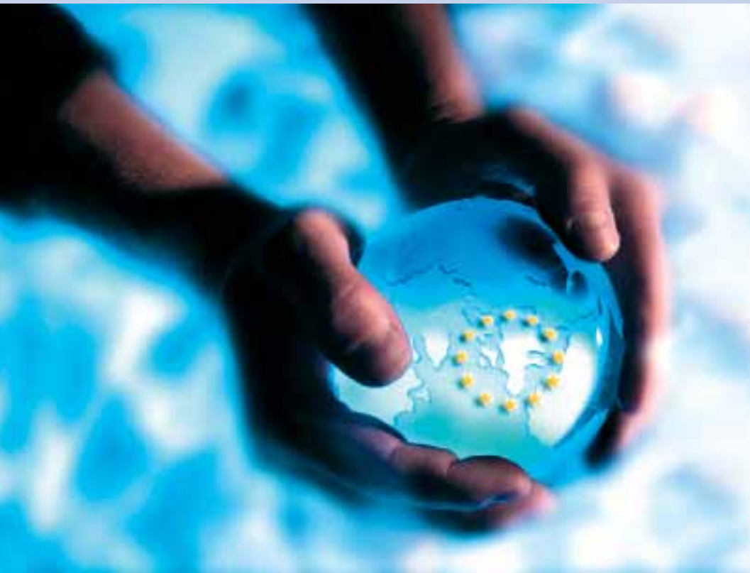
Європейців дедалі більше хвилює довкілля (стор. 6)