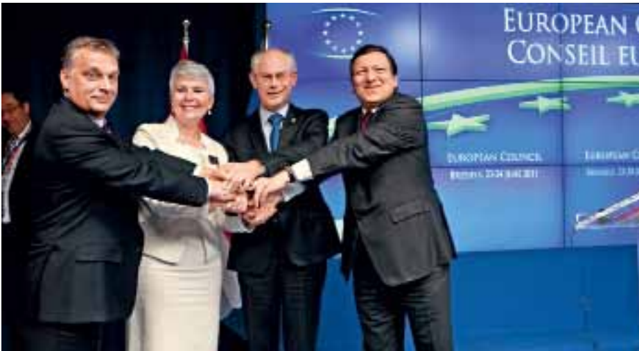
На фото (справа наліво): Президент Європейської Комісії Жозе Мануел Баррозу, Президент Європейської Ради Герман Ван Ромпей, прем'єр-міністр Хорватії Ядранка Косор та прем'єр-міністр Угорщини Віктор Орбан

Хорватія стане наступним, 28-м, членом Європейського Союзу. Наприкінці червня завершено переговори про приєднання її до ЄС. Очікується, що Угоду про вступ підпишуть до кінця року.