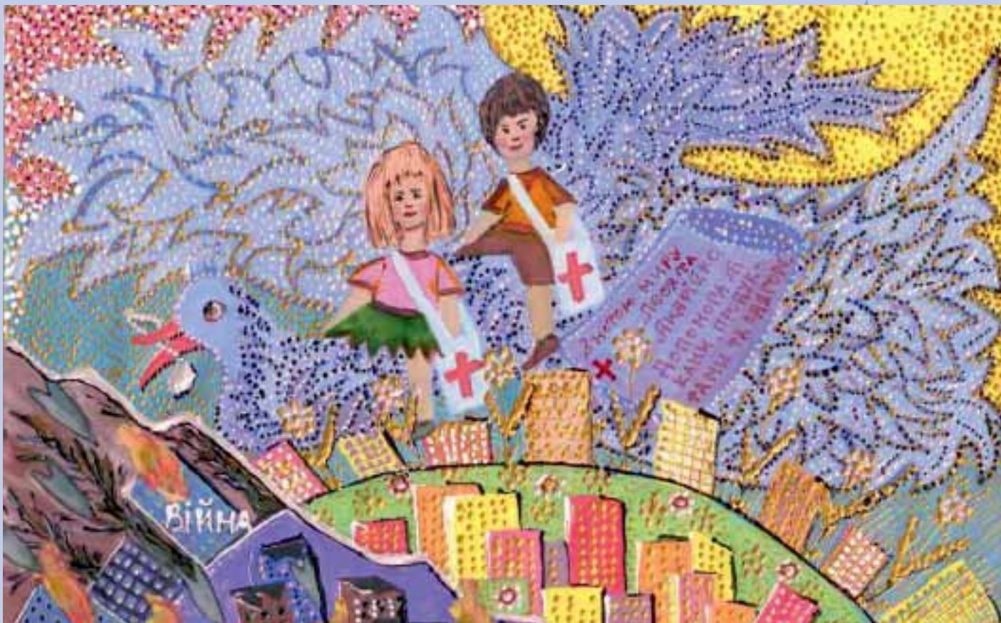
Юні українці малюють світ рівних можливостей: роботи фіналістів конкурсу Маріанни Бартошевської, Євангеліни Бут, Наталії Макогон