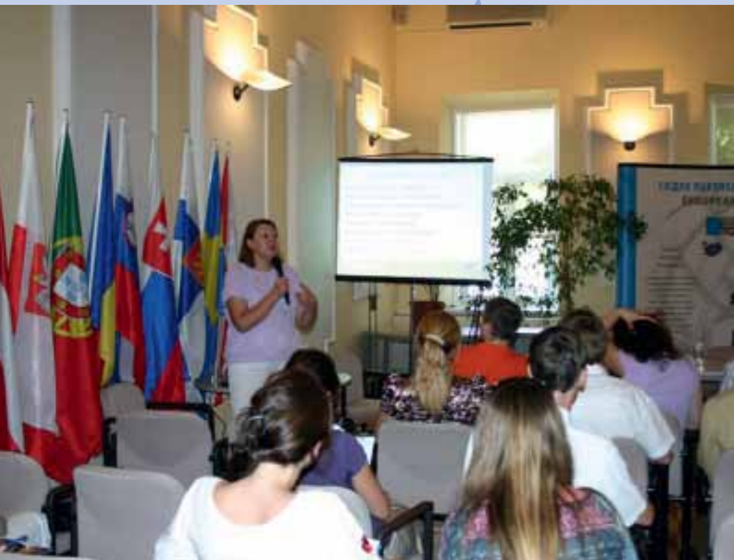
Стипендіати „Еразмус Мундус” зустрілися у Представництві ЄС в Україні (стор. 23)