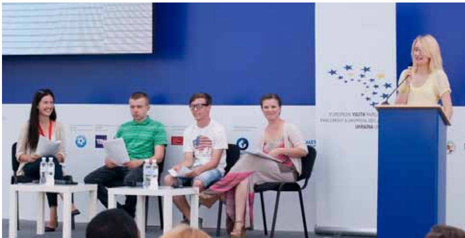
В рамках тематичних днів „Ініціатива майбутнього – молодь” Європейський молодіжний парламент-Україна долучився до численних дискусій

Насправді можливості, які надавав цей проєкт, були величезними, і саме такі заходи здатні дієво впливати на євроінтеграційні процеси та популяризацію європейських цінностей. Звичайно, хотілося б, щоб відвідувачів Євромістечка було ще більше, але взагалі його робота мені дуже сподобалася (за офіційними даними, Європейське містечко відвідали понад 90000 киян та гостей міста. – Ред.). ☺