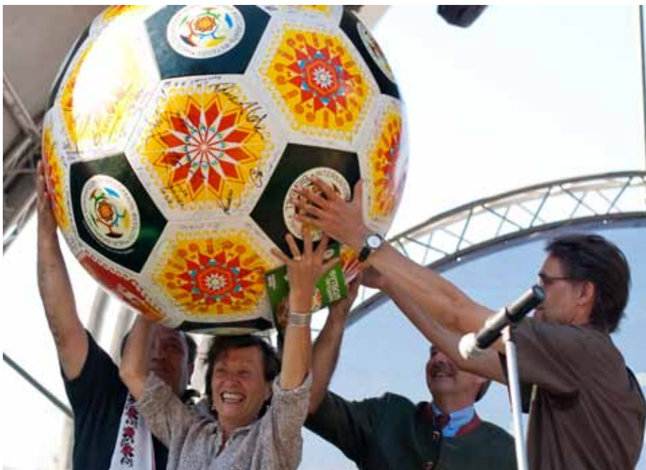
Послу Франції в Україні Алену Ремі передано „Великий м'яч” з автографами усіх гравців арени „Fair Play”. М'яч помандрує до Франції, яка прийматиме Євро-2016

2 червня у Києві під Аркою Дружби народів постало Європейське містечко. Спільний проект Представництва Європейського Союзу в Україні та Київської міської державної адміністрації, що здійснювався в рамках міжнародного українсько-німецького співробітництва, тривав місяць і завершився 1 липня.