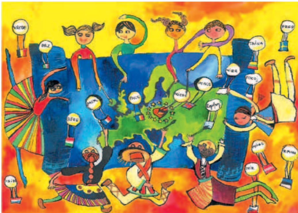
Міхаела Чьонті (Туреччина)