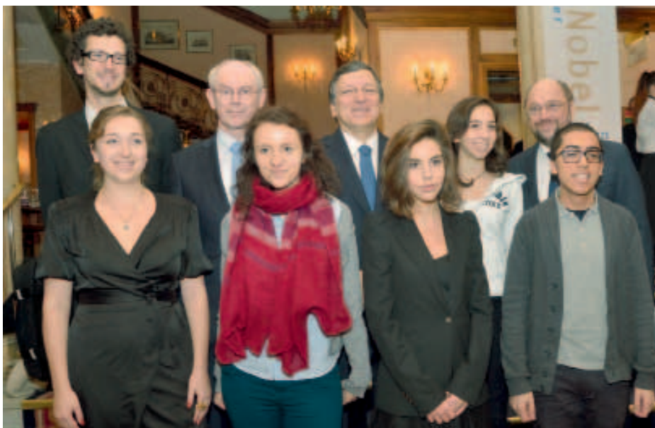
Малюнки учасників конкурсу «Peace Europe Future» дивіться на 4-й сторінці обкладинки.

А найчастіше Нобелівську премію миру вручали Міжнародному комітетові Червоного Хреста – у 1917, 1944, 1963 рр.