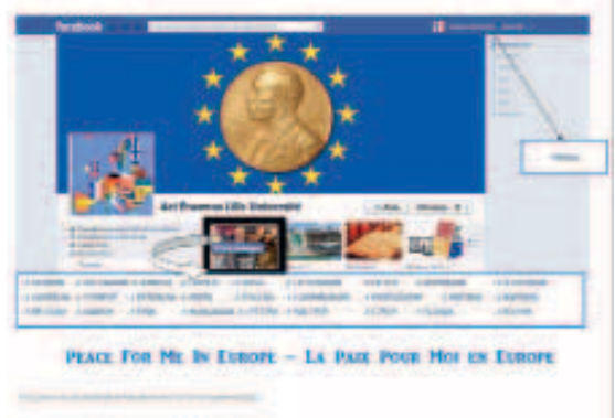
Матео Гетхебер (Франція)