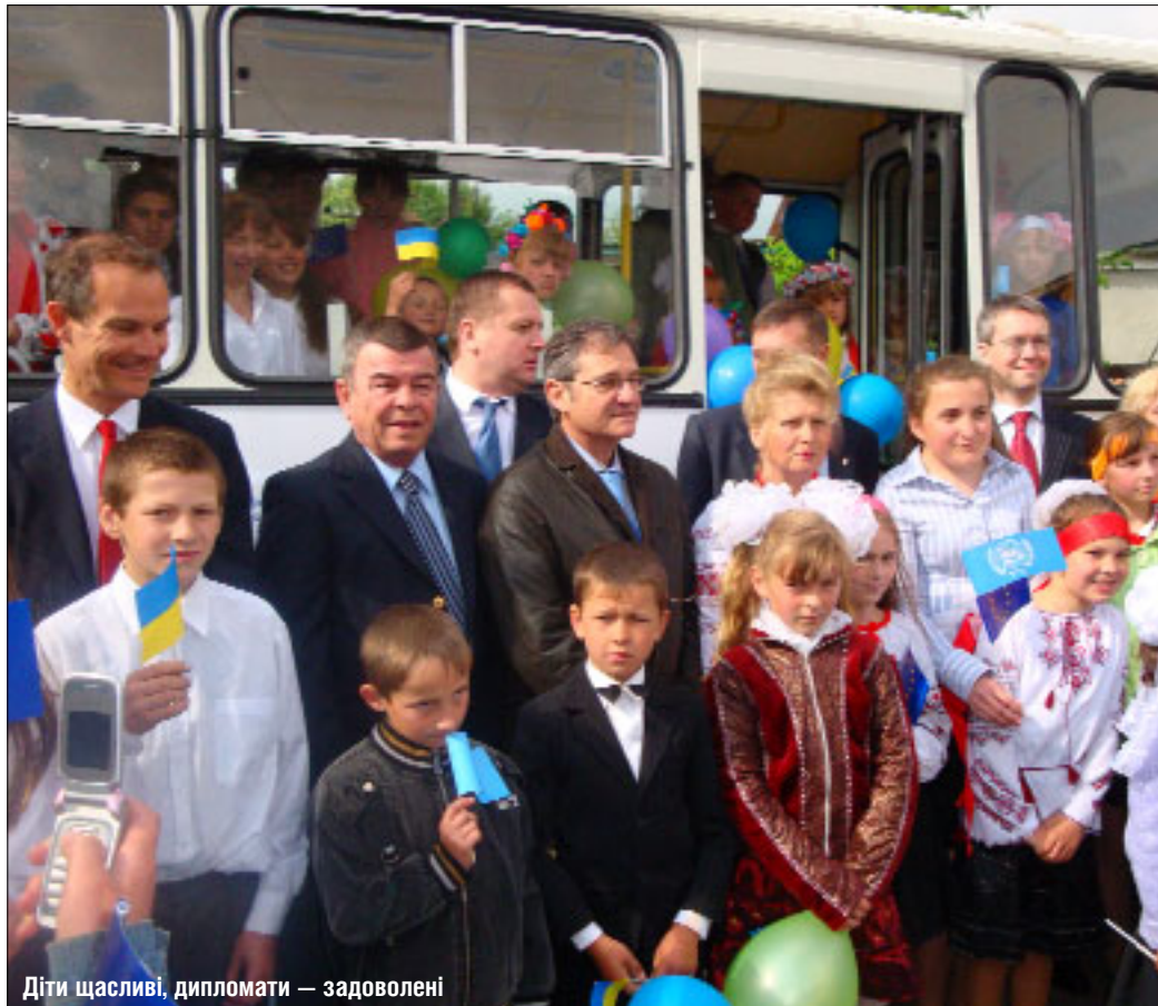
Діти щасливі, дипломати — задоволені

Причина такого серйозного візиту до Вишгородка була вагомою: участь в урочистостях, присвячених передачі місцевій громаді