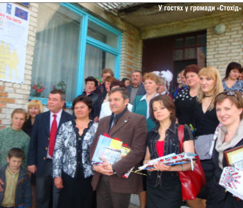
У гостях у громади «Стохід»

Вітаючи громаду, Уповноважений керівник офісу ПРООН в Україні Ерджин Мурат зазначив: дуже важливо те, що громада Кисилина визначила, що хоче зробити, і взяла на себе відповідальність за те, що робить. □