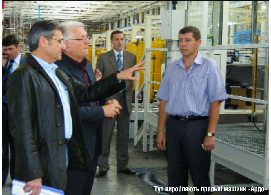
Тут виробляють пральні машини «Ардо»

А потім День Європи рушив у мальовничі Карпати — до курортного містечка Яремче. Туди крім Жозе Мануеля Пінту Тейшейри прибули послы Великої Британії Лі Тернер, Греції Харіс Дімітріу та Туреччини Ердоган Шериф Ішджан. У Яремчі реалізують два туристичні проекти, фінансовані Євросоюзом: «Велокарпаття» та «Створення транскордонної мережі розвитку та просування туризму між Івано-Франківською областю України та повітом Марамуреш Румунії». В рамках останнього недавно було збудовано Інформаційно-туристичний візит-центр. Він є на сьогодні найбільшим та найсучаснішим в Україні. Створенням його опікувалася Туристична асоціація Івано-