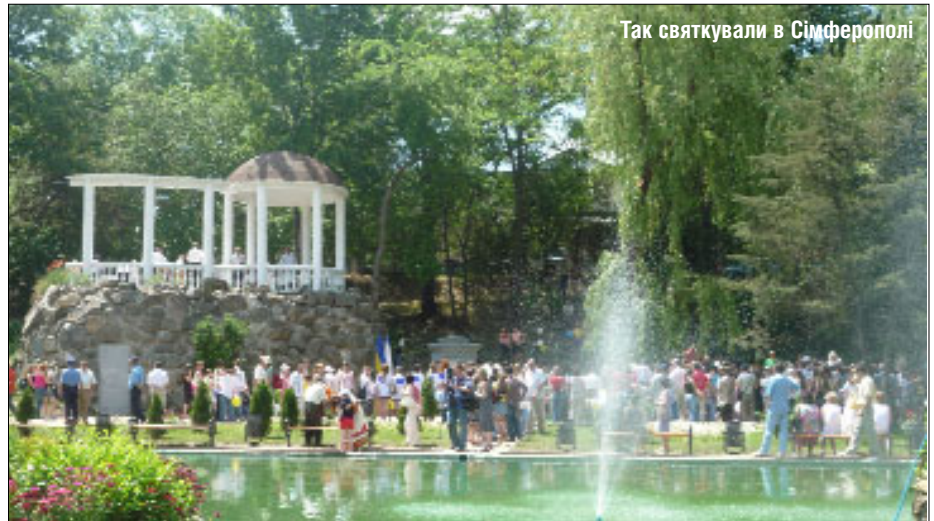
Так святкували в Сімферополі

Дні Європи в Криму завершили нинішню низку феєричних святкувань, які майже місяць котилися Україною: із заходу на схід, зі сходу на південь. Вони за своєю масштабністю перевершили всі попередні святкування. Що ж, гарний стимул для проведення ще більш успішних Днів Європи-2010. □