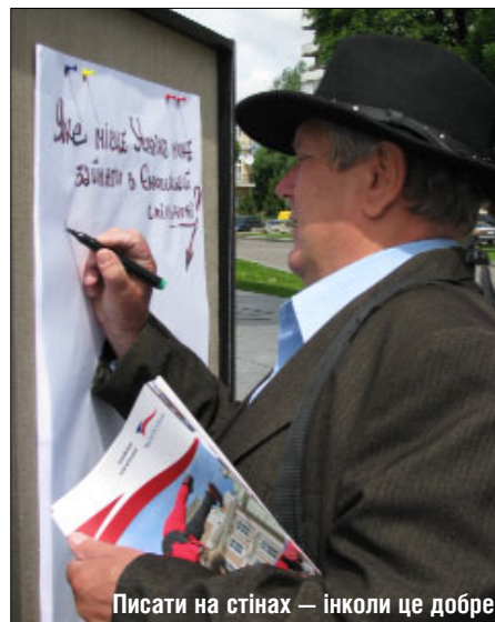
Писати на стінах — інколи це добре

Крім конкурсу «Євробачення» та велопа�раду День Європи в Луцьку мав ще кілька родзинок. Наприклад, «Стіну листів» — кожен міг письмово висловити своє бачення відносин України та Євросоюзу, євроінтеграції як такої. Як і скрізь, День Європи виконував свою просвітницьку місію: у центрі міста волонтери роздавали перехожим буклети та листівки про країни ЄС.