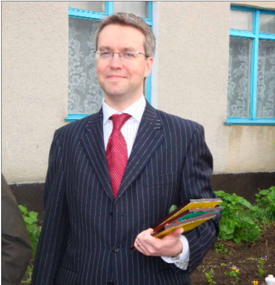
У селі Вишгородок на Тернопільщині

З 1 липня на пост головуючої в ЄС країни заступила Швеція. Її посол в Україні Стефан Гуллгрєн розповів «Євробюлетєню» про деякі пріоритети шведського президентства, а також поділився думками стосовно важливих на сьогодні питань відносин ЄС і України.