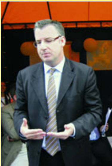
Керівнику відділу політики, преси та інформації Дірку Шюбелю довелося багато розповідати про Європейський Союз під час громадських дискусій