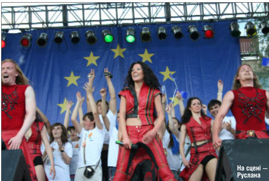
На сцені — Руслана