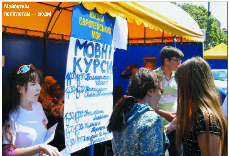
Майбутнім поліглотам — сюди!