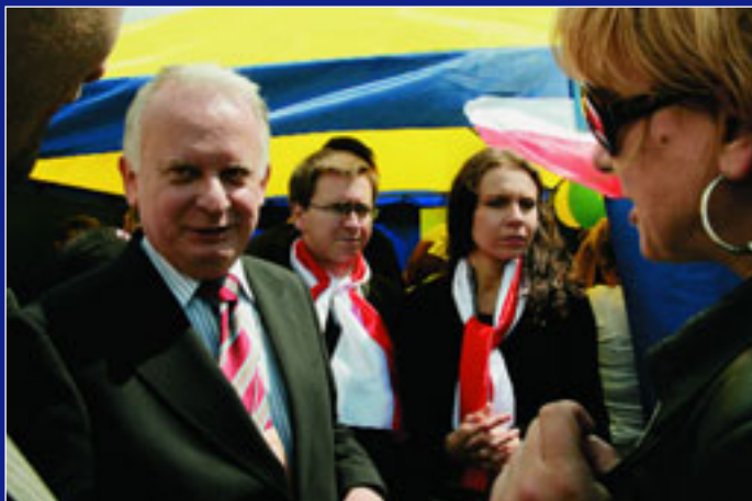
Посол Польщі Яцек Ключковський у польському наметі