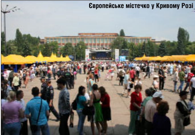
Європейське містечко у Кривому Розі

Після цього делегація рушила до Кривого Рогу. Тамтешня програма розпочалася з надзвичайно цікавого спілкування зі студентами Криворізького технічного університету. За словами керівника Відділу преси та інформації Представництва Єврокомісії Дірка Шюбеля найбільше дипломатів вразило запитання про те, яким послами бачать ЄС через 50 років.