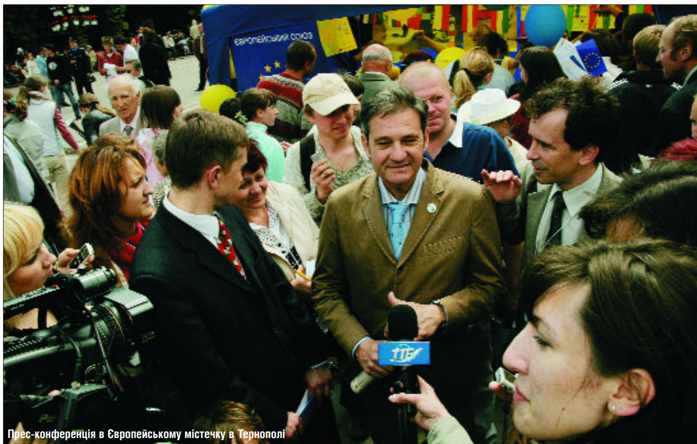
Прес-конференція в Європейському містечку в Тернополі

Голова Представництва Європейської Комісії в Україні Жозе Мануель Пінту Тейшейра був найактивнішим учасником цьогорічних Днів Європи від дипломатичного корпусу — він взяв участь в усіх подіях, що проводилися в рамках святкувань, організованих спільно Єврокомісією, Міністерством закордонних справ та місцевими органами влади. Про це йшлося в інтерв'ю посла «Євробюлетеню».