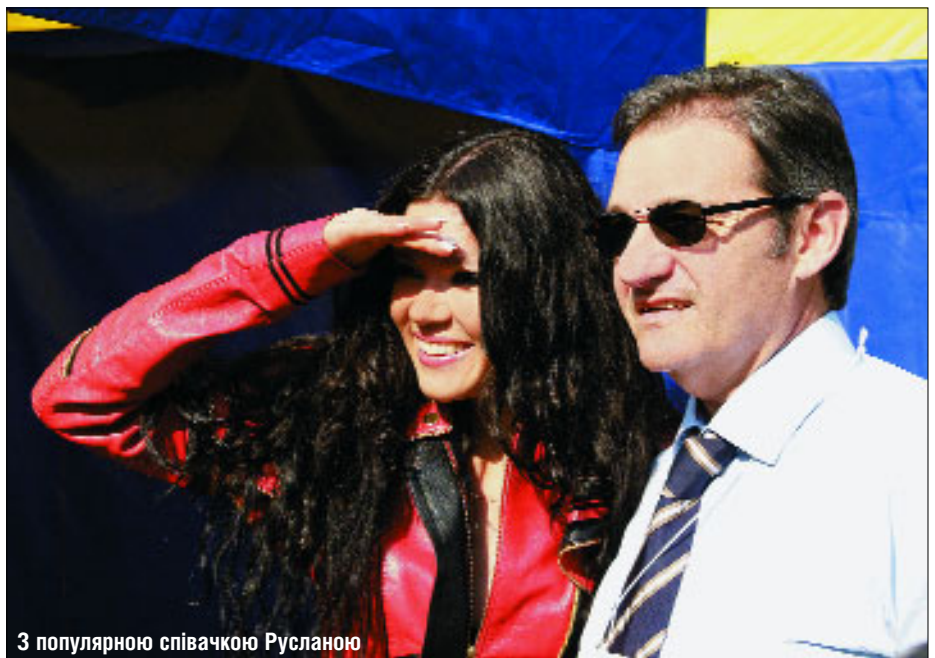
З популярною співачкою Русланою

— Я не побачив жодної різниці. Це невірне уявлення. Наша участь в Днях Європи і спілкування з людьми його спростували. ■