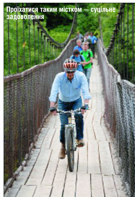
Проїхатися таким містком — суцільне задоволення

Яремче є містом обласного значення. Воно розташоване на південному заході Івано-Франківщини в долині річки Прут на висоті 585 метрів над рівнем моря. Популярним центром відпочинку є ще з XVIII століття. У Яремчі мешкають близько 8 тис. осіб.