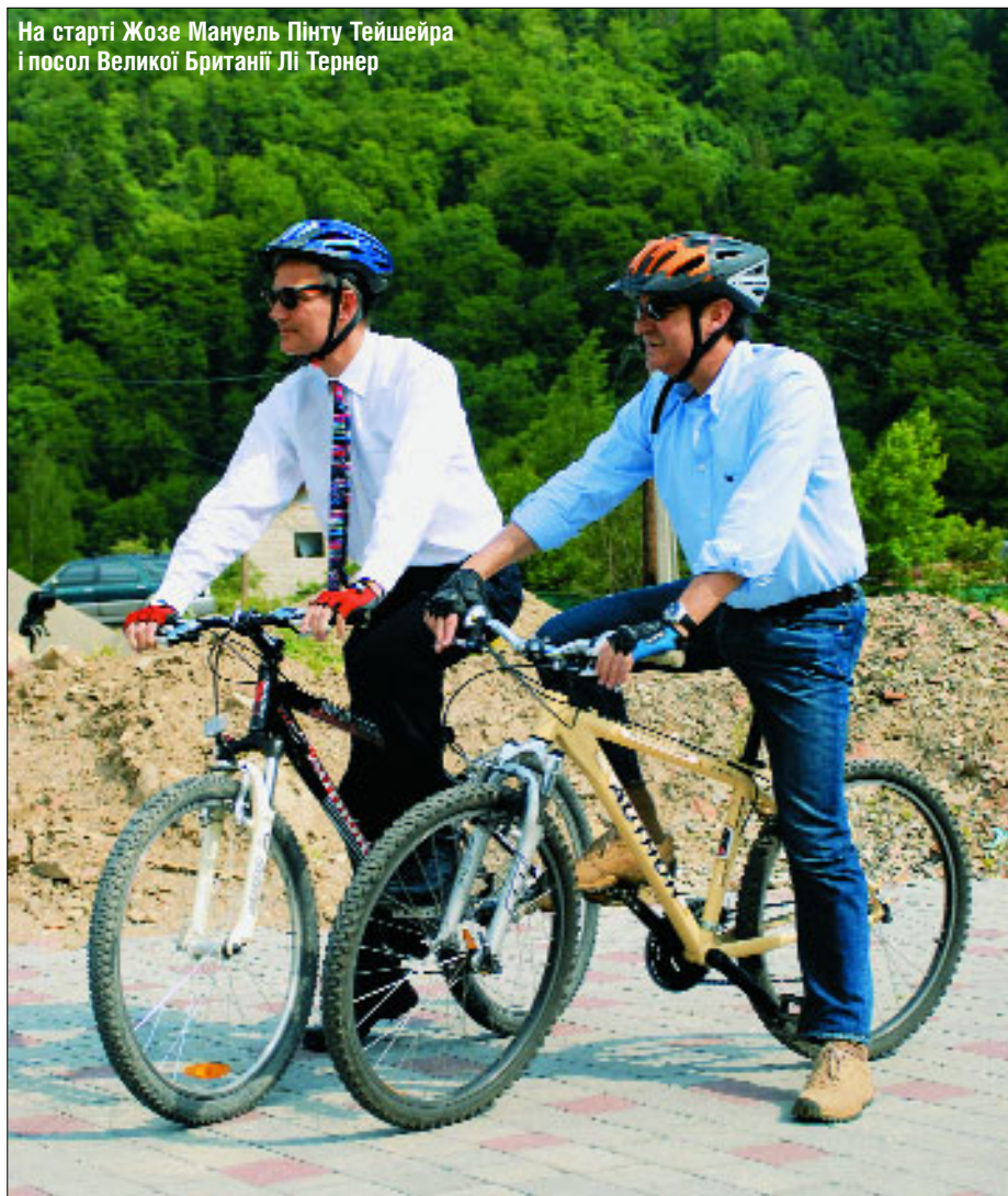
На старті Жозе Мануель Пінту Тейшейра і посол Великої Британії Лі Тернер

— Дуже радий, що українська сфера туризму активно розвивається, — сказав він. — Я захоплений красою Карпат і хочу прийти сюди на довше з власним велосипедом.