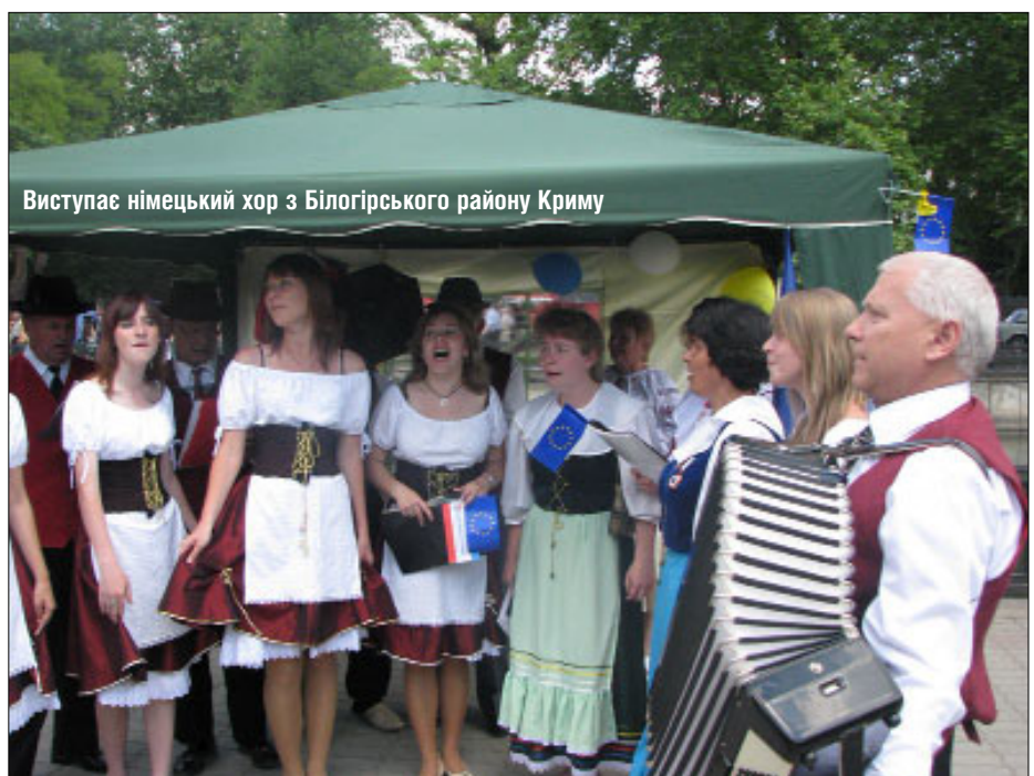
Виступає німецький хор з Білогірського району Криму