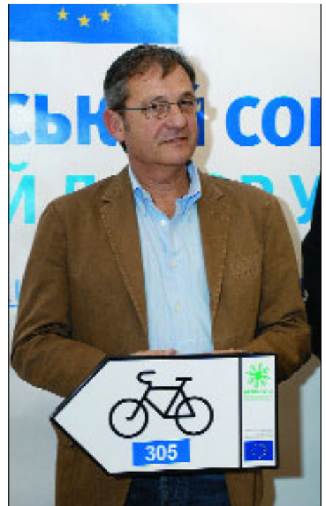
Жозе Мануель Пінту Тейшейра перед велосипедним заїздом

Дипломати проїхалися на гірських велосипедах одним із маршрутів довжиною 5 кілометрів. Враження були надзвичайно позитивні. За свідченнями очевидців, фізична форма у послів відмінна — після 5 кілометрів велопогулянки навіть не захекалися. Жозе Мануель Пінту Тейшейра висловив бажання приїхати до Яремчі на тривалий відпочинок.