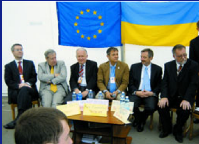
Типова для цього річних Днів Європи картина: дипломати у наметі громадських дебатів відповідають на запитання. Зліва направо: послы Швеції Стефан Гуллгрєн, Угорщини Андраш Баршонь, Польщі Яцек Ключковський, Голова Представництва Єврокомісії Жозє Мануель Пінту Тейшейра, послы Німеччини Ганс-Юрген Гаймзьот і Чехії Ярослав Башта