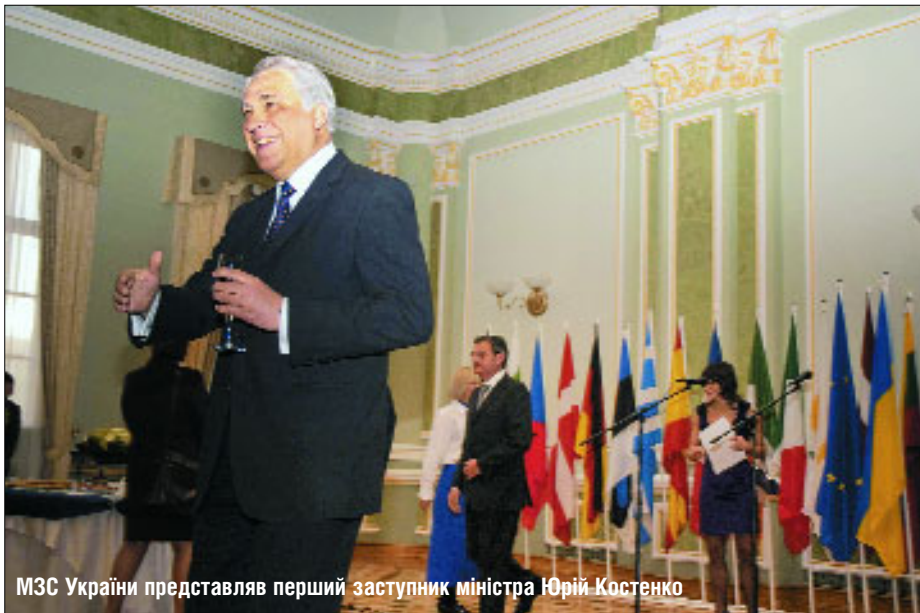
МЗС України представляв перший заступник міністра Юрій Костенко

Святкування Дня Європи в Києві розпочалося з урочистого прийняття, яке дав на честь свята Голова Представництва Єврокомісії в Україні Жозе Мануель Пінту Тейшейра. Воно відбулося у Дипломатичній академії МЗС України.