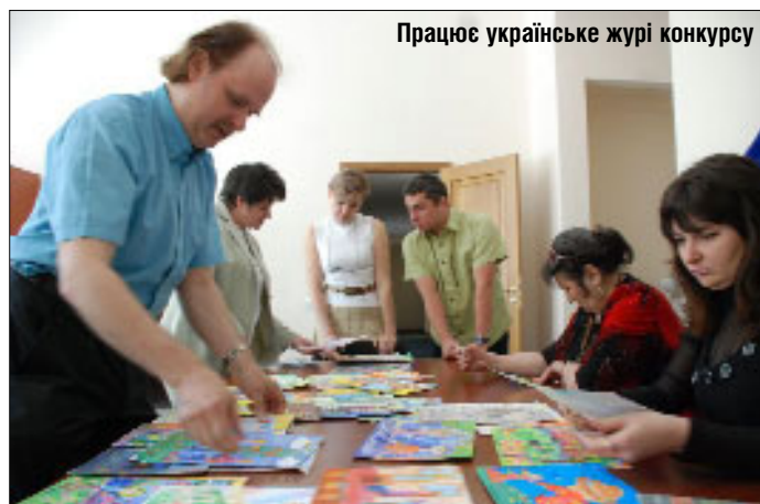
Працює українське журі конкурсу