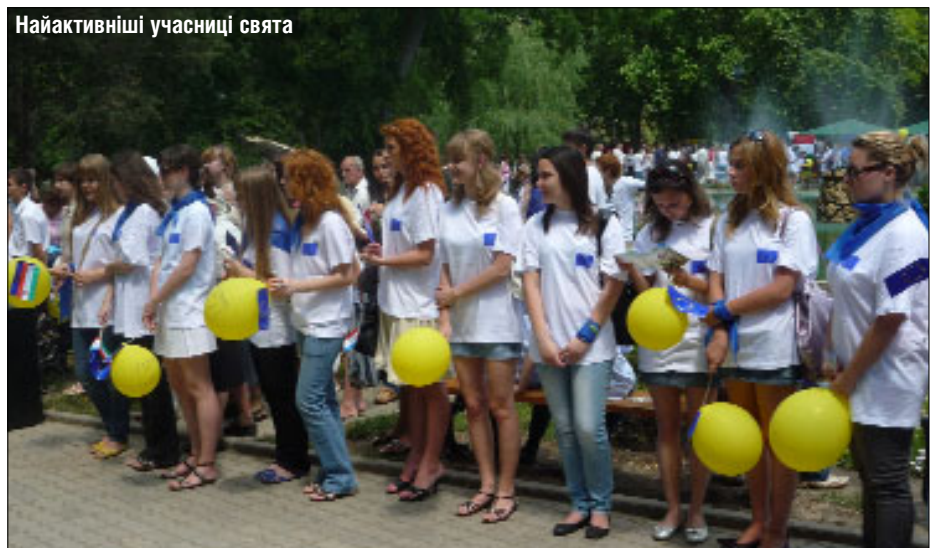
Найактивніші учасниці свята