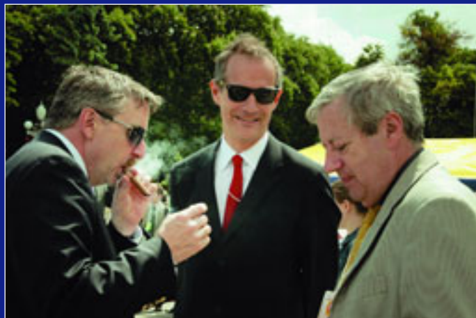
Короткий відпочинок... Зліва направо: послы Німеччини Ганс-Юрген Гамзьот, Великої Британії Лі Тернер і Угощини Андраш Баршонь