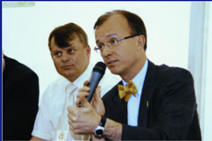
Посол Фінляндії Крістер Міккелссон під час громадських дискусій