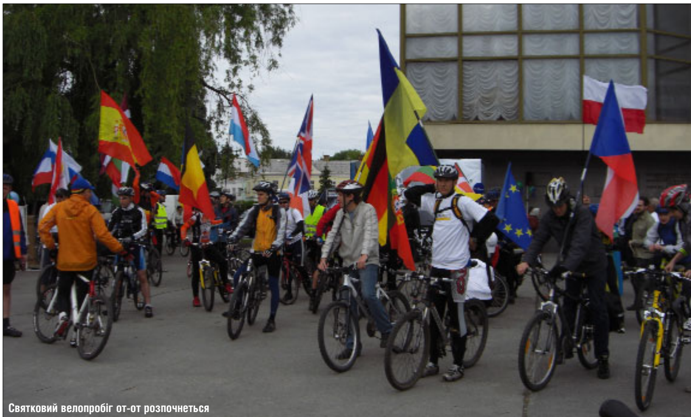
Святковий велопробіг от-от розпочнеться

У Луцьку День Європи пройшов 23–24 травня, проте підготовка до нього розпочалася набагато раніше. У квітні в області відбулися змагання «Європейська олімпіада», конкурс декоративно-творчих робіт та «Євробачення». В ньому школярі представляли країни — члени ЄС, традиції та звичаї мешканців.