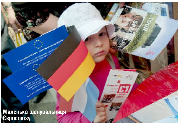
Маленька шанувальниця Євросоюзу

Саме святкування було веселим, сповненим музики. Виступали місцеві гурти й колективи, а завершився День Європи виступами литовської групи «ІнКульт» та Руслани. Після обіду пішов дощ, але настрою учасникам свята та його самого він аж ніяк не зіпсував. □