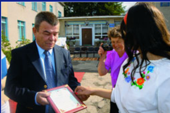
Уповноважений керівник офісу ПРООН в Україні Ерджан Мурат отримує подяку від мешканців села Вишгородок на Тернопільщині

Одним із плюсів минулих Днів Європи була активна участь у них дипломатів. Понад 20 європейських країн відряджали їх у турне українськими регіонами. Посли та інші співробітники дипмісії спілкувалися з представниками влади та студентами, пересічними людьми й журналістами. Це було надзвичайно цікаве, взаємкорисне спілкування. Дипломати змогли краще відчувати Україну й українців, а мешканці регіонів мали гарну нагоду поставити будь-які запитання тим, хто на цих Днях Європи персонально уособлював для них Європейський Союз.