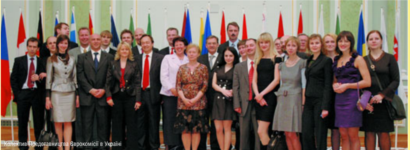
Колектив Представництва Єврокомісії в Україні

Успіх цьогорічних Днів Європи в Україні відбувся багато в чому завдяки колективу Представництва Європейської Комісії в Україні, особливо працівникам відділу політики, преси та інформації. Вони проводили величезну підготовчу роботу у Києві, потім виїжджали у міста й села, де проходили святкування.