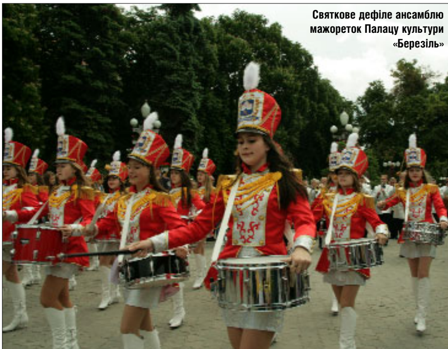
Святкове дефіле ансамблю мажореток Палацу культури «Березіль»

Водночас розпочинається концертна програма. Вона надзвичайно насичена: хорова школа «Заринка», марш-парад духових оркестрів Тернопільщини та дефіле за участю Муніципального духового «Оркестру волі» й ансамблю мажореток Палацу культури «Березіль» ім. Леся Курбаса. Народний театр танцю «Посмішка» міського Центру дітей та юнацтва виконує «Українську сюїту», а учасники театру пісні «Мікст» — «Аве Марія» Шуберта. Також виступали Духовий оркестр Коропецького міського будинку культури, зразковий театр пісні «Співаночка» міського Центру дітей та юнацтва. Родзинкою і завершенням свята став концерт гурту «С.К.А.Й.» та Руслани. □