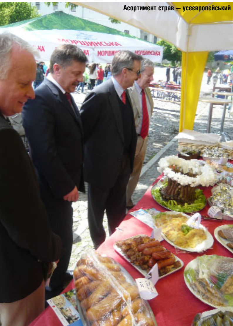
Асортимент страв — усєвропейський

А на Замковій площі проходила виставка-ярмарок традиційних страв народів Європи. Можна було перекусити чеськими грибами в пиві, французькою рибою з креветками, польськими фаршированими помідорами та іншою смакотою. Всім бажаючим кухарі розповідали про особливості приготування страв у тих чи інших країнах. Завершилося свято на Театральному майдані фольклорно-джазовим фестивалем.