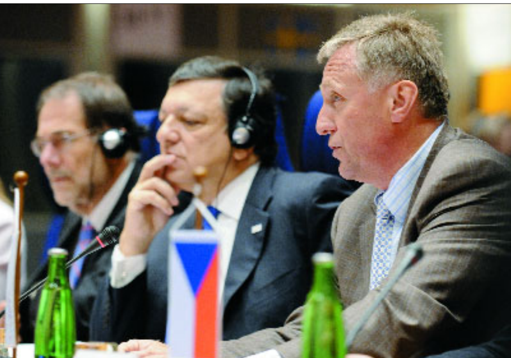
Під час саміту (зліва-направо): Верховний представник ЄС з питань спільної зовнішньої та безпекової політики Хав'єр Солана, Президент Єврокомісії Жозе Мануель Баррозу і прем'єр Чехії Мірек Тополанек.

рамках укладеного з ними Пакту стабільності, і це працювало. Саме це є великою додатковою вартістю для України.