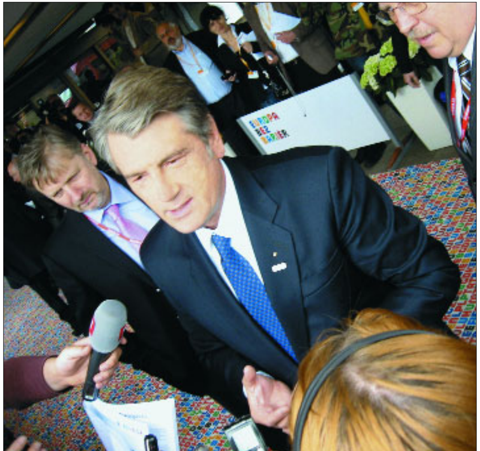
Вийшовши з авто, Віктор Ющенко потрапив «у полон» до українських журналістів.

— Яку ж додаткову вартість несе Східне партнерство Україні, що вже має багато із запланованого в рамках ініціативи — угоду про спрощення візової процедури, перемовини з Угоди про асоціацію й зони вільної торгівлі, діалог з безвізового режиму? — запитав у Комісара «Єврбюлетень».