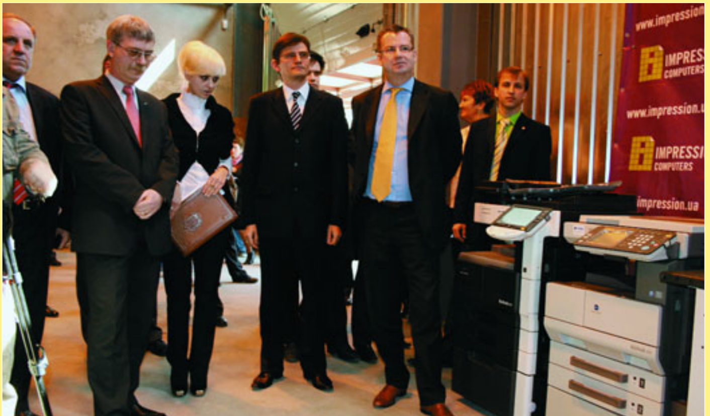
Центральній виборчій комісії України передано придбане за кошти ЄС обладнання для створення реєстру виборців (стор. 10) На фото — під час церемонії передачі техніки (зліва направо): координатор проектів ОБСЄ в Україні Любомир Копай, заступник голови ЦВК Жанна Усенко-Чорна, в.о. голови ЦВК Андрій Магера, керівник відділу політики, преси та інформації Представництва Єврокомісії Дірк Шюбель.