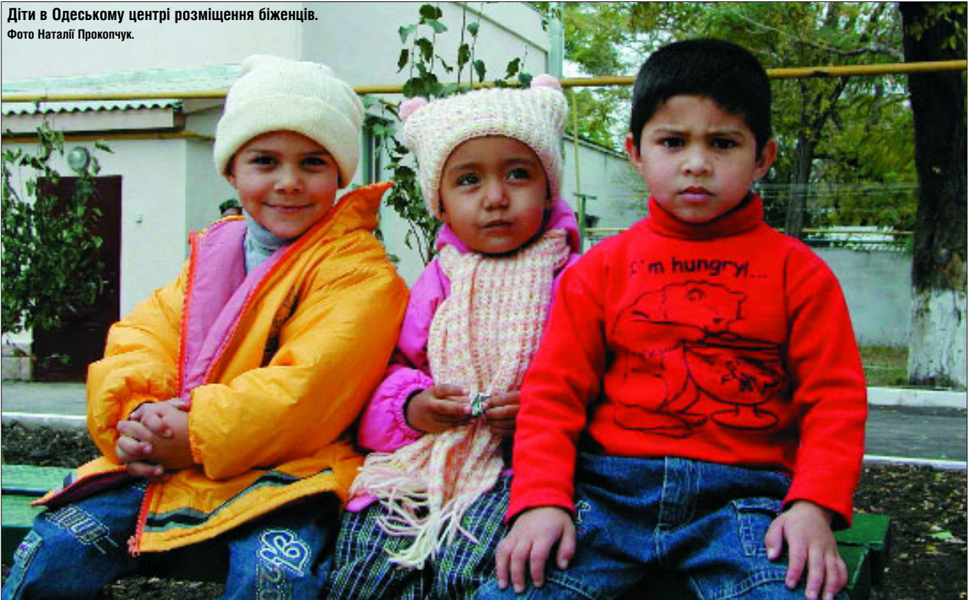
Діти в Одеському центрі розміщення біженців.

Розпочато фінансований Євросоюзом регіональний проект, спрямований на сприяння інтеграції біженців в Україні, Білорусі й Молдові. Реалізовувати його протягом двох років буде Управління Верховного комісара ООН у справах біженців у тісному співробітництві з органами державної влади, громадянським суспільством та громадами біженців у трьох країнах.