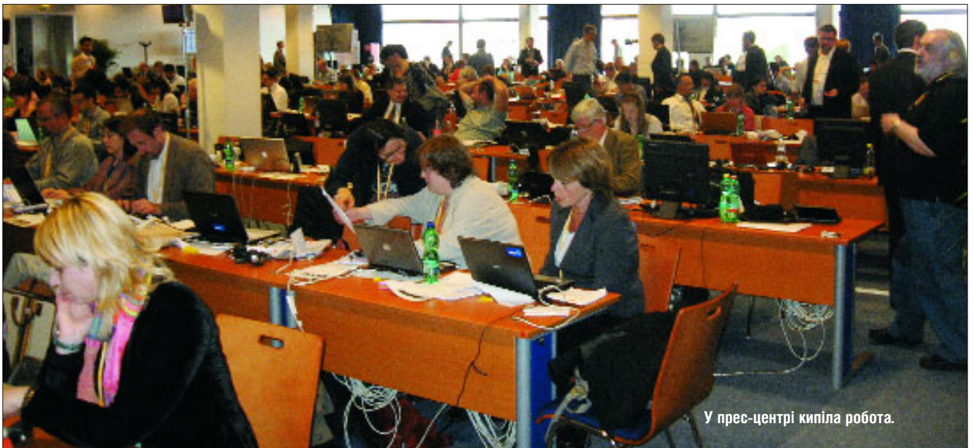
У прес-центрі кипіла робота.

— платформи багатостороннього компоненту Східного партнерства. У цьому випадку працюватимуть разом всі шість країн-партнерів і 27 країн ЄС. Йдеться про цілком практичні речі, наприклад обміни інформацією. Цю ідею взято з досвіду наших стосунків з балканськими країнами. Подібні речі ми робили в