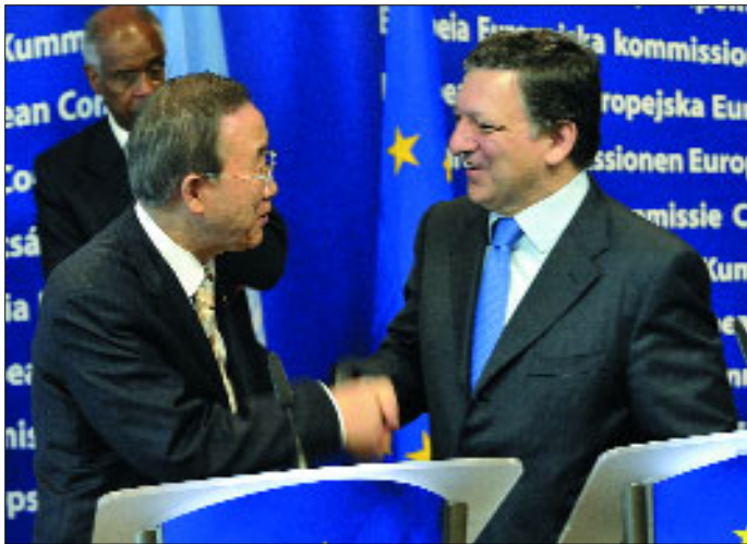
Президент Єврокомісії Жозе Мануель Баррозу і Генеральний секретар ООН Бан Кі-Мун.

Східноафриканська країна Сомалі опинилася в останні місяці в центрі світової уваги через регулярні випадки захоплення тамтешніми піратами суден. Однак така ситуація має свої глибинні причини, насамперед значну бідність у цій країні. Європейська Комісія приймала у квітні у Брюсселі міжнародну конференцію з питань допомоги на підвищення безпеки в Сомалі.