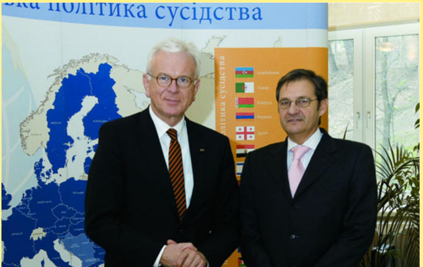
У Києві з офіційним візитом побував Президент Європарламенту Ганс-Герт Поттерінг (ліворуч). На фото він з Головою Представництва Єврокомісії в Україні Жозе Мануелем Пінту Тейшейрою (стор. 9).