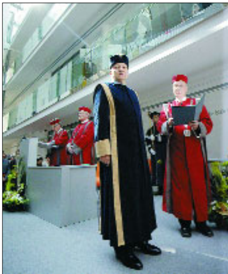
Недавно Жозе Мануель Баррозу отримав титул почесного доктора Університету Томаша Бата в чеському місті Зліні.

У квітні в Лондоні відбувся саміт двадцяти найпотужніших країн світу (G20), участь в якому узяв і Президент Європейської Комісії Жозе Мануель Баррозу. Найзначнішим результатом форуму стало рішення про виділення на подолання глобальної кризи 1,1 трильйона доларів США. Безперечно, не менше важливою була сама дискусія, обмін думками. Очільник Єврокомісії взяв у ній активну участь.