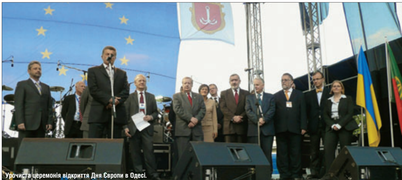
Урочиста церемонія відкриття Дня Європи в Одесі.

Крім української столиці, День Європи побував цьогоріч на півдні та сході країни. В Одесі він пройшов 14 травня. Центром святкування став Приморський бульвар — саме там удень розмістилося Європейське містечко, а ввечері відбувся гала-концерт.