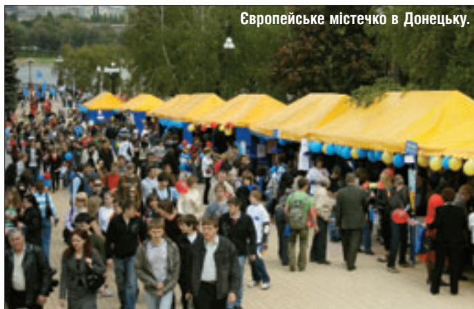
Європейське містечко в Донецьку.

ЯК І В КИЄВІ, В ОДЕСІ БУЛА ПРЕДСТАВЛЕНА МОЛОДІЖНА ГРОМАДСЬКА ОРГАНІЗАЦІЯ «ЄВРОПЕЙСЬКИЙ МОЛОДІЖНИЙ ПАРЛАМЕНТ–УКРАЇНА».