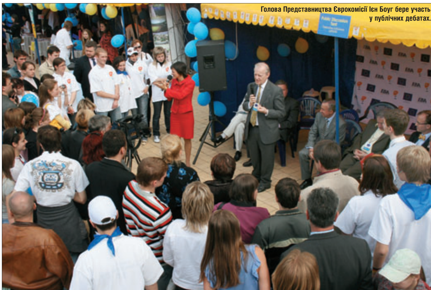
Голова Представництва Єврокомісії Ієн Боуг бере участь у публічних дебатах.

мацію про його діяльність, майбутні міжнародні події, а також умови та вимоги членства в ЄМП.