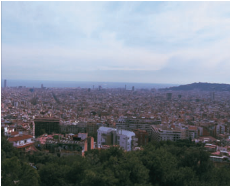
Барселона — тут було започатковане співробітництво Середземноморських країн.

Європейська Комісія розробила й оприлюднила принципи діяльності Союзу Середземномор'я. Рішення про його створення було ухвалене у березні Європейською Радою. Тоді ж глави держав і урядів ЄС доручили Єврокомісії розробити конкретну структуру функціонування цього союзу.