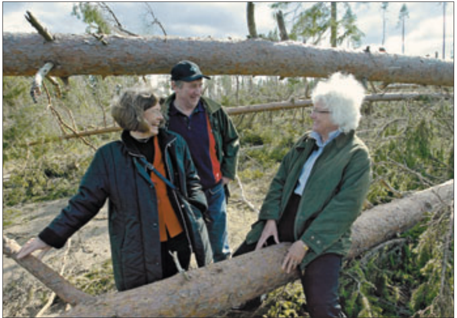
Комісар ЄС з питань сільського господарства Маріанн Фішер Боель (праворуч) під час візиту в Швецію.

ІНТЕРВЕНЦІЙНІ МЕХАНІЗМИ. Заходи, до яких вдається ЄС для забезпечення сільськогосподарської пропозиції, не мають уповільнити здатність фермерів відповідати на сигнали ринку. Європейська Комісія пропонує скасувати інтервенційну по-