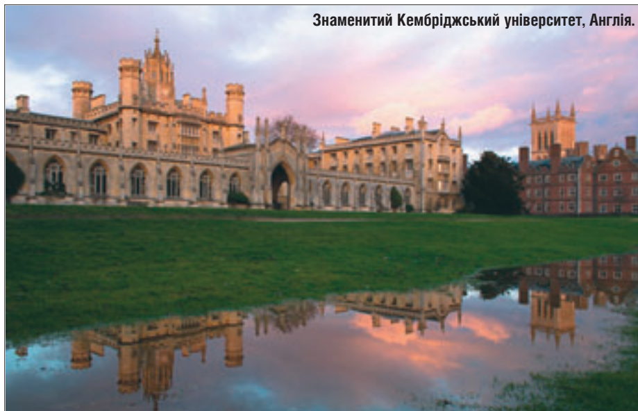
Знаменитий Кембріджський університет, Англія.

Європейська Комісія опублікувала інформацію про динаміку участі європейських студентів та викладачів у програмі академічної мобільності ERASMUS. Завдяки їй студенти й викладачі з однієї країни ЄС можуть вчитися або підвищувати кваліфікацію в іншій.