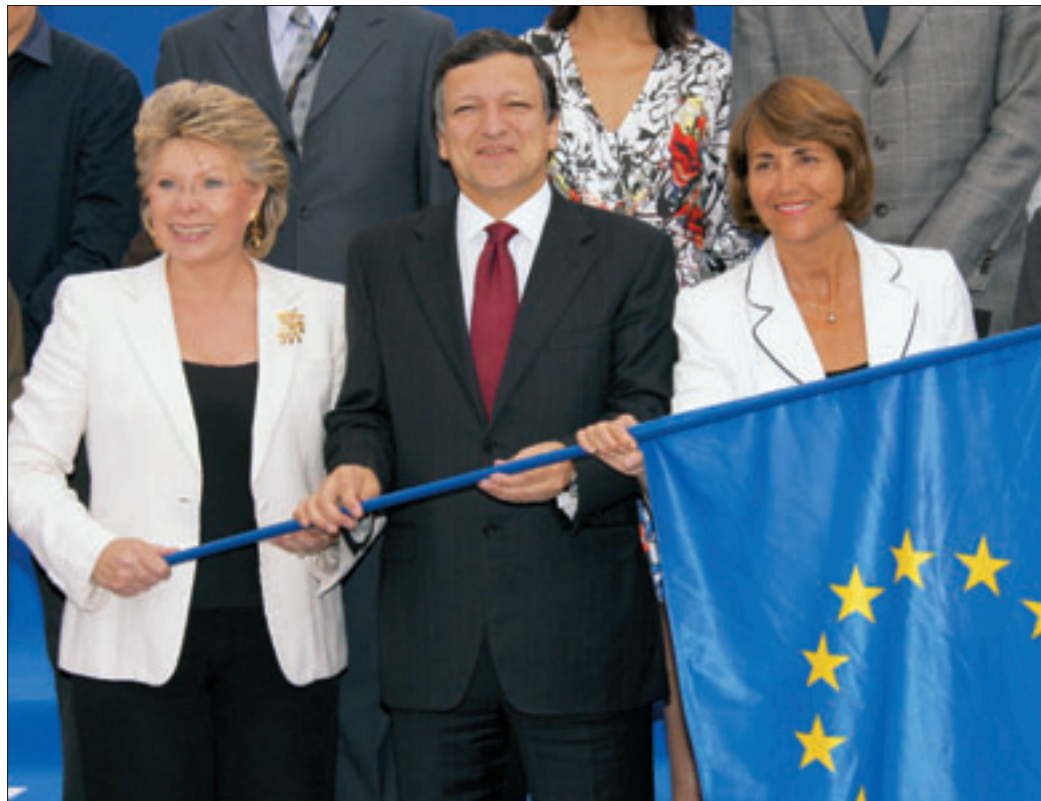
Президент Єврокомісії Жозе Мануель Баррозу, Комісар ЄС з питань медіа та інформаційного суспільства Вівіан Редінг та міністр культури Франції Крістін Анабель на 61-му Канському кінофестивалі.

Через MEDIA ЄС надає фінансову допомогу виробництву та поширенню європейської кінопродукції. Серед минулих лауреатів програми є чимало стрічок, що згодом стали всесвітньо відомими — це і французький документальний фільм «Марш імператорсько-го пінгвіна», і знаменита німецька стрічка