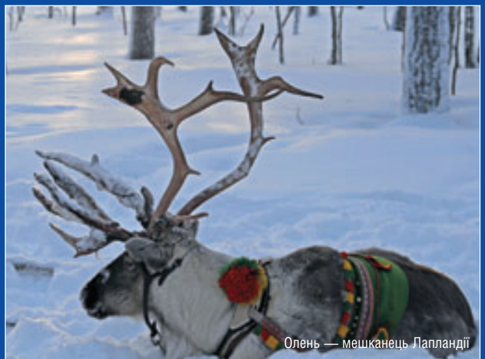
Олень — мешканець Лапландії