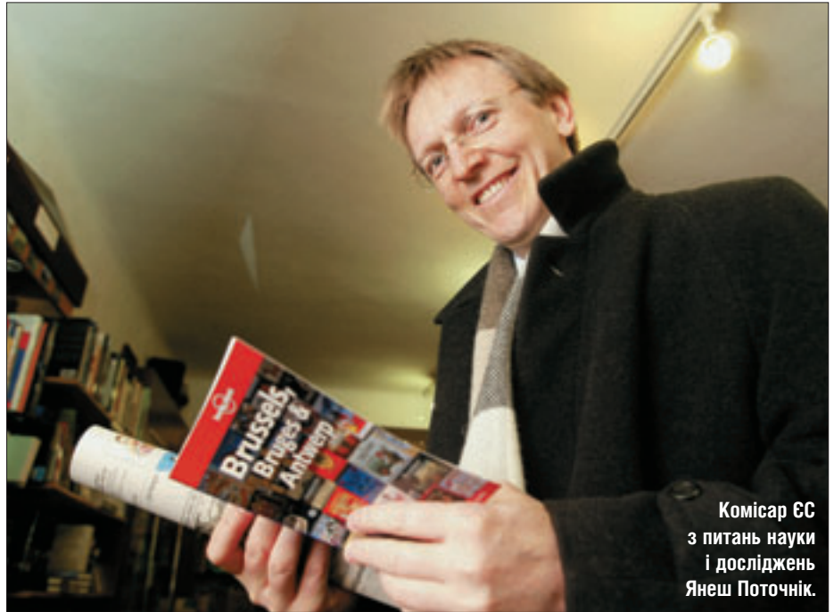
Комісар ЄС з питань науки і досліджень Янеш Поточнік.

Сьогодні у багатьох країнах-членах існують обмеження на набір дослідників на ро-