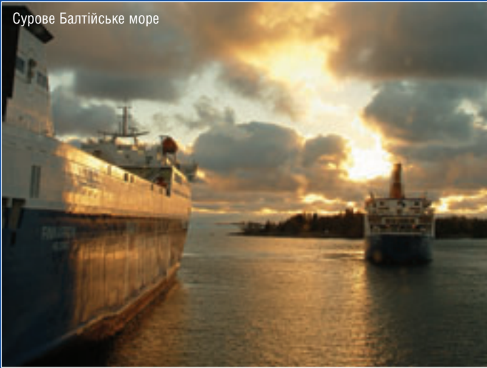
Сурове Балтійське море