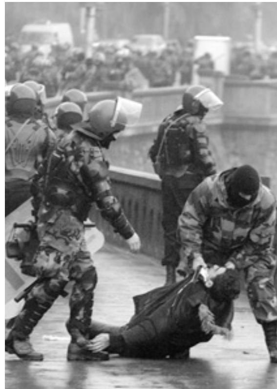
Поліція розігнала акції протесту в Тбілісі 7 листопада.

Верховний представник ЄС з питань спільної зовнішньої та безпекової політики Хав'єр Солана закликав всі сторони до конструктивного діалогу і до утримання від дій, які можуть підірвати розвиток реформ в Грузії — про це повідомила його прес-служба. □