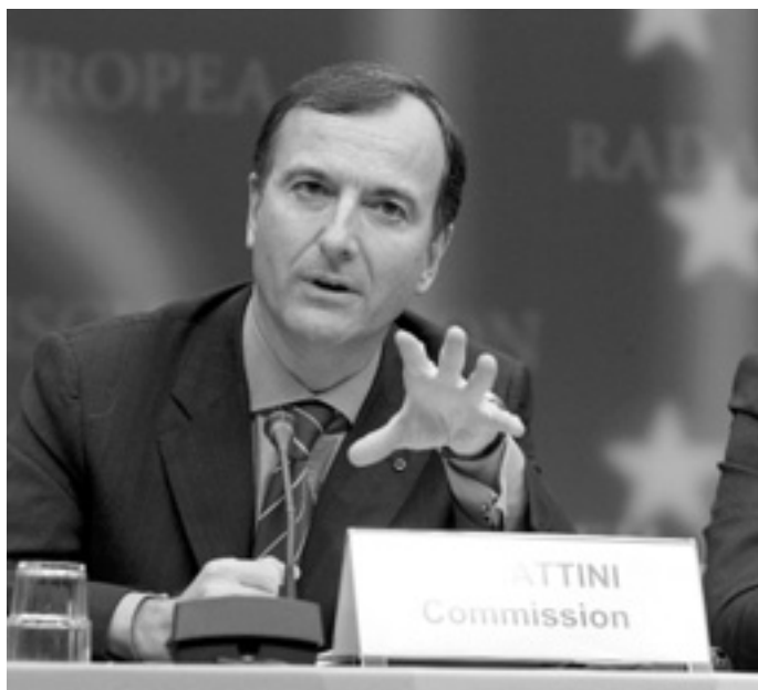
Франко Фраттіні каже, що торік політичного притулку в ЄС добивалися 190 тисяч осіб.

Франко Фраттіні назвав сім головних проблем, що стосуються надання притулку