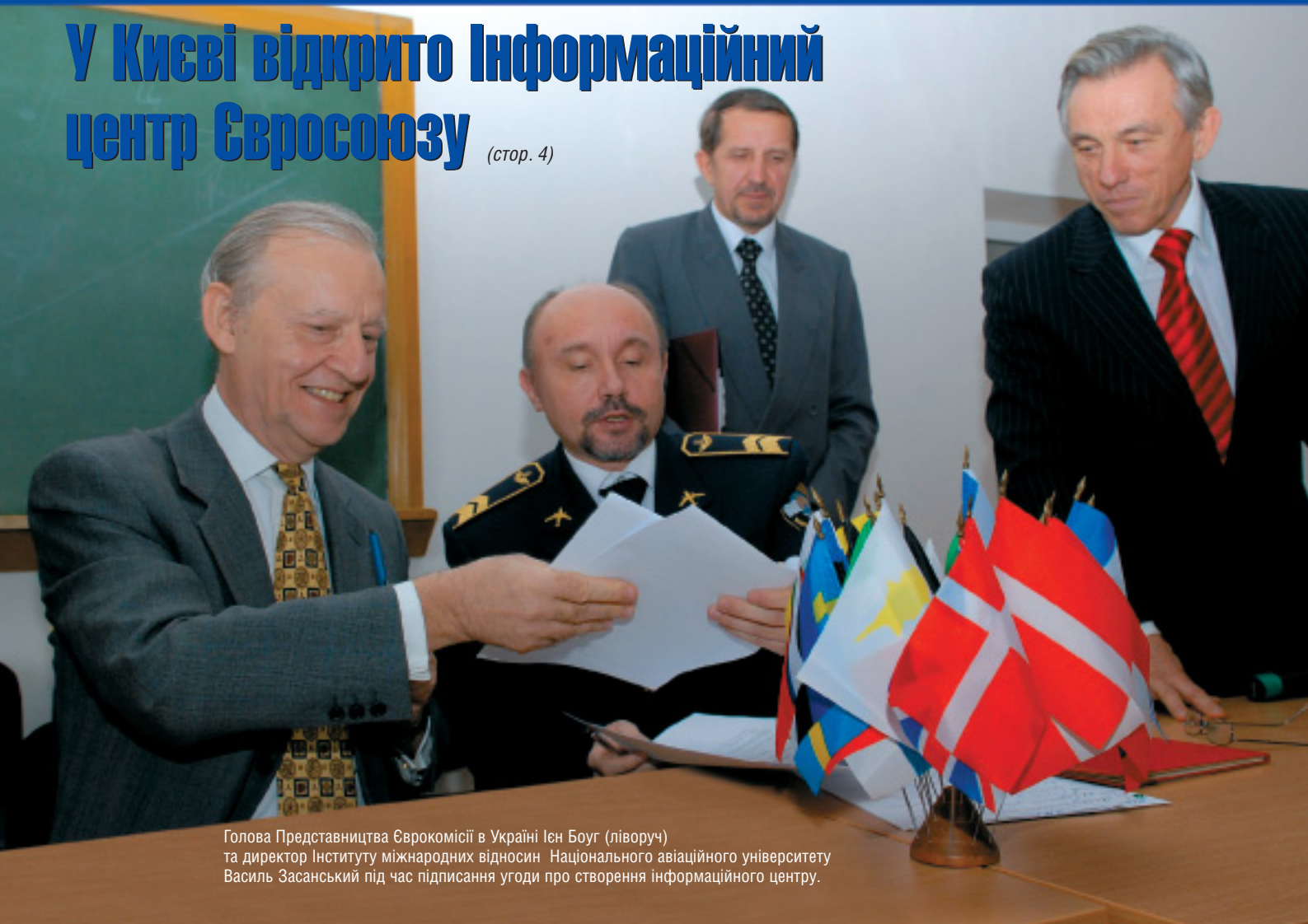
Голова Представництва Єврокомісії в Україні Іен Боуг (ліворуч) та директор Інституту міжнародних відносин Національного авіаційного університету Василь Засанський під час підписання угоди про створення інформаційного центру.