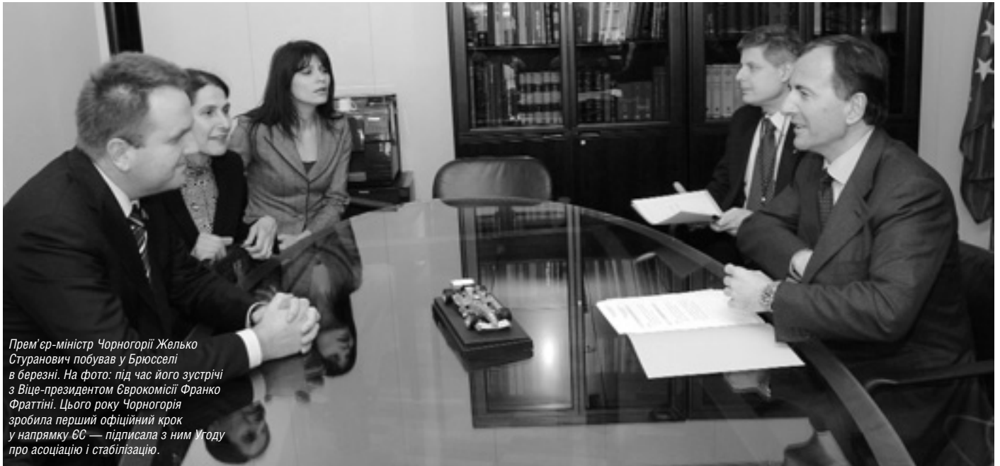
Прем'єр-міністр Чорногорії Желько Стуранович побував у Брюсселі в березні. На фото: під час його зустрічі з Віце-президентом Єврокомісії Франко Фраттіні. Цього року Чорногорія зробила перший офіційний крок у напрямку ЄС — підписала з ним Угоду про асоціацію і стабілізацію.

Брюссель оцінює поступ нинішніх та потенційних країн-кандидатів