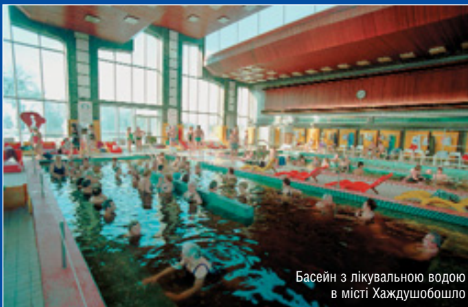
Басейн з лікувальною водою в місті Хаждушобошло