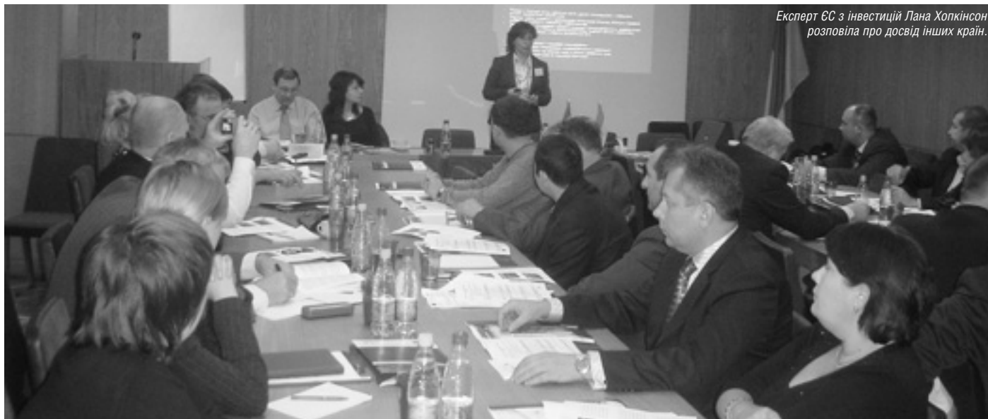
Експерт ЄС з інвестицій Лана Хопкінсон розповіла про досвід інших країн.

Два національні семінари із залучення інвестицій було проведено в Києві в рамках проекту «Послуги з підтримки малих та середніх підприємств у пріоритетних регіонах». Метою було привернути увагу державних службовців та бізнесменів з усіх областей України до важливості залучення іноземних капіталів, а також розповісти, що потрібно для створення середовища, стимулюючого іноземних інвесторів.