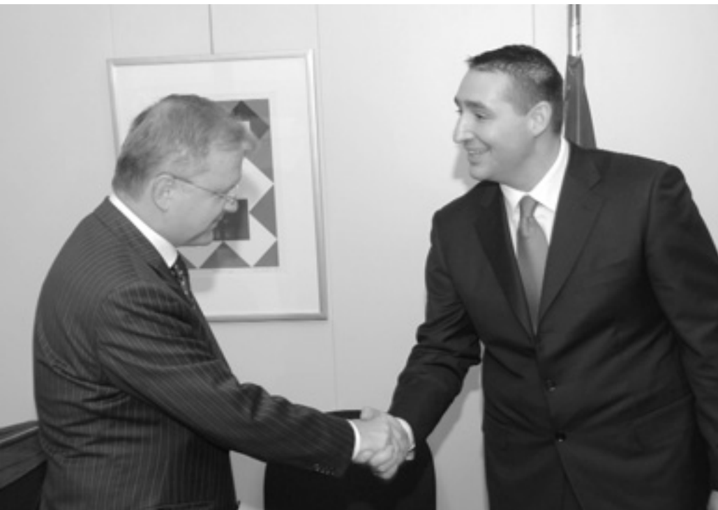
Президент Національної Асамблеї Сербії Олівер Дуліч відвідав інституції ЄС на початку листопада. Серед іншого мав зустріч з Комісаром ЄС з питань розширення Оллі Реном. 2007-го було практично завершено роботу над текстом Угоди про асоціацію і стабілізацію між ЄС та Сербією.