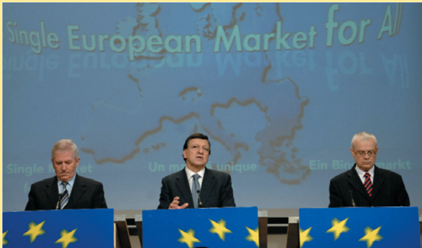
Президент Європейської Комісії Жозе Мануель Баррозу (в центрі), Комісар ЄС з питань внутрішнього ринку Чарлі МакКриві (ліворуч) та Комісар ЄС з питань зайнятості, соціальних справ та рівних можливостей Владімір Спідла на прес-конференції, присвяченій функціонуванню спільного ринку ЄС (стор. 20).

У листопаді Рада ЄС з питань юстиції та внутрішніх справ схвалила розширення Шенгенського візового простору (стор. 17). На фото — Віце-президент Єврокомісії Франко Фраттіні (в центрі) перед засіданням Ради.