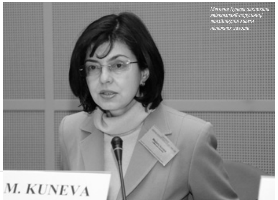
Меґлена Кунєва закликала авіакомпанії-порушниця якнайшвидше вжити належних заходів.

Компаніям дали час до кінця року, аби привести свою рекламну інформацію у відповідність до норм європейського права, що регулюють захист прав споживачів. □