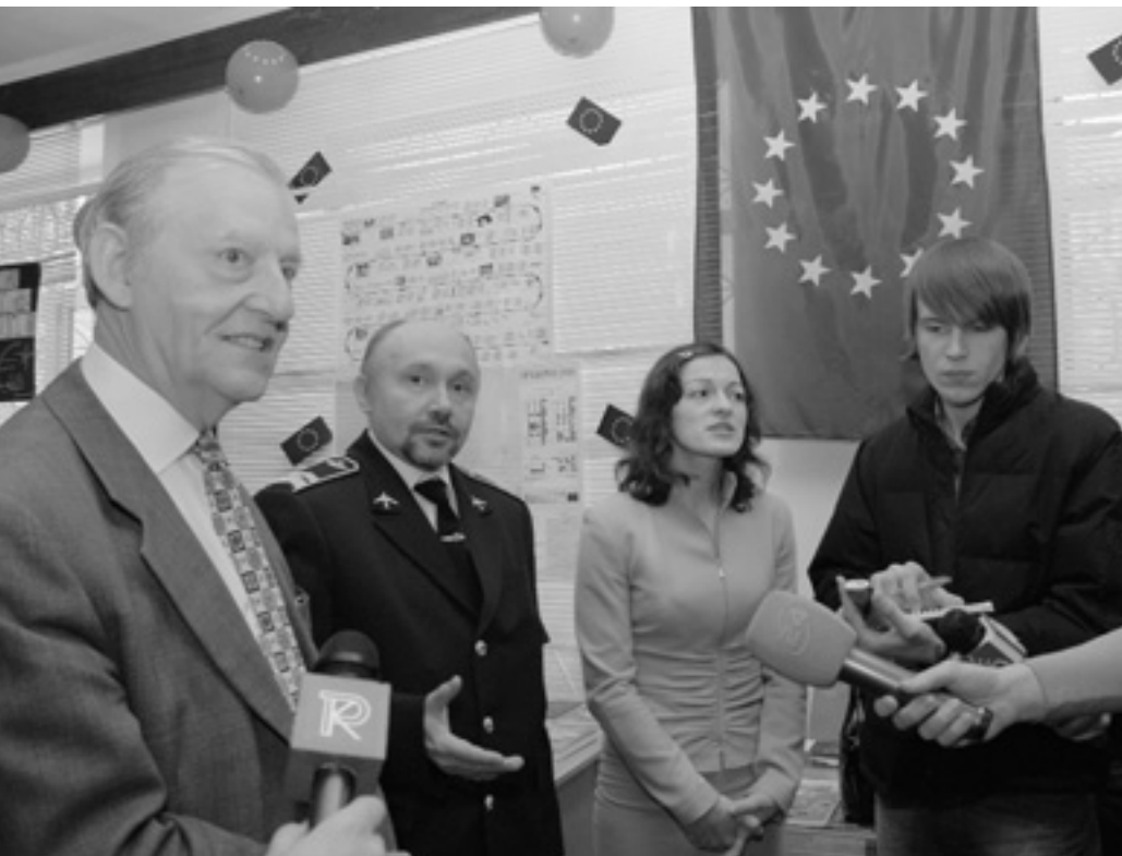
Відкриття Інформаційного центру ЄС викликало великий інтерес у преси.