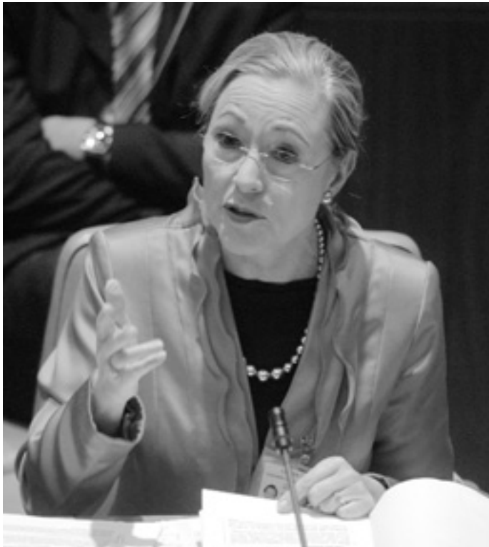
Беніта Ферреро-Вальднер запевнила міністрів країн — учасниць Барселонського процесу, що вони можуть розраховувати на її відданість «цій унікальній подорожі».