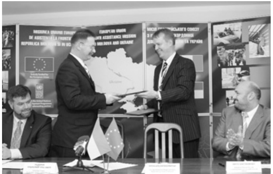
Символічне підписання акта передачі обладнання відбулося під час прес-конференції.

15 листопада Державна митна служба України отримала 45 персональних комп'ютерів, 5 ноутбуків, 112 принтерів, 7 серверів і 6 багатофункціональних пристроїв. Все це покликане поліпшити роботу Департаменту аналізу ризиків і аудиту.