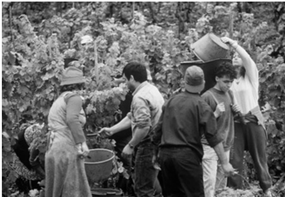
Фінансування реструктуризації і конверсії виноградників країн-членів у 2007/2008 маркетинговому році

У 2007–2008 маркетинговому році Європейський Союз виділить 510 мільйонів євро на реструктуризацію і конверсію виноградників у країнах-членах. Метою такої допомоги є пристосування виробництва вина до вимог ринку.