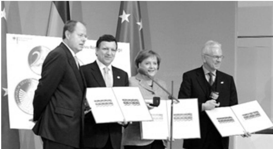
Під час святкування 50-ї річниці Римської угоди (зліва направо) — міністр фінансів Німеччини Пєр Штейнбрюк, Президент Єврокомісії Жозе Мануель Баррозу, канцлер ФРН Ангела Меркель і Президент Європарламенту Ганс-Герт Поттерінг.

Європейський Союз готується до чергової Європейської Ради — саміту ЄС. Вона має пройти 13-14 грудня в Брюсселі. Але до цього, у Лісабоні, відбудеться підписання Угоди реформ. Це означатиме новий виток європейської інтеграції, відтак майбутня лісабонська подія цілком може претендувати на звання історичної.