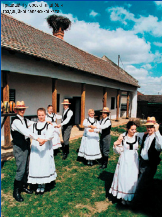
Традиційні угорські танці біля традиційної селянської хати