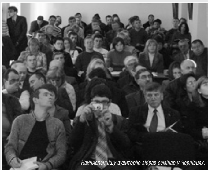
Найчисленнішу аудиторію зібрав семінар у Чернівцях.

В Ужгороді 8 листопада відбувся останній з чотирьох інформаційних семінарів для потенційних заявників у рамках фінансованої Євросоюзом Програми сусідства «Румунія — Україна». До цього семінари пройшли в Одесі, Чернівцях та Івано-Франківську.