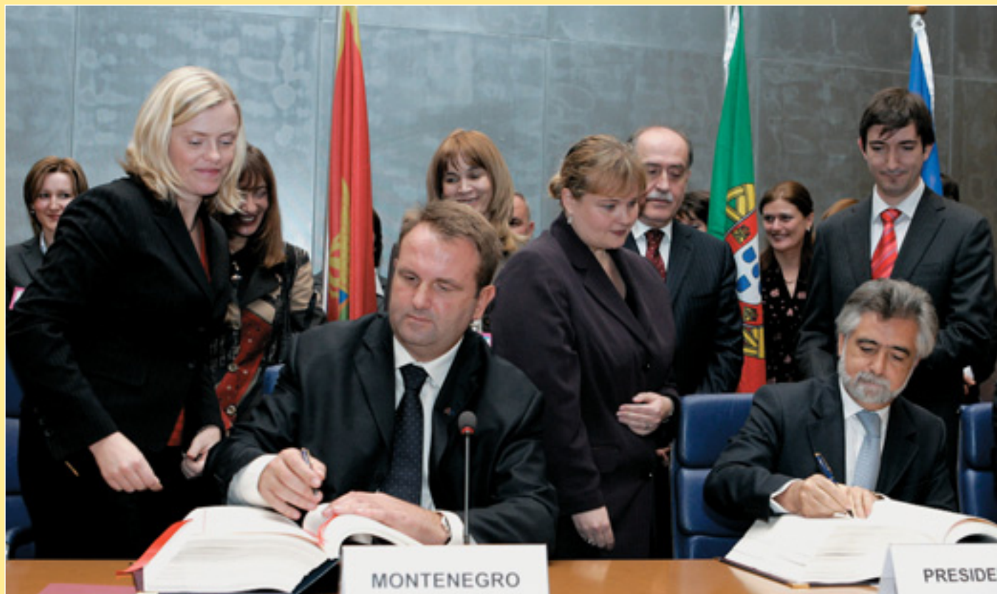
ЄС і Чорногорія підписали Угоду про асоціацію і стабілізацію. На фото: свої підписи під документом ставлять Міністр закордонних справ Чорногорії Желько Стуранович та Міністр закордонних справ головуючої в ЄС Португалії Луїш Амадо (стор. 14).