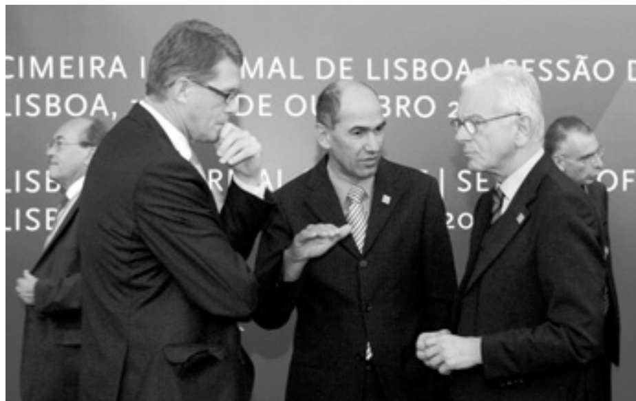
Прем'єр-міністр Фінляндії Матті Ванханен (ліворуч), Прем'єр-міністр Словенії Янеж Янса і Президент Європарламенту Ганс Поттерінг (праворуч) обмінюються думками про результати неформального саміту ЄС.

Її підпишуть 13 грудня і назвуть «Лісабонською»