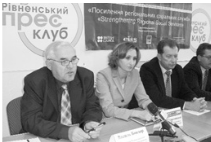
Під час конференції у Рівному.

У Рівному відбулася звітна конференція проекту TACIS «Посилення регіональних соціальних служб». Його виконував очолюваний Британською Радою Консорціум, а фінансував Європейський Союз.