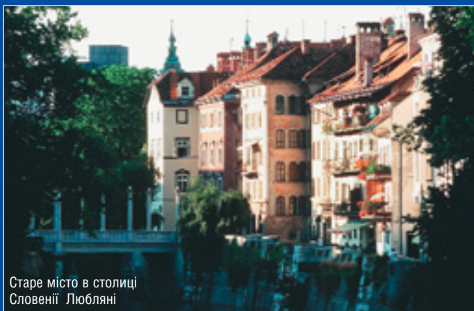
Старе місто в столиці Словенії Любляні