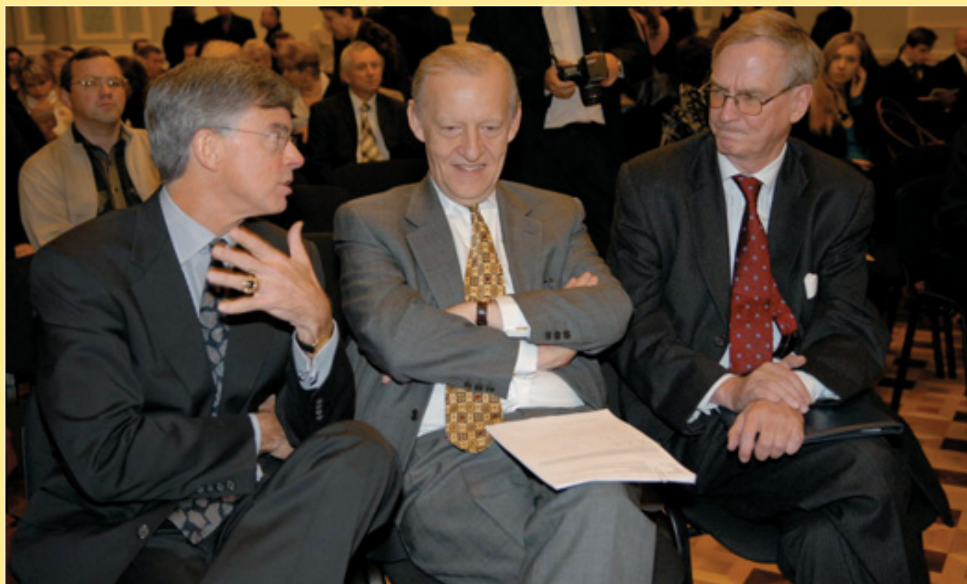
У Києві відзначили тих, хто бореться з торгівлею людьми. На фото: посол США в Україні Вільям Тейлор (зліва), Голова Представництва Єврокомісії Ієн Боуг та посол Швеції в Україні Джон-Крістер Оландер (праворуч) під час нагородження (стор. 8).