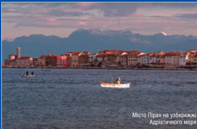
Місто Піран на узбережжі Адріатичного моря