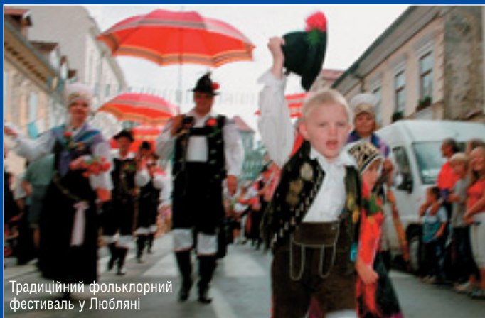
Традиційний фольклорний фестиваль у Любляні