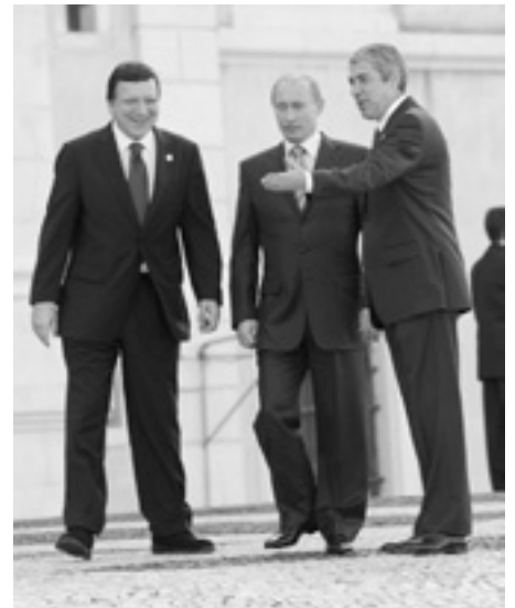
Президент Єврокомісії Жозе Мануель Баррозу (ліворуч), Президент Росії Володимир Путін та Прем'єр-міністр головної в ЄС Португалії Жозе Сократеш під час саміту в Марфі.

енергетичну ініціативу, спрямовану на лібералізацію енергетичного ринку. Одним із елементів її є вимога до іноземних компаній, що хочуть оперувати в ЄС, бути розділеними на виробників і транспортерів енергії. А це зачіпає інтереси російського монополіста «Газпром».