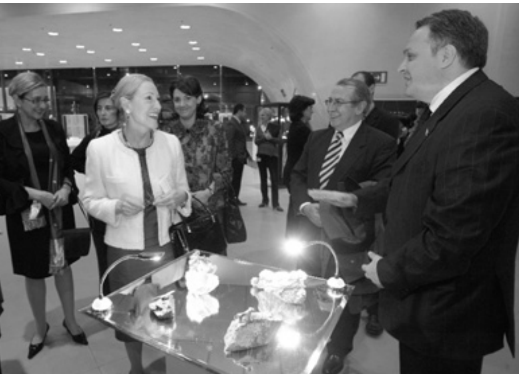
У жовтні Брюссель відвідав Міністр Грузії у справах європейської та євроатлантичної інтеграції Георгій Барамідзе. Разом з Комісаром ЄС із зовнішніх зносин та Європейської політики сусідства Бенітою Ферреро-Вальднер він відкрив виставку «Прикраси й історія: давня Грузія — перехрестя Європи й Азії».