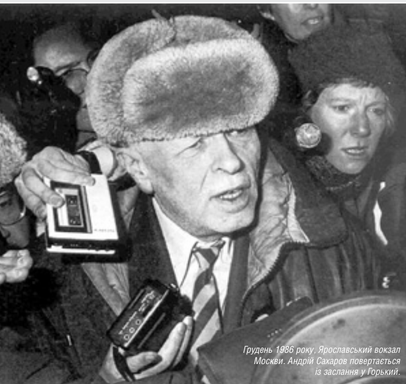
Грудень 1986 року, Ярославський вокзал Москви. Андрій Сахаров повертається із заслання у Горький.

Україна скасувала смертну кару в лютому 2000 року, коли Верховна Рада ратифікувала Протокол № 6 Європейської конвенції з прав людини. А в травні 2002 року Україна приєдналася до Протоколу № 13 тієї ж конвенції, який забороняє застосування смертної кари за будь-яких обставин. Скасування вищої міри покарання є умовою членства в Раді Європи, до якої Україна вступила у листопаді 1995-го. □