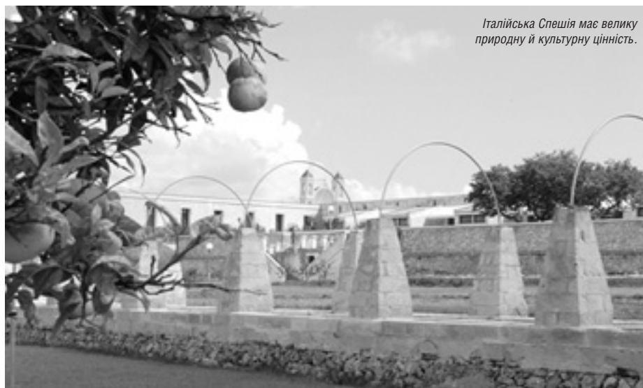
Італійська Спешія має велику природну й культурну цінність.

Свети Мартін на Мурі у Хорватії — розташований на півночі країни, поблизу кордону зі Словенією й Угорщиною природний заповідник. Тут ріка Мура втікає на територію Хорватії. Ця місцевість є і сільською, і одним з найбільших та найма-