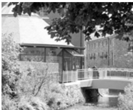
В Клонакіті (Ірландія) можна гарно провести час на землі й на воді.

Трудос на Кіпрі — п'ять районів, розташованих навколо гори Олімпія. Там багато що можна подивитися й робити — гуляти або їздити велосипедом лісовими стежками, розважатися на фестивалях у