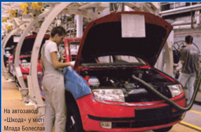
На автозаводі «Шкода» у місті Млада Болеслав