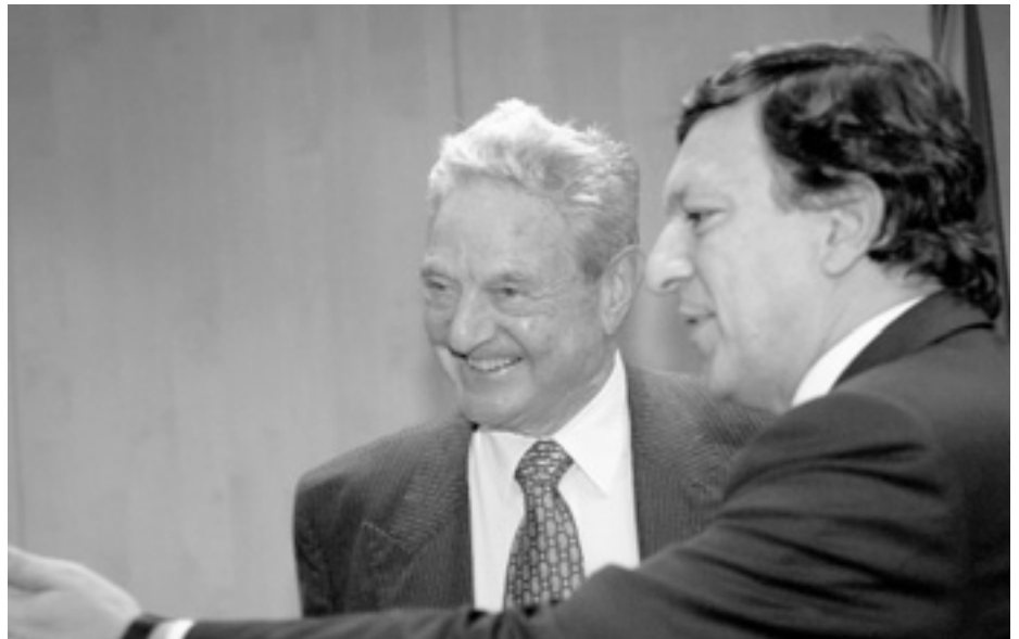
Брюссель відвідав відомий фінансист і філантроп Джордж Сорос. Серед інших він зустрівся з Президентом Європейської Комісії Жозе Мануелем Баррозу.

Максимальний бюджет дослідження — 150 000 євро. Єврокомісія планує до кінця 2007 року укласти з переможцем тендеру угоду, який протягом 10 місяців після цього має завершити роботу. □