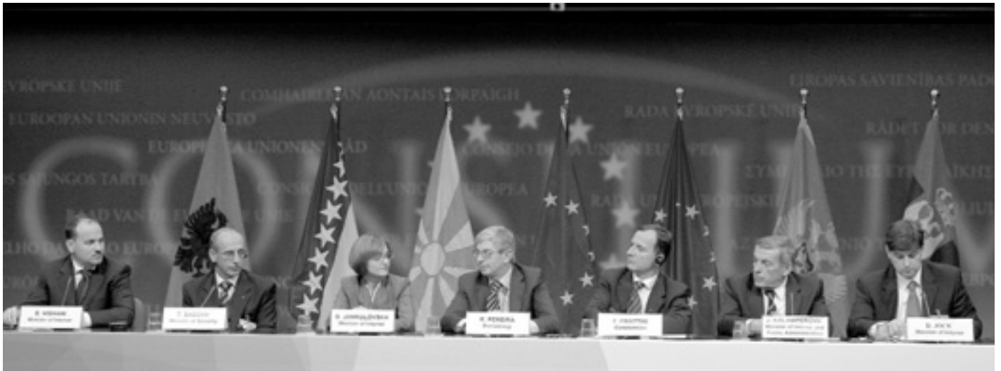
Від західнобалканських країн підписи під угодами поставили міністри внутрішніх справ.