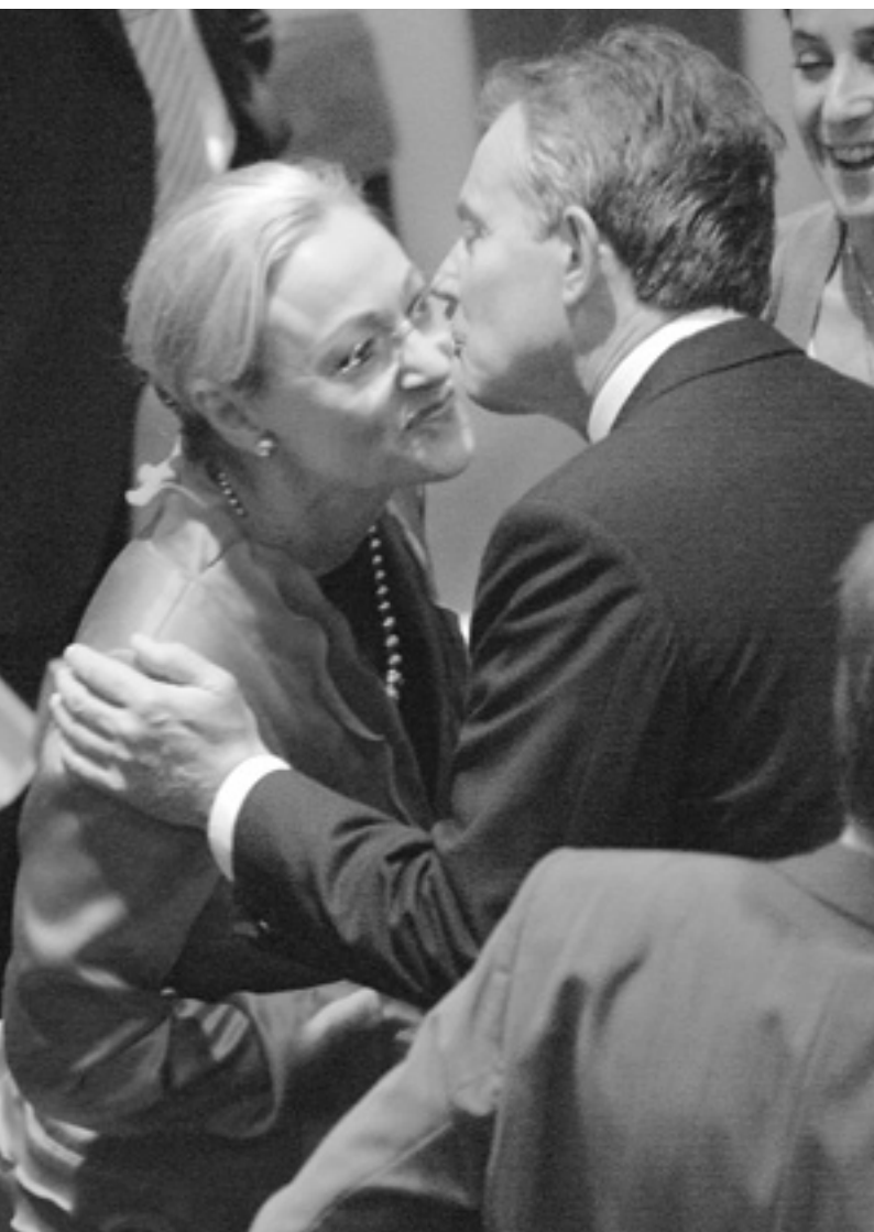
Колишній прем'єр-міністр Великої Британії Тоні Блер і Комісар ЄС з питань зовнішньої політики і Європейської політики сусідства Беніта Ферреро-Вальднер зустрілися у вересні у Нью-Йорку. Пані комісар перебувала в США з офіційним візитом, одним із пунктів якого була участь в Тимчасовому комітеті з допомоги Палестині. А Тоні Блер є офіційним представником Квартету з питань Близького Сходу.