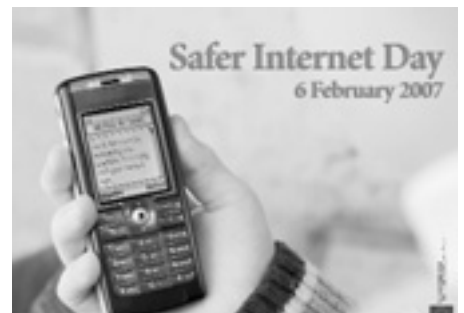
Проведення у лютому Дня безпечного інтернету стало для ЄС вже традиційним.

В основному діти свідомі ризиків, які можуть при цьому виникати. 9-річний хлопчик з Румунії сказав: «Мої батьки ска-