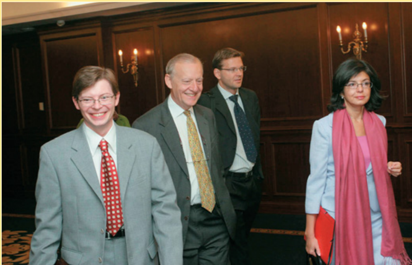
Україну відвідала Комісар ЄС у справах споживачів Меглена Кунєва (стор. 9)