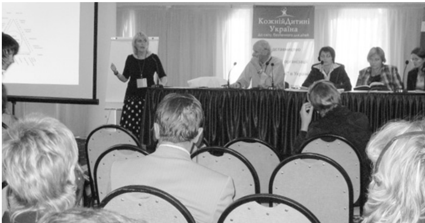
Під час заключної конференції учасники проекту поділилися отриманим досвідом з колегами з інших країн.

Про це свідчать результати проекту Євросоюзу