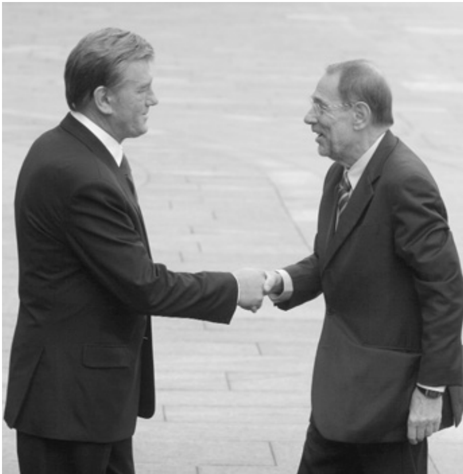
Високий представник ЄС з питань спільної зовнішньої та безпекової політики Хав'єр Солана — частий гість України.

довського кордону відповідно до Спільної заяви від 30 грудня 2005 року. Сторони відзначили ефективну роботу Місії ЄС з питань допомоги на українсько-молдовському кордоні як приклад взаємовигідного та успішного співробітництва між Україною та ЄС і відзначили продовження її мандату на наступний дворічний період. Лідери ЄС підтримали Україну в забезпеченні належного виконання Протоколів від 21 листопада 2006 року про обмін митною та прикордонною інформацією між Україною та Молдовою.