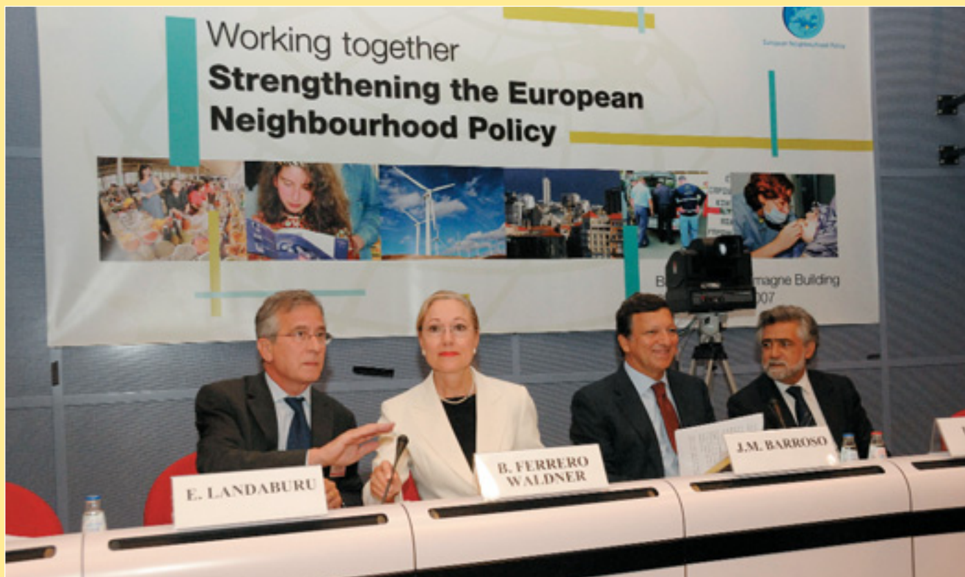
Відбулася міжнародна конференція «Працюючи разом — посилення Європейської політики сусідства» (стор. 14—15)