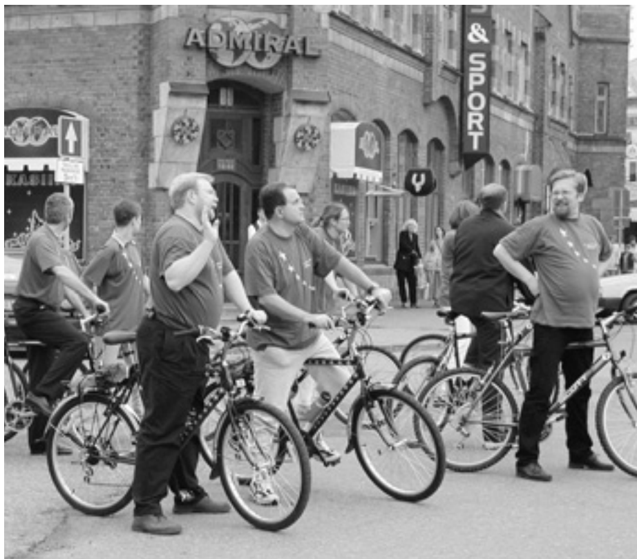
Червень 2001 року — Президент Європейської Комісії Романо Проді (в центрі) і Прем'єр-міністр Естонії Март Лаар під час велосипедної прогулянки естонським містечком Пярну.

З 16 по 22 вересня в Європейському Союзі проходив черговий, шостий щорічний Тиждень мобільності. Цьогорічна тема — «Вулиці для людей». Участь у тижні взяли понад 133 мільйони людей і понад 1300 міст з ЄС та інших країн — Китаю, Бразилії, Канади, Еквадору й Таїланду.