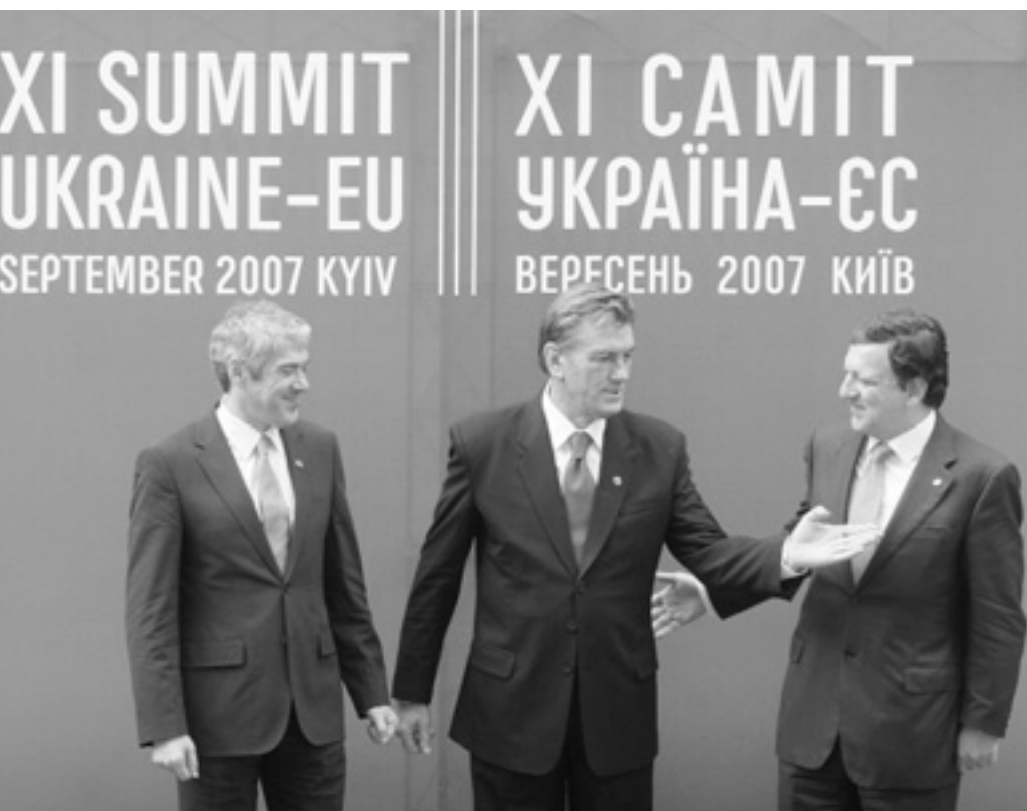
Прем'єр-міністр Португалії Жозе Сократеш, Президент України Віктор Ющенко та Президент Єврокомісії Жозе Мануель Баррозу під час спільної прес-конференції.

На саміті ЄС—Україна говорили про посилену угоду, візи та зону вільної торгівлі