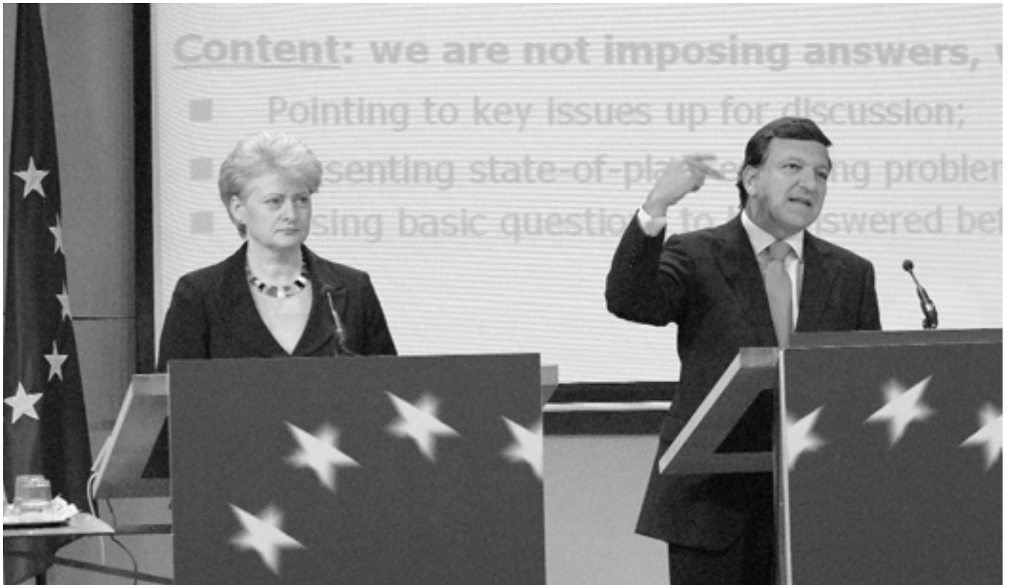
У вересні Президент Єврокомісії Жозе Мануель Баррозу і Комісар ЄС з питань бюджету Далія Грибаускайте дали прес-конференцію, присвячену початку консультацій щодо бюджетної реформи.

Наступного року ЄС планує витратити близько 130 мільярдів євро