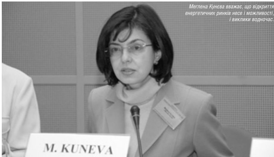
Меглена Кунева вважає, що відкриття енергетичних ринків несе і можливості, і виклики водночас.

З 1 липня 2007 року лібералізовано енергетичні ринки у більшості держав — членів Євросоюзу. Це означає, що споживачі можуть обирати самі постачальника електроенергії та газу. Відповідно, в цій сфері посилюється конкуренція для споживача, яка, як відомо, завжди дає йому переваги.