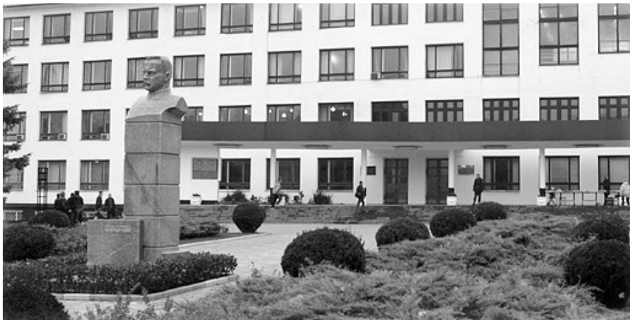
Таврійський національний університет — один із партнерів проекту «Жорна».

Проект «ЖОРНА» відзвітував про свою поточну діяльність у п'яти університетах України, де працюють школи журналістики. Аббревіатура назви проекту розшифровується як «Журналістська Освіта: Розвиток Навичок». Команда проекту організує семінари і майстерні для викладачів українських шкіл журналістики. На них розповідають, як розробляти й впроваджувати навчальні модулі за вимогами Болонської угоди.