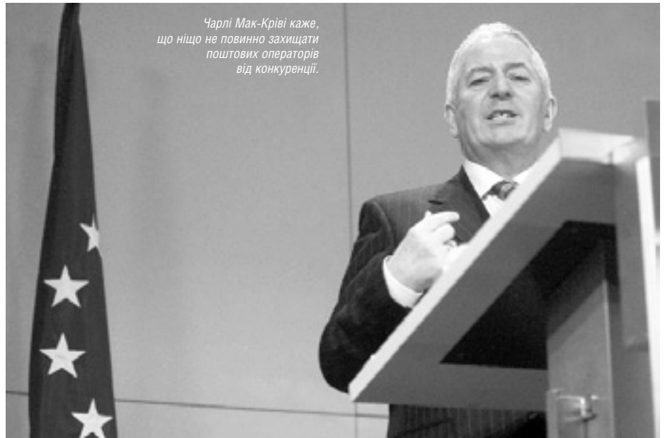
Чарлі Мак-Криві каже, що ніщо не повинно захищати поштових операторів від конкуренції.

Поштову реформу задумали в Євросоюзі ще десять років тому. 2002-го поштові послуги були лібералізовані частково. Уряди країн ЄС погодилися на поступове, протягом кількох років створення умов для допуску на ринок конкурентів, але державні оператори продовжували залишатися монополістами на ринку листів — поштових відправлень вагою менше 50 грамів. Це компенсувало їм так звані «універсальні зобов'язання