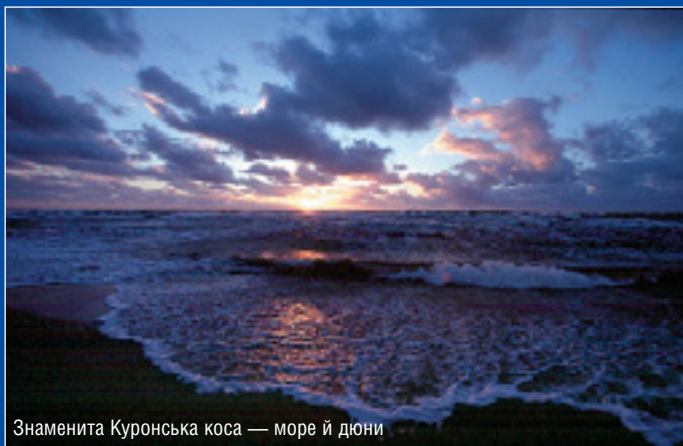
Знаменита Куронська коса — море й дюни

Литва — переважно рівнинна країна. Клімат перехідний від морського до континентального. Поля й луки займають 57% території країни, ліси — 30%, болота — 3%. Найбільшими ріками є Нямунас та Неріс. У Литві понад 3 тисячі озер, найбільше з них — Друкшай на кордоні Латвії, Литви й Білорусі.