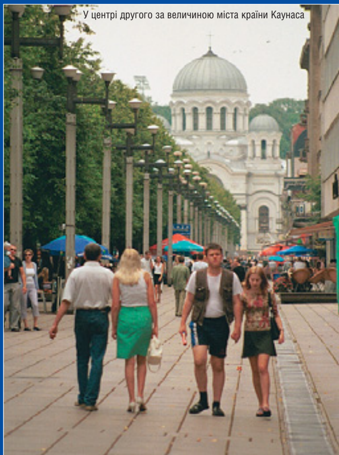
У центрі другого за величиною міста країни Каунаса