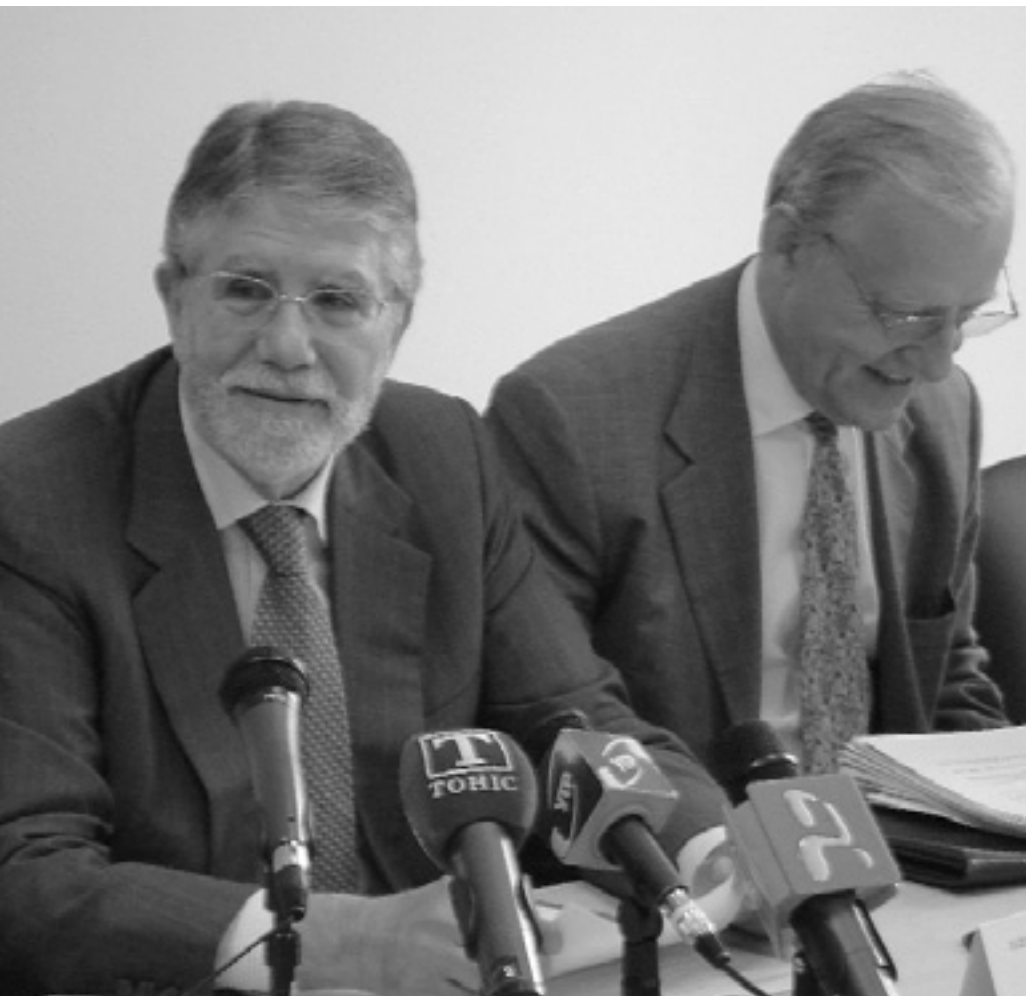
Посол Португалії в Україні Жозе Мануель Пессанья Вієгаш та Голова Представництва Європейської Комісії в Україні Ієн Боуг.

— Якими є пріоритети португальського головування в Євросоюзі?