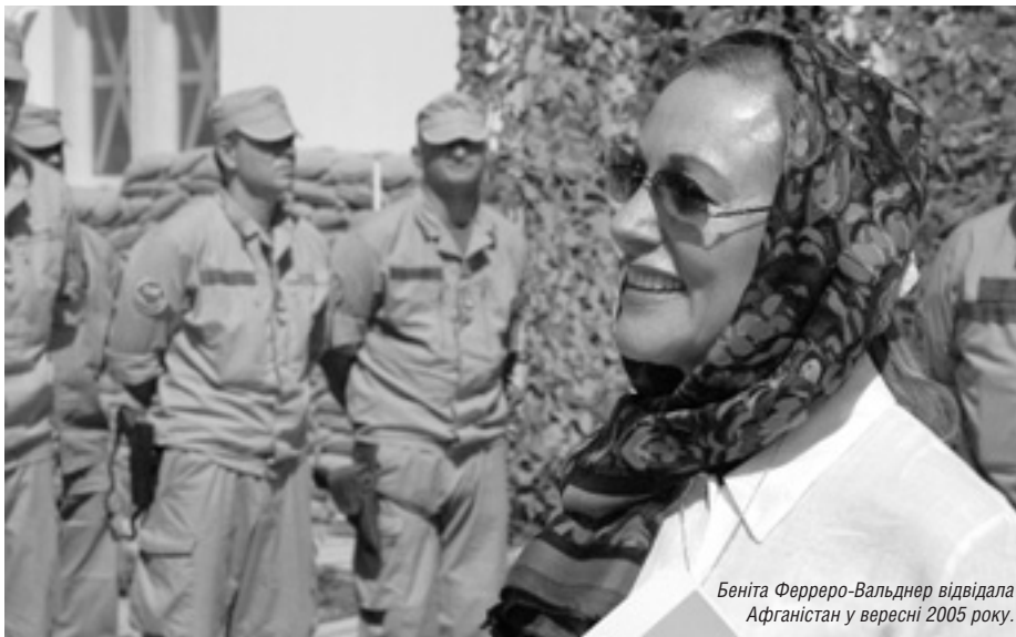
Беніта Ферреро-Вальднер відвідала Афганістан у вересні 2005 року.

— Проблеми Афганістану не можуть бути вирішені без міцнішого врядування і поваги до прав людини, — заявила Комісар ЄС. — Всі наші досюгочасні зусилля будуть