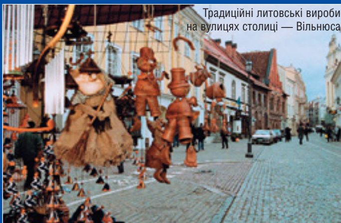
Традиційні литовські вироби на вулицях столиці — Вільнюса