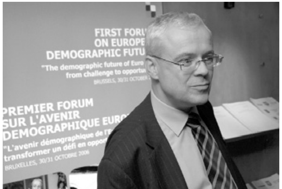
Владімір Спідла вважає нинішню ситуацію абсурдною.

Зарплата жінок у Євросоюзі на 15% менша ніж зарплата чоловіків. Виправити цю ситуацію має намір Європейська Комісія.