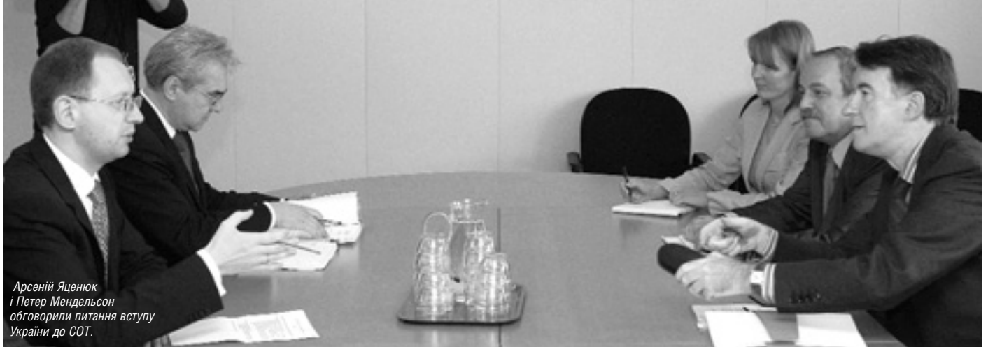
Арсеній Яценюк і Петер Мендельсон обговорили питання вступу України до СОТ.

На цьому наголосила Беніта Ферреро-Вальднер