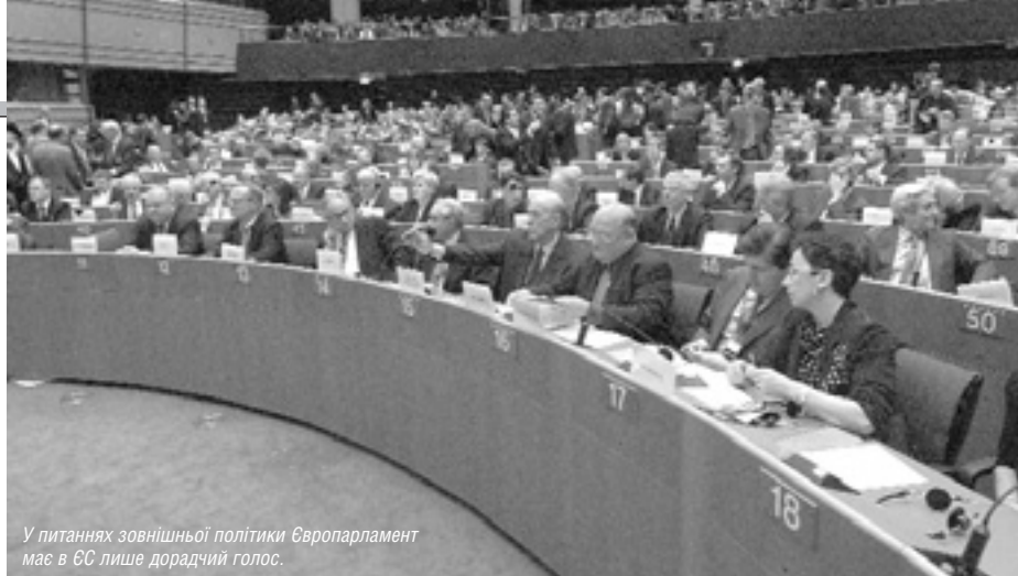
У питаннях зовнішньої політики Європарламент має в ЄС лише дорадчий голос.

— Ми маємо допомогти Україні вилікуватися від радянського минулого, —