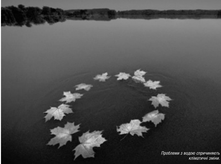
Проблеми з водою спричиняють кліматичні зміни.