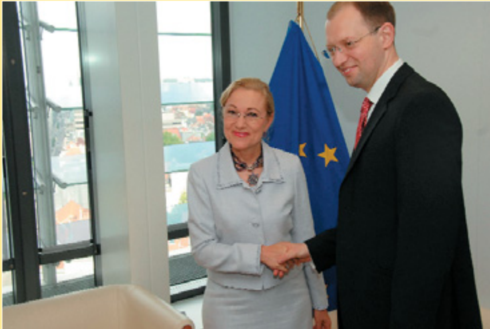
Міністр закордонних справ Арсеній Яценюк побував у липні в Брюсселі з робочим візитом. На знімку — перед зустріччю з Комісаром ЄС з питань зовнішніх зносин і Європейської політики сусідства Бенітою Ферреро-Вальднер (стор. 5).