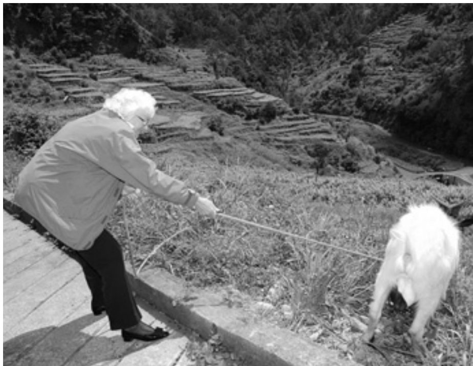
Комісар ЄС з питань сільського господарства Маріанн Фішер Боел під час її візиту на португальський острів Мадейра у травні цього року.

Нині в ЄС працює близько 2,4 мільйона виноробних підприємств. Винні плантації у Союзі займають 3,6 мільйона гектарів, тобто 2% усіх сільськогосподарських площ. 2006 року на виноробну галузь припадало 5% усього сільськогосподарського виробництва Союзу. □