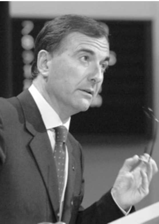
Франко Фраттіні повідомив, що Єврокомісія підготувала пропозиції щодо змін до Спільної консульської інструкції.