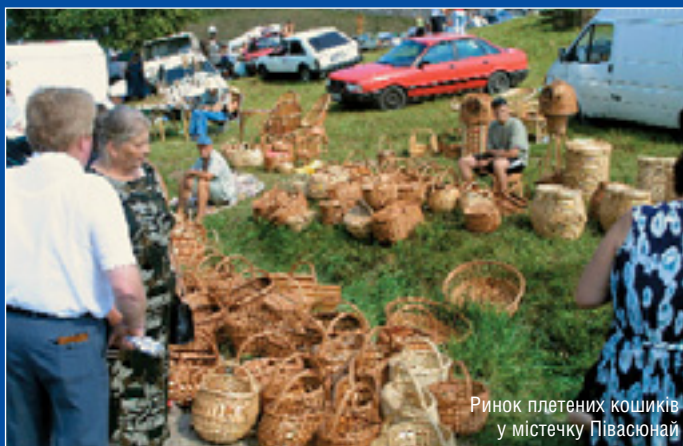
Ринок плетених кошиків у містечку Півашонай