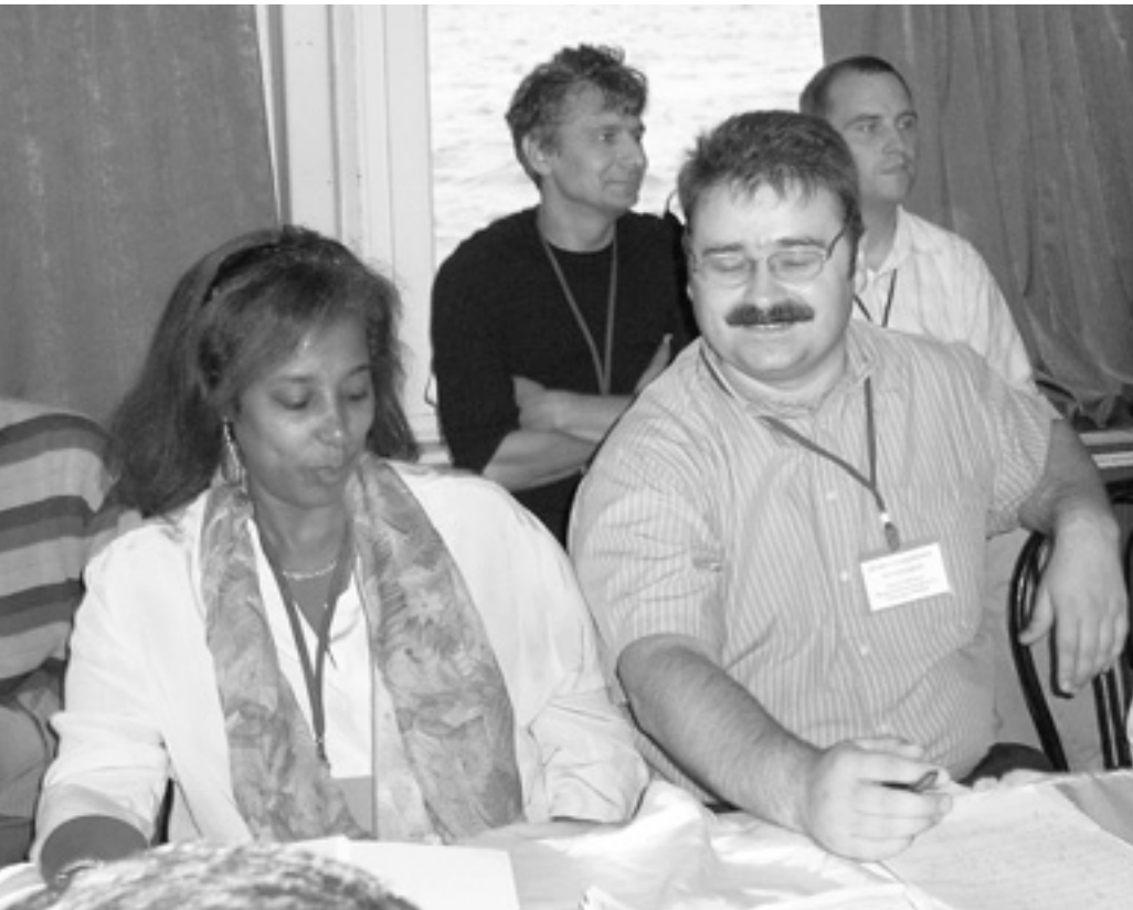
Під час виїздного навчального семінару для відповідальних за підготовку і впровадження проектів Twinning у центральних органах виконавчої влади України.

М етою липневого засідання було затвердження довготермінових пріоритетів впровадження інструменту Twinning на період 2008 — 2011 роки. Орієнтовний список пріоритетів для майбутніх проектів за сферами діяльності та завданнями такий.