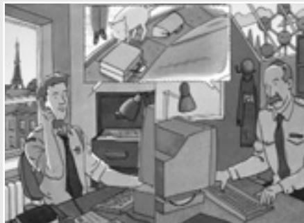
Головним завданням Європолу є боротьба з транскордонною злочинністю і тероризмом в ЄС.

Торік влітку спецслужби Німеччини й Великої Британії заарештували осіб, які,