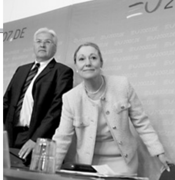
Міністр закордонних справ Німеччини Франк-Вальтер Штайнмайєр та Комісар ЄС із зовнішніх відносин та політики добросусідства Беніта Ферреро-Вальднер щойно відповіли на запитання журналістів.

На люксембурзькій зустрічі міністри ЄС, які опікуються зовнішньою політикою, також обговорили проект Центральноазійської стратегії Євросоюзу. Її метою є зміцнення відносин Союзу з Казахстаном, Киргизією, Таджикистаном, Туркме-