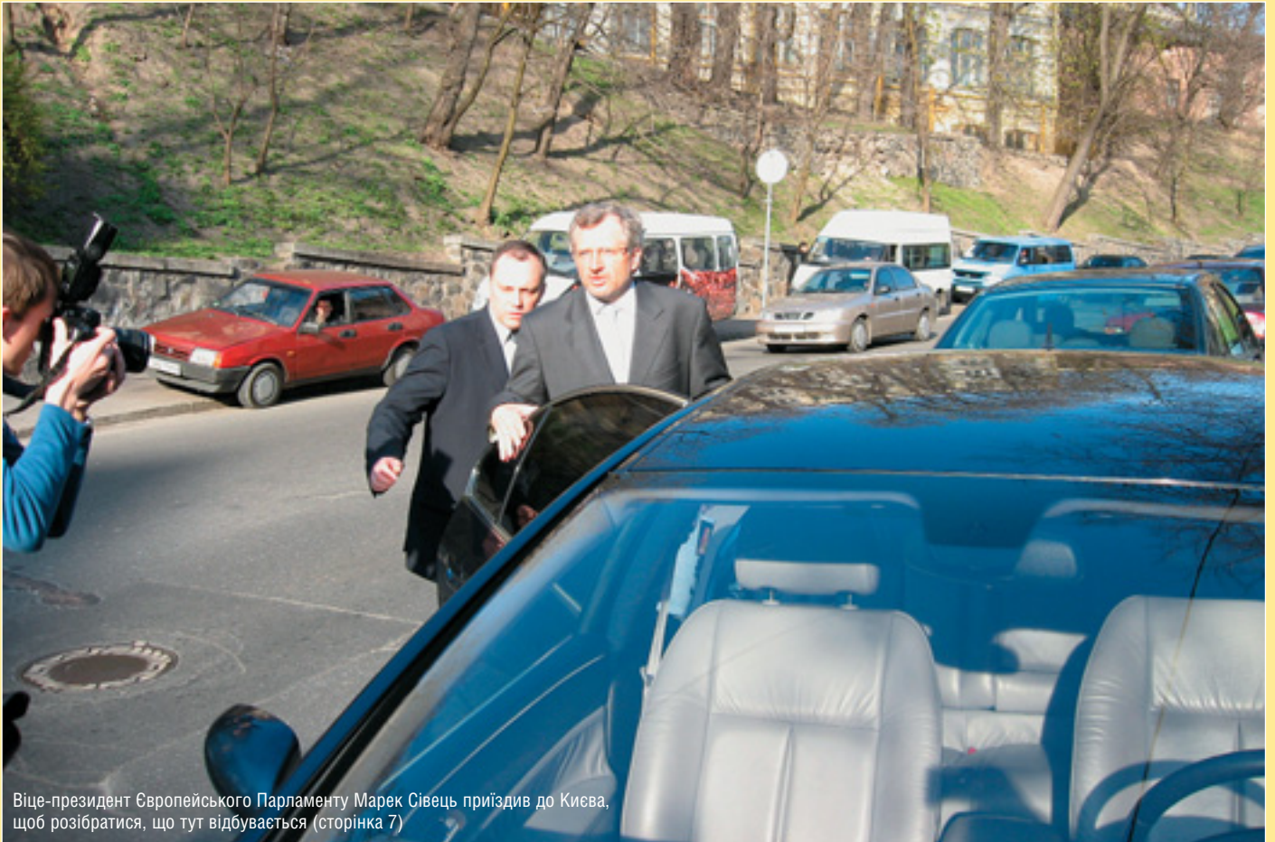
Віце-президент Європейського Парламенту Марек Сівець приїздив до Києва, щоб розібратися, що тут відбувається (сторінка 7)