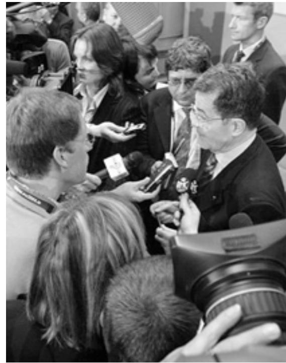
Колишній Президент Єврокомісії Романо Проді був найпопулярнішою людиною 1 травня 2004 року, коли до ЄС приєдналося відразу 10 країн.

Ось такою є процедура вступу до Євросоюзу. Її тривалість не регламентована