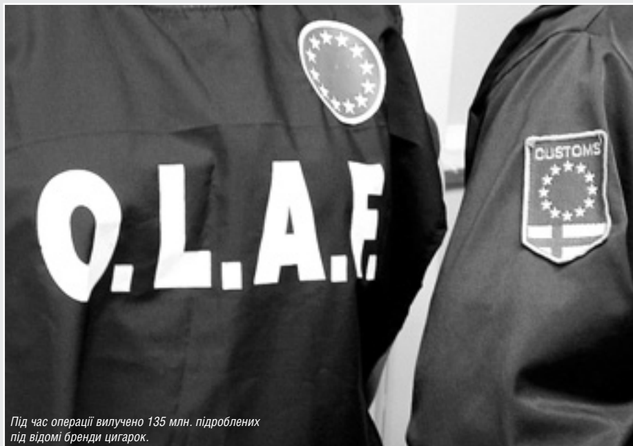
Під час операції вилучено 135 млн. підроблених під відомі бренди цигарок.

Спільну митну операцію під назвою «Діаболо» провели країни — члени ЄС, Інтерпол, Європол та Міжнародна митна організація. Очолював її, представляючи Європейську Комісію, Європейський антикорупційний офіс (OLAF). Під час операції вилучено 135 мільйонів підроблених під відомі марки цигарок, а також 557 тисяч іншої «піратської» продукції — текстилю, взуття, іграшок, меблів тощо.