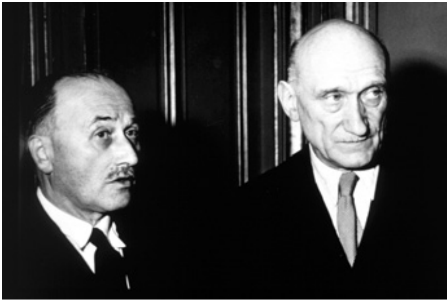
Французькі політики Жан Моне (1888 — 1979) і Робер Шуман (1886 — 1963) — серед тих, кого називають батьками європейської інтеграції.

Шуман (на фото праворуч) народився в Лотарингії. Був Міністром фінансів Франції, прем'єром та Міністром закордонних справ. 1958 року обраний президентом Європейської Асамблеї, яка пізніше стала Європейським парламентом.