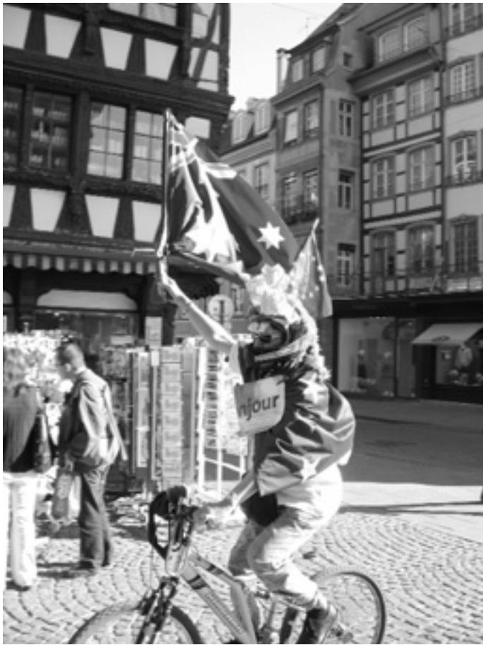
Французький Страсбург — одна зі столиць Об'єднаної Європи. Там розташовано Європейський Парламент. Інколи європейську символіку пропагують у Страсбурзі і в такий от спосіб.