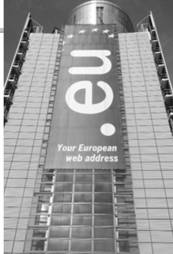
Найбільше заявок на домнене ім'я .eu надійшло з Німеччини.

2005 року Європейська Комісія ухвалила ініціативу «i2010», націлену на розвиток інформаційних технологій в ЄС. Одним з її елементів є стимулювання розвитку електронних бібліотек, оцифровування класичних творів європейської культури та електронного збереження старих та рідкісних документів. 2006 року Комісія ухвалила Рекомендацію з питань оцифрування та електронного збереження, що заохочувала держави — члени ЄС до активної діяльності у цьому напрямі. □