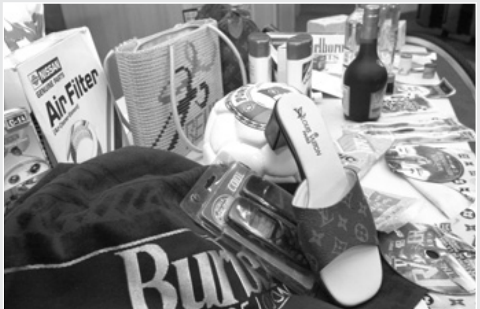
Обсяги контрафактної продукції зросли в ЄС за останнє десятиліття на 1600%, що призвело до втра- ти 125 000 робочих місць.

Тепер закон має схвалити Рада ЄС, потім — протягом 18 місяців — країни-члени ма- ють імплементувати її положення в націо- нальні закони. □