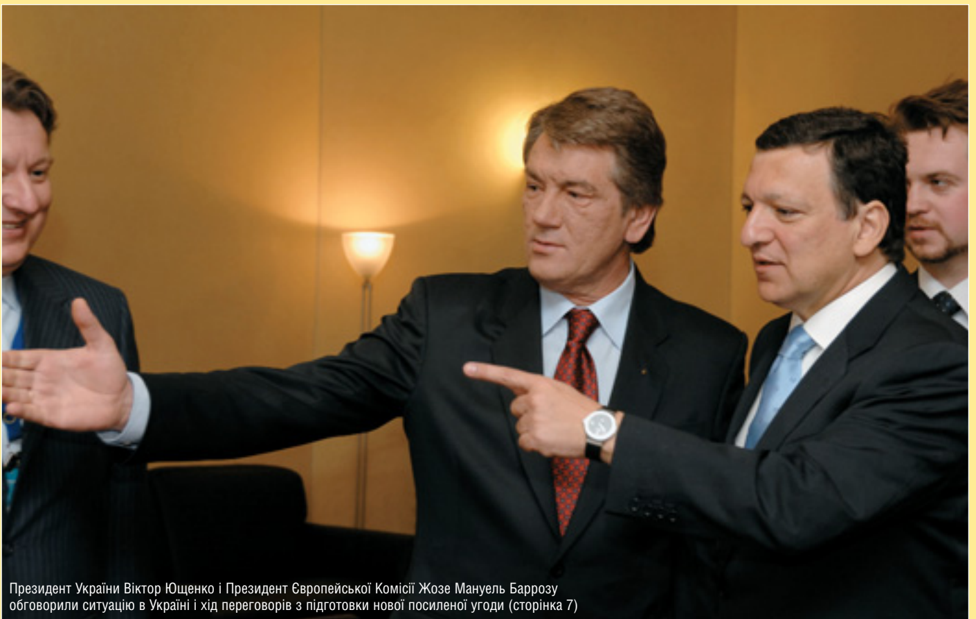
Президент України Віктор Ющенко і Президент Європейської Комісії Жозе Мануель Баррозу обговорили ситуацію в Україні і хід переговорів з підготовки нової посиленої угоди (сторінка 7)