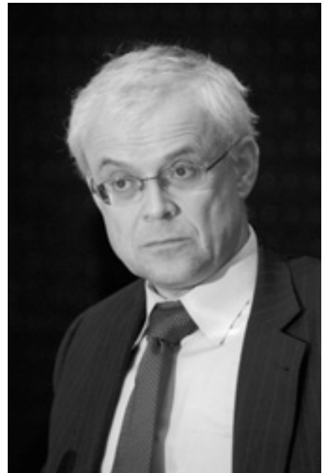
— Роль медіа у збільшенні поінформованості людей щодо цих важливих проблем неможливо перебільшити, — заявив з нагоди вручення призів Комісар ЄС з питань зайнятості, соціальних справ і рівних можливостей Володівір Спідла.

З лютого стартував новий конкурс на премію «За різноманітність. Проти дискримінації». Участь у ньому можуть взяти статті, опубліковані в будь-якій з 27 країн ЄС і надруковані з 1 січня по 30 вересня цього року. Причому вперше спеціальний приз буде присвячено Європейському року рівних можливостей для всіх. У статтях, які номінуватимуться на цей приз, має йтися про дискримінацію за расою або етнічним походженням, релігією чи вірою, віком, сексуальною орієнтацією або інвалідністю. □