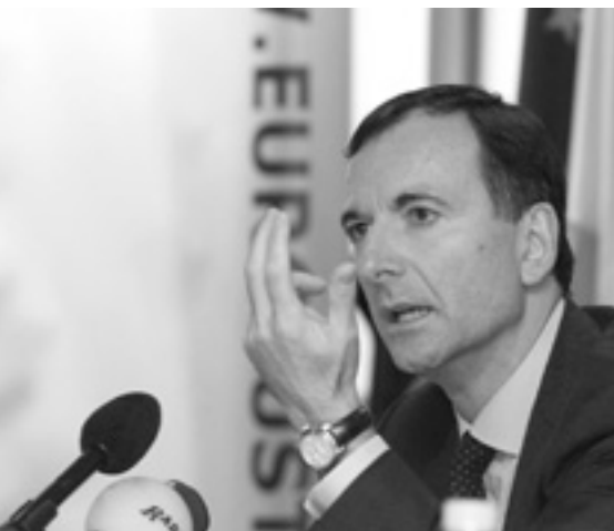
Франко Фраттіні наголосив, що захист фундаментальних прав людини є зобов'язанням Європейського Союзу.

— Європейський Союз має конкретні зобов'язання щодо підтримки та поглиблення захисту фундаментальних прав, — заявив Віце-президент Європейської Комісії Франко Фраттіні, який відповідає за питання юстиції, свободи й безпеки. — І державні структури країн-членів, і структури громадянського суспільства зможуть скористатися цією програмою.