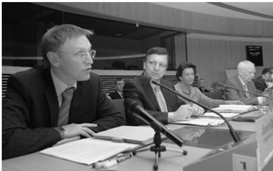
Янеж Поточнік (на передньому плані) порівнює створення єдиного дослідницького простору в ЄС з вільним пересуванням людей, товарів і капіталів.

Комісія планує революцію в дослідницькій сфері