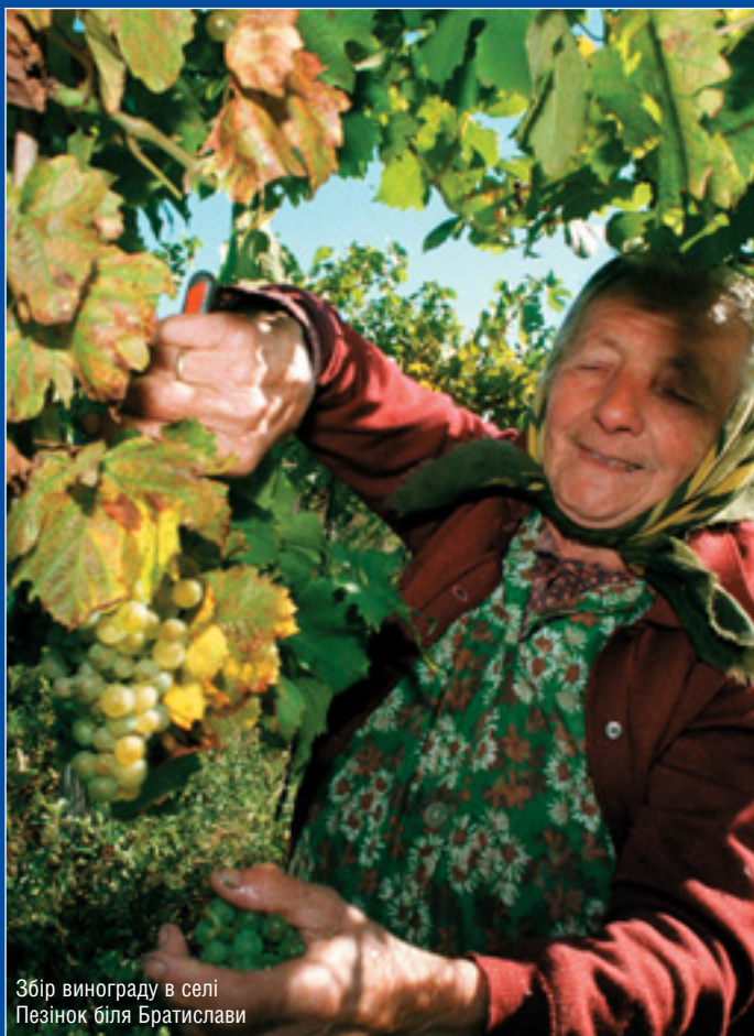
Збір винограду в селі Пезінок біля Братислави