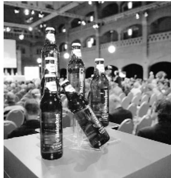
Свої зібрання учасники картелю проводили в готелях та ресторанах.

ності картелю зросли як на оптовому, так і на роздрібному ринках. Комісія також має докази, що в усіх чотирьох компаніях до змови було залучено вищий менеджмент: членів рад директорів, управляючих менеджерів тощо. Причому факти вказують на те, що компанії цілком усвідомлювали незаконність своєї діяльності. У записках про зустрічі