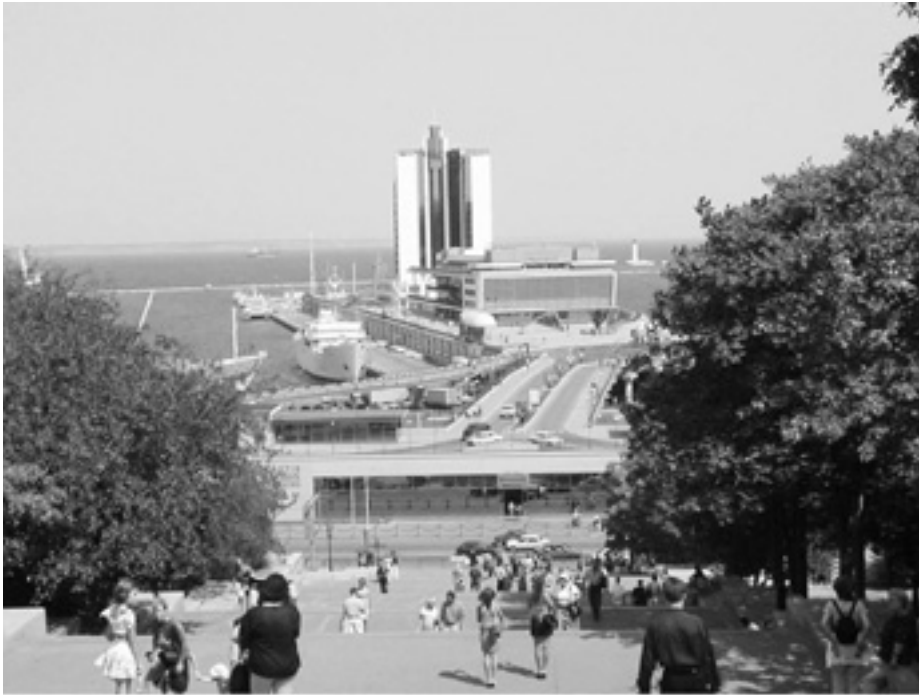
Новою ініціативою ЄС зможе скористатися і «перлина біля моря» — Одеса.

Європейський Союз зміцнює свою присутність в регіоні