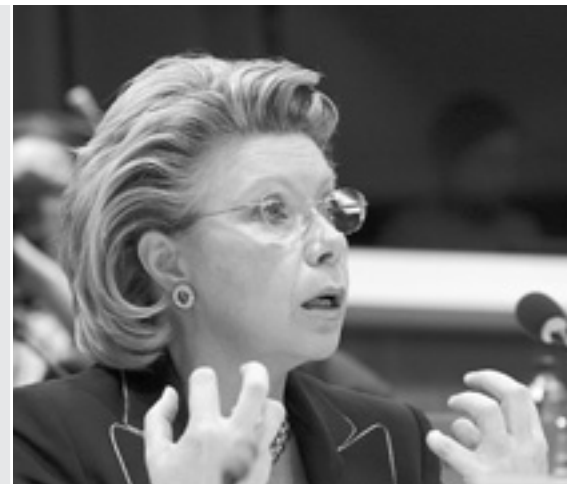
Вівіан Редінг вважає, що новими роумінговими тарифами мають користуватися і вже зареєстровані абоненти.

Саме це питання — чи існуючі абоненти атоматично переходять на нові ціни, чи мають придбати новий пакет із нижчими тарифами — залишається одним із найдис-