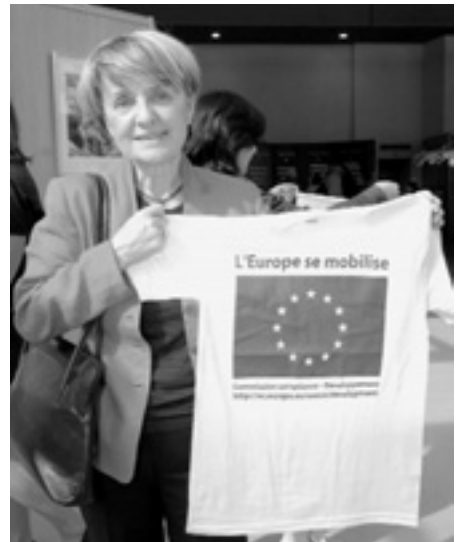
Комісар ЄС з питань регіональної політики Данута Хубнер зустрічала гостей особисто.