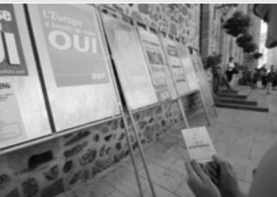
На референдумі в травні 2005 року французи не підтримали проект Конституційного договору ЄС.

Президент Європейської Комісії Жозе Мануель Баррозу закликає всі країни ЄС до весни 2009 року ратифікувати Конституційний договір.