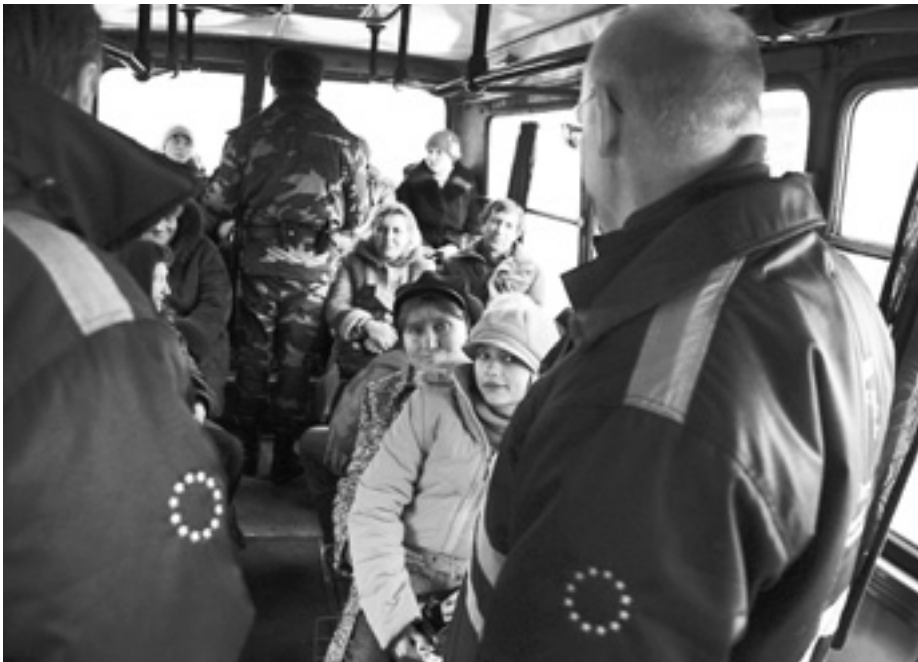
Під час перетину українсько-молдовського кордону на пункті пропуску Тимково-Слобідка.