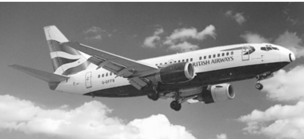
British Airways та інші великі авіаперевізники підтримали Європейську Комісію.

О днак на початку квітня Європейська Комісія висунула авіаперевізникам і країнам — членам Союзу ультиматум — дала шість місяців, протягом яких ті мають усунути численні випадки невиконання законодавства ЄС. Інакше комісія почне застосовувати каральні санкції.