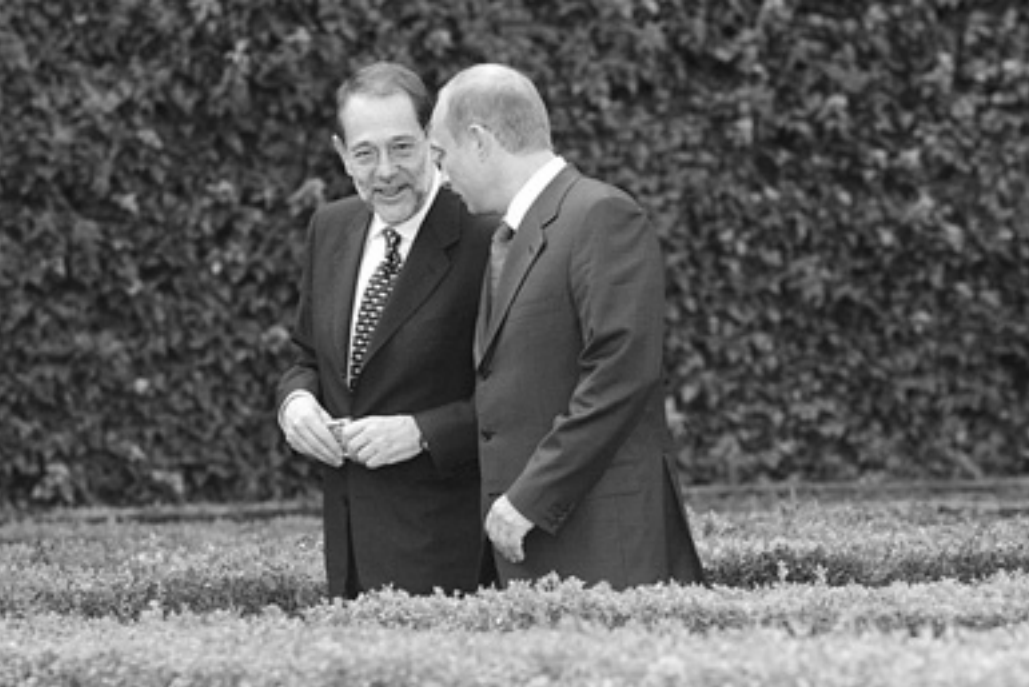
Верховний представник ЄС з питань спільної зовнішньої та безпекової політики Хав'єр Солана та Президент Росії Володимир Путін знову зустрінуться в травні на саміті ЄС—Росія.

Рада ЄС з питань юстиції та внутрішніх справ поставила формальну крапку у процесі набуття чинності угод зі спрощення візового режиму й реадмісії нелегальних мігрантів з Росією. Обидва документи набудуть чинності 1 червня 2007 року. Підписали їх 25 травня 2006-го, і відтоді угоди перебували на ратифікації в країнах — членах Євросоюзу.