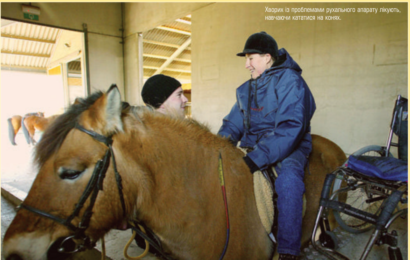
Хворих із проблемами рухального апарату лікують, навчаючи кататися на конях.