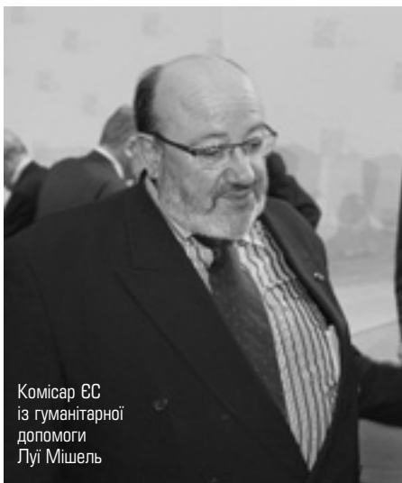
Комісар ЄС із гуманітарної допомоги Луї Мішель

Ф інансування в рамках обох проектів буде надаватися через Департамент гуманітарної допомоги ЄС (ЕЧНО), відповідальний комісар Луї Мішель. Пан Луї Мішель так прокоментував це рішення: "Під час недавньої поїздки я бачив, наскільки вразливі до природних катаклізмів Карибські острови. Ці рішення сприятимуть дієвій допомозі населенню та піднімуть умови життя до прийнятних стандартів. Відомо, що від ураганів