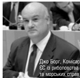
Джо Борг, Комісар ЄС із риболовства та морських справ

У промові на щорічній конференції Ради з морських досліджень (ICES), яка відбулася в м. Абердін, комісар ЄК Джо Борг наголосив на потребі розширення та урізноманітнення наукових досліджень у риболовецькій галузі.