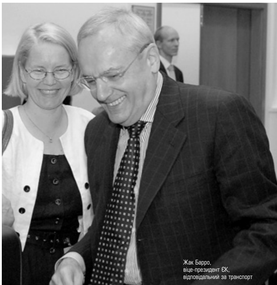
Жак Барро, віце-президент ЄК, відповідальний за транспорт

Докладно на сайті: http://europa.eu.int/rapid/pressReleasesAction