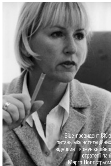
Віце-президент ЄК з питань міжінституційних відносин і комунікаційної стратегії пані Марго Воллстром

28 вересня президент Баррозу за власною ініціативою відвідав "Конференцію президентів" у Стразбурзі. Пан Баррозу, разом з віце-президентом ЄК паном Воллстромом, представили Європейському Парламенту деталі "Плану D". У тому числі було названо низку конкретних заходів, необхідних для того, щоб