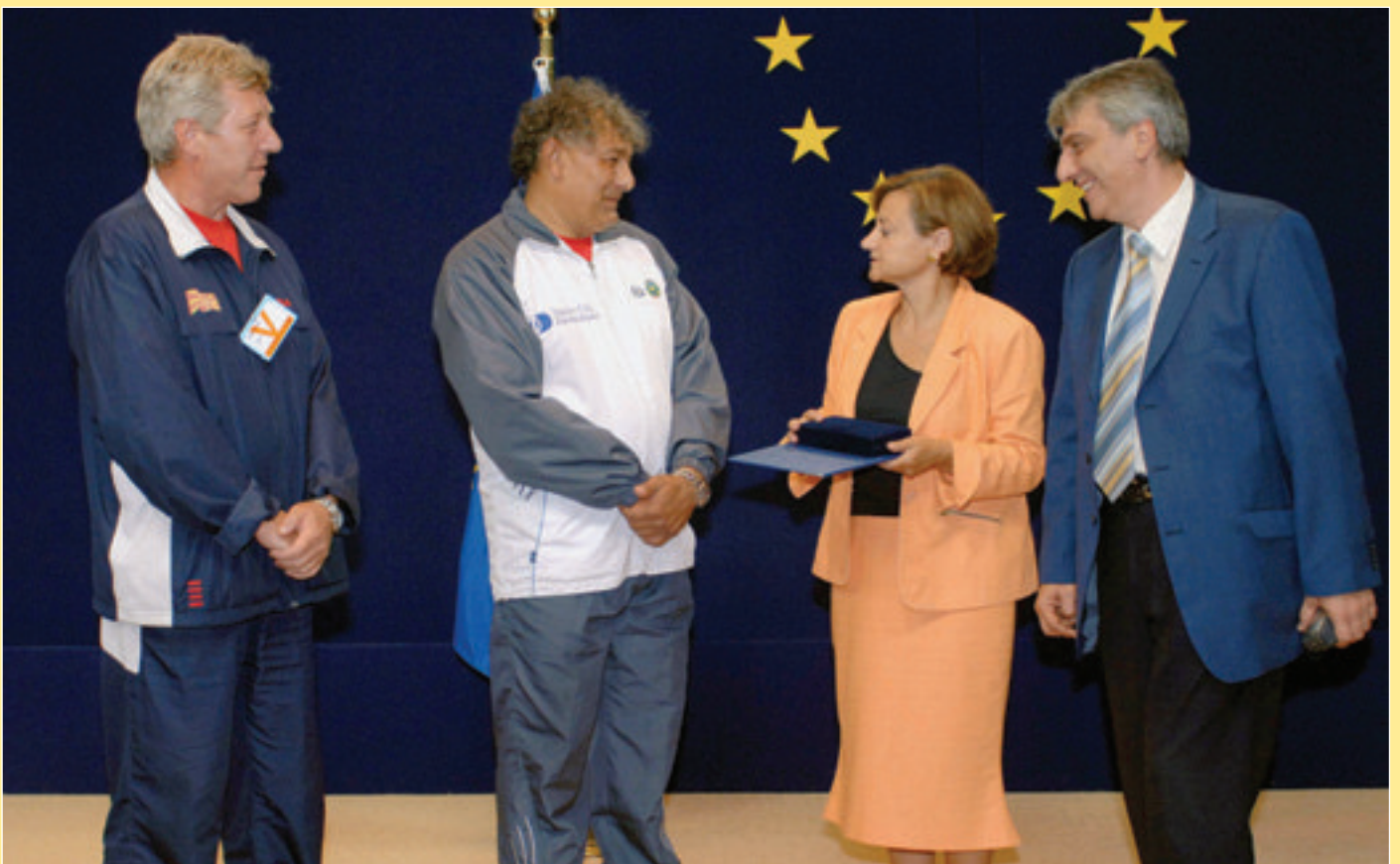
На 1-й сторінці обкладинки: Президент ЄК Жозеф Мануель Баррозу зустрічається із прем'єр-міністром України Юрієм Єхануровим.