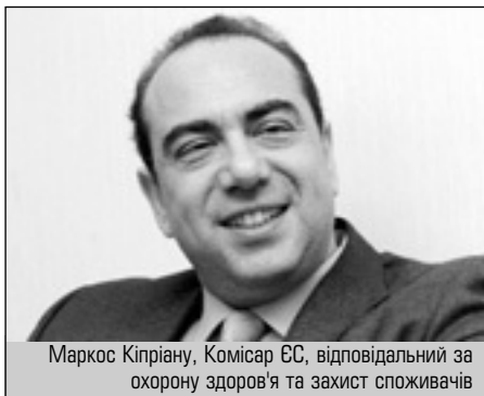
Маркос Кіпріану, Комісар ЄС, відповідальний за охорону здоров'я та захист споживачів

Розглядалися запобіжні дії, яких необхідно вжити, щоб уникнути розповсюдження хвороби на території ЄС. Комісія фінансуватиме заходи з посилення профілактики та контролю у країнах Євросоюзу. На зустрічі в Брюсселі було вироблено ряд застережних заходів. Проте повну заборону утримання домашніх птахів на відкритому повітрі було визнано непропорційною до можливого ризику інфікування через перелітних птахів.