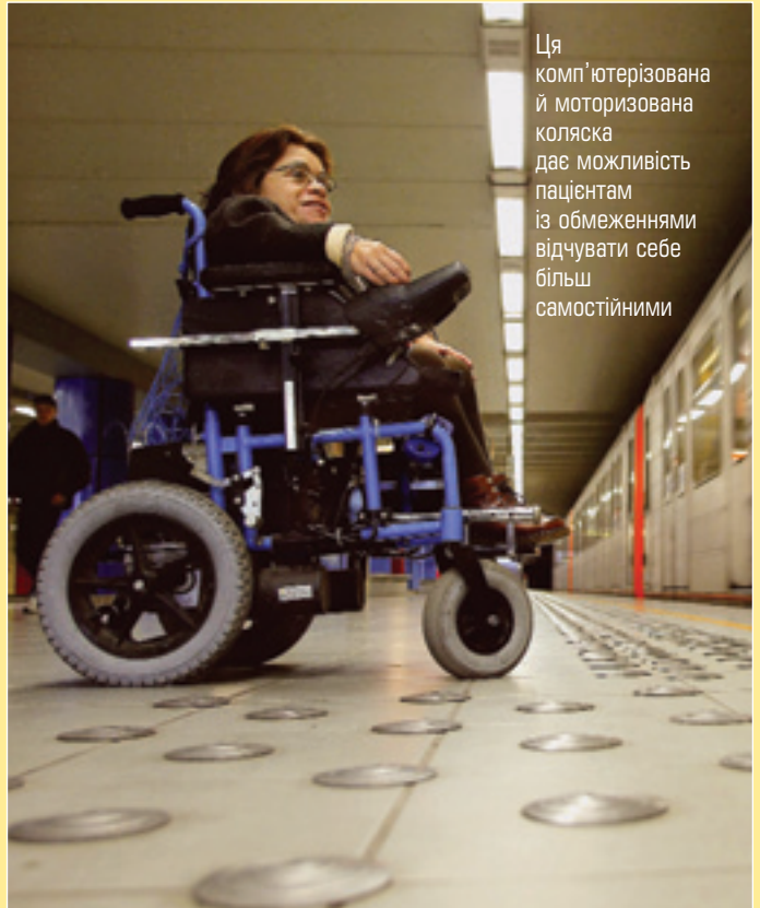
Ця комп'ютеризована й моторизована коляска дає можливість пацієнтам із обмеженнями відчувати себе більш самостійними