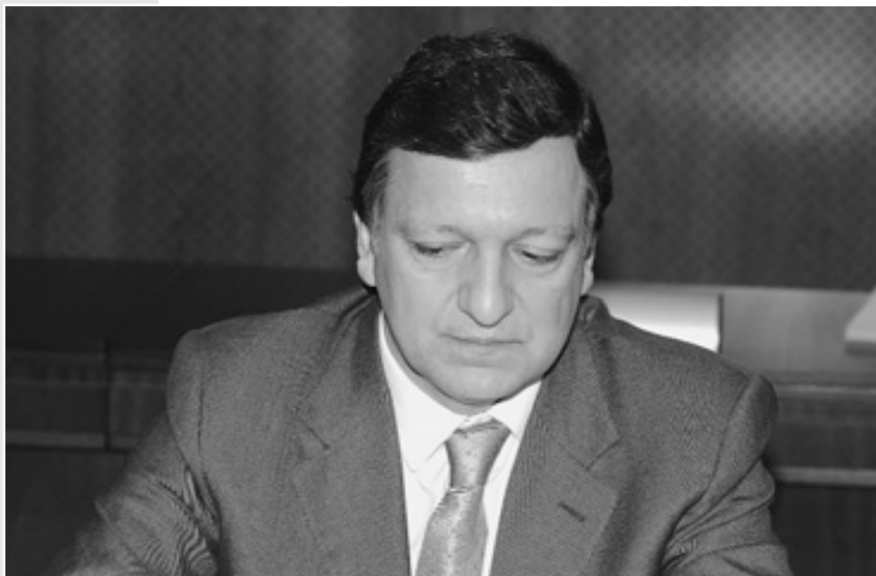
Президент Європейської Комісії Жозе Мануель Баррозу

21 вересня 2005 року у Нью-Йорку, в рамках Генеральної Асамблеї ООН, відбулася зустріч Україна — Трійка ЄС на рівні міністрів закордонних справ.