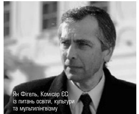
Ян Фігель, Комісар ЄС із питань освіти, культури та мультимовності

Цього року з різних країн Європи надійшло більш ніж 430 подань, із яких було відібрано 71 новий проект співпраці й 10 проектів створення навчальних мереж і проведення тематичних семінарів. До кожного проекту зазвичай залучається 6-8 партнерів від як мінімум трьох країн-учасниць. Проект отримує фінансування в розмірі €60-340 тисяч. Навчальні програми розраховані на час від одного до трьох років. У цілому Комісія надасть більше €16 млн. для фінансування цих ініціатив. При-