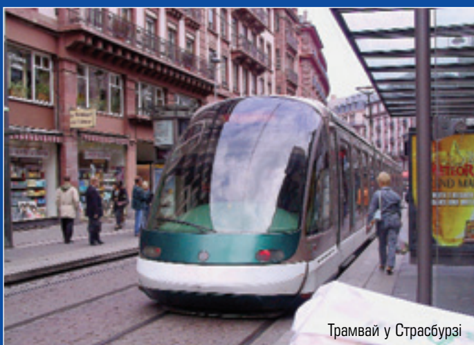
Трамвай у Страсбурзі