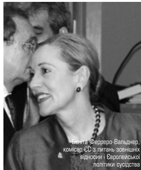
Беніта Ферреро-Вальднер, комісар ЄС з питань зовнішніх відносин і Європейської політики сусідства

ЄС був головним торговим партнером Йемену в 2003 році (1-е місце за обсягом експорту, 8-е місце за обсягом імпорту). Йемен дотримується угоди "Усе, крім зброї" (EBA), в межах якої 49 най-