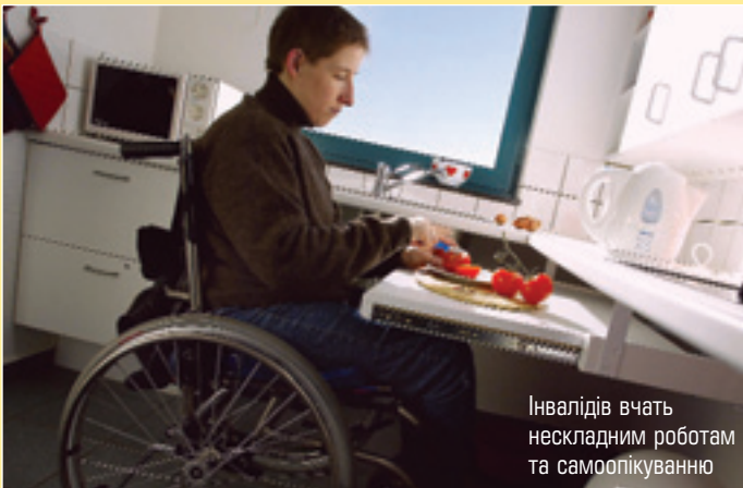
Інвалідів вчать нескладним роботам та самоопікуванню