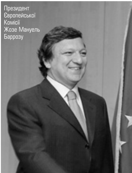
Президент Європейської Комісії Жозе Мануель Баррозу