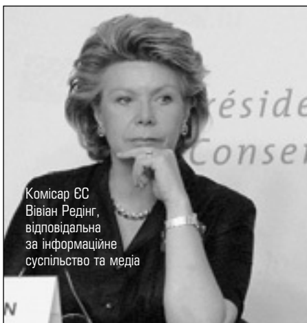
Комісар ЄС Вівіан Редінг, відповідальна за інформаційне суспільство та медіа

Єврокомісія розпочинає консультації на тему: як підвищити конкурентоспроможність видавничого сектора економіки, враховуючи глобальний процес комп'ютеризації. "Розпочаті консультації демонструють, що питання медіа-індустрії й, зокрема, друкованих видань - надзвичайно важливе для Єврокомісії" — наголосила пані Редінг.