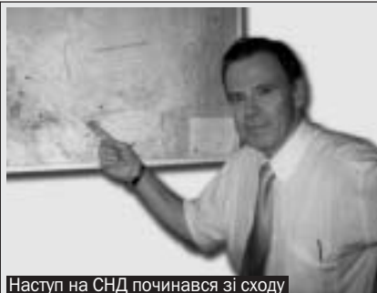
Наступ на СНД починався зі сходу

Крім того, будуть продовжені навчальні семінари із залученням іноземних експертів. На попередньому етапі були представники палат Естонії, Угорщини, Франції, Німеччини, Швеції.