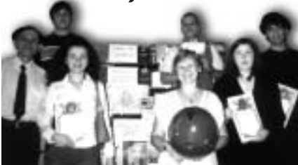
День Європи в гімназії східних мов №1 м.Києва. На фото: переможці Святошинського районного конкурсу "Історія виникнення європейської держави" з учителями гімназії.