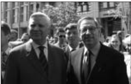
Анатолій Зленко і посол Греції в Україні Панайотіс Гумас.