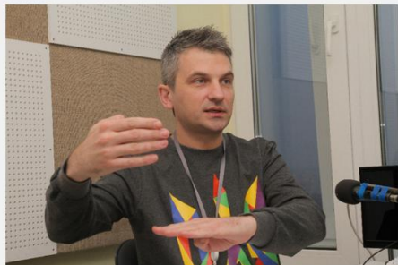
Роман Скрипін, співзасновник і ведучий каналу Громадське ТБ

Громадське ТБ відрізняється від більшості українських телеканалів: журналісти ведуть прямі включення з місць подій; проекти Громадського переважно суспільно орієнтовані; в ефірі телеканалу немає комерційної реклами.