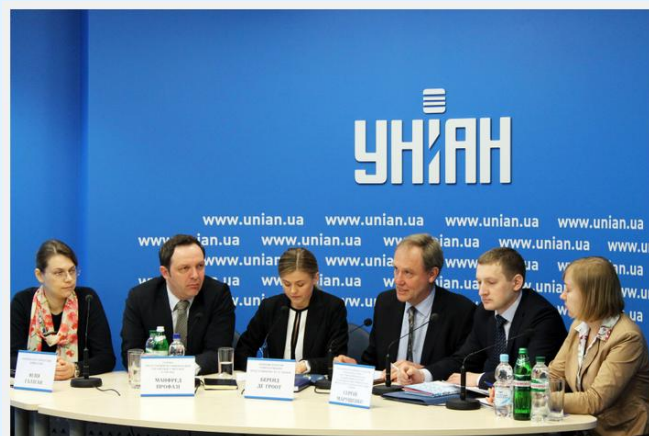
Прес-конференція з нагоди анонсування підтримки ЄС гарячої лінії для внутрішніх переселенців.

Повний текст: http://euukrainecoop.net/2015/03/24/idp-hotline/