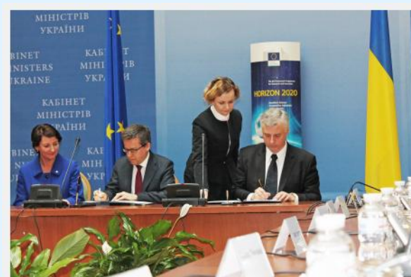
Карлуш Моедаш і Сергій Квіт підписують Угоду про асоціацію Горизонт 2020.

Повний текст: http://euukrainecoop.net/2015/03/31/horizon2020/