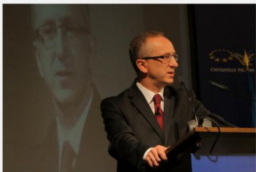
Голова Представництва ЄС в Україні Ян Томбінські

Громадянин, його права та умови для розвитку перебувають у центрі уваги Угоди про асоціацію з Європейським Союзом. На цьому наголосив Голова Представництва ЄС в Україні Ян Томбінські під час старту інформаційної кампанії «Сильніші разом», що пройшла у Національній філармонії України у Києві 10 вересня.