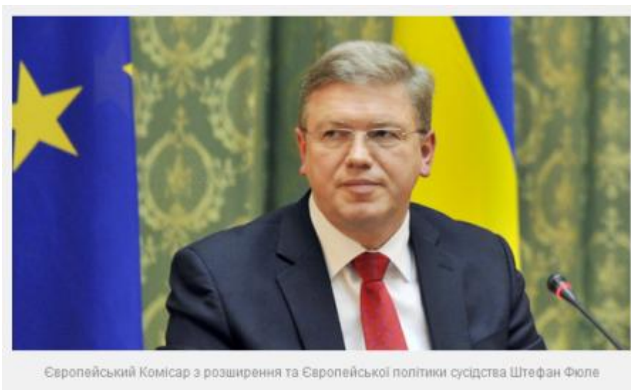
Європейський Комісар з розширення та Європейської політики сусідства Штефан Фюле

«Я також сподіваюся, що ми зможемо стати свідками підписання між ЄС та Україною найбільш потужного трансформаційного інструменту після розширення – Угоди про асоціацію, що включає в себе положення про створення глибокої та всеохопної зони вільної торгівлі (ГВЗВТ). Однак у Вільнюсі все лише розпочнеться, а не закінчиться».