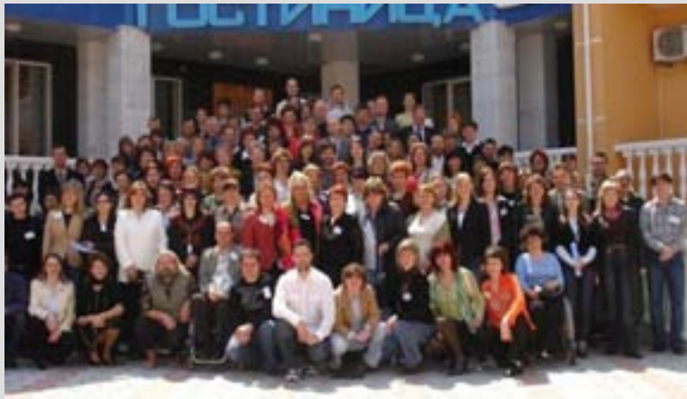
Активісти українських організацій громадянського суспільства на закритті конференції проекту «Подальше зміцнення громадянського суспільства»

Детальнішу інформацію про програму ІВРР можна знайти на сайті http://www.ibpp.org.ua/