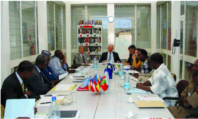
Réunion de dialogue politique inter-tchadien à la DCE en mars 2007

La Commission européenne appuie le gouvernement tchadien dans ses efforts de consolidation de la démocratie notamment pour les aspects liés à l'organisation des élections libres et transparentes qui garantissent à tous les acteurs politiques une liberté d'action plus accrue et favorisent la libre expression des populations. Cette initiative vise notamment l'appui à la réforme du cadre légal, à l'élaboration d'un nouveau fichier électoral, à l'amélioration du dispositif de gestion du processus électoral et au renforcement des capacités des acteurs politiques à s'engager dans le processus démocratique.