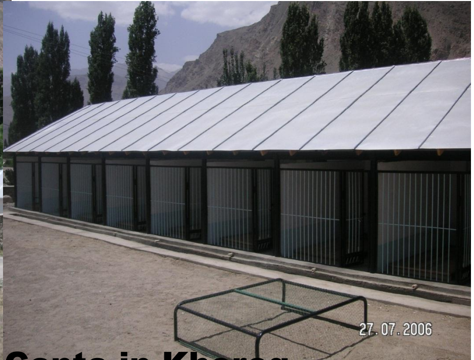
Small branch of Dog Cente in Khorog