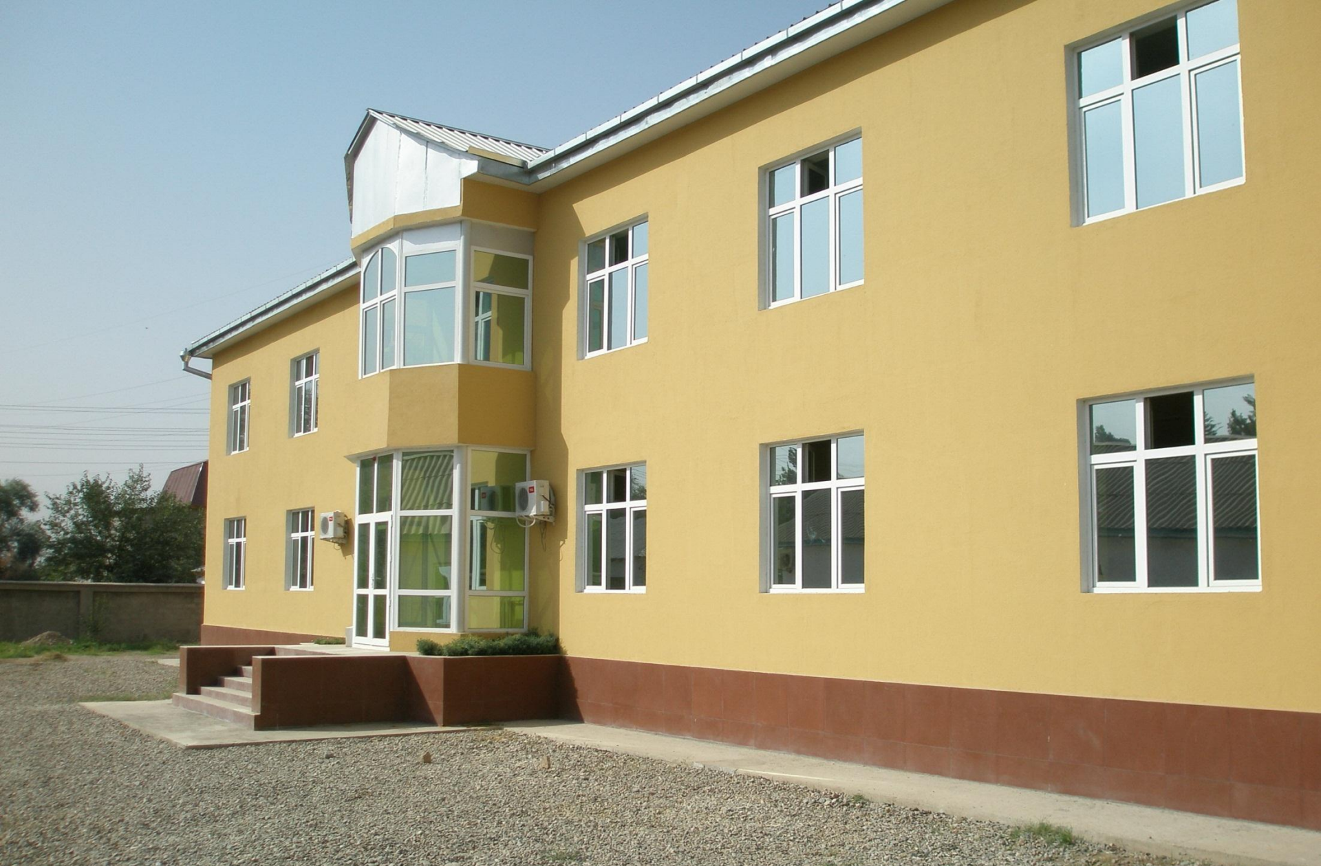
Multi-Agency Dog Training Center