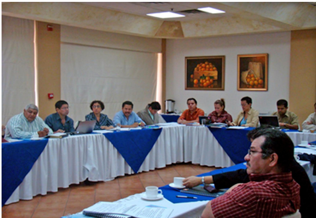
Capacitación en la Norma No.17024:2003. Hotel Seminole

Este tipo de actividades genera muchas ventajas para instituciones que tienen interés de abrir un organismo certificador de personas, además, crea la necesidad de continuar capacitaciones más amplias en temas y contenidos.