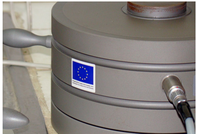
Patrón para calibración de equipos de ensayo. Metrología de Fuerza.