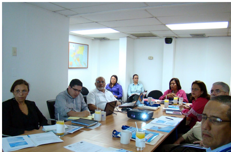
Reunión del comité de dirección PRAMELCIN, llevada a cabo en las sala de reuniones del despacho de la Viceministra -MIFIC