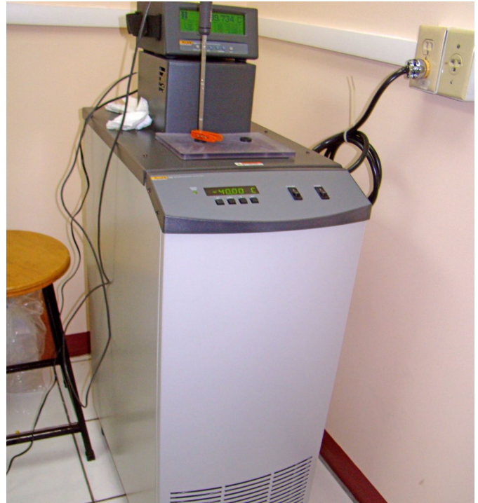
Mini celda de punto fijo: Punto triple de mercurio (Hg). Metrología Termométrica.

La adquisición de estos nuevos equipos se realizó a través del Programa de Apoyo a la Mejora del Clima de Negocios e Inversiones en Nicaragua (PRAMECLIN), con el apoyo de la Unión Europea.