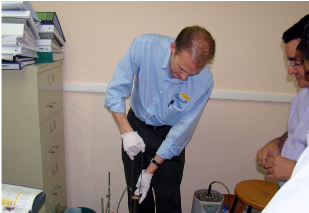
Capacitador instalando Mini celda de punto fijo: Punto de fusión de Galio (Ga). Metrología Termométrica.

El Ministerio de Fomento, Industria y Comercio (MIFIC) realizó la adquisición de modernos equipos para el Laboratorio Nacional de Metrología (LANAMET), ubicado en el recinto la Universidad Nacional de Ingeniería en el Recinto Universitario Pedro Aráuz Palacios.