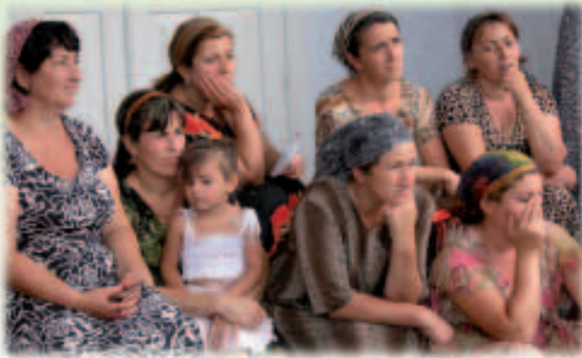
Des femmes tchéchènes s'informent sur les projets d'autoassistance.

Certes, la situation s'est améliorée, de sorte que, pour la première fois depuis 1999, ECHO a pu réduire l'ampleur de ses activités là-bas. Il n'empêche que de nombreux Tchétchènes dépendent toujours de l'aide financière canalisée par des organisations ou des programmes tels que la Croix-Rouge, le Haut-Commissariat des Nations unies pour les réfugiés ou le Programme alimentaire mondial. Pour sa part, l'Union finance des activités de formation au profit des couches plus vulnérables de la population, l'objectif étant de rendre celles-ci plus autonomes. Il s'agit, entre autres, d'activités génératrices de revenus, telles la construction et l'exploitation de serres.