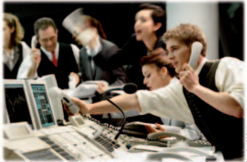
L'euro est au centre de multiples transactions sur les marchés mondiaux des devises.

L'Union et sept pays d'Europe du Sud-Est ont créé une communauté de l'énergie au sein de laquelle les règles du marché seront les mêmes pour tous. L'Union bénéficiera ainsi d'une sécurité accrue pour la fraction de ses approvisionnements en gaz et en électricité qui passe par les pays en question; en contrepartie, ceux-ci appliqueront sur leur propre marché énergétique les règles et les normes communautaires, pour un fonctionnement plus efficace.