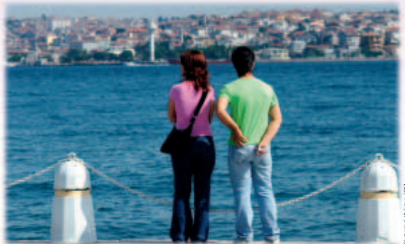
Istanbul: la Turquie est candidate à l'adhésion à l'Union.

En outre, quatre pays des Balkans occidentaux — l'Albanie, la Bosnie-et-Herzégovine, le Monténégro et la Serbie — sont des candidats potentiels à l'adhésion. L'Union européenne autorise déjà le libre accès de son marché pour la plupart des exportations en provenance de l'ensemble des Balkans occidentaux et apporte son soutien aux réformes intérieures de ces pays.