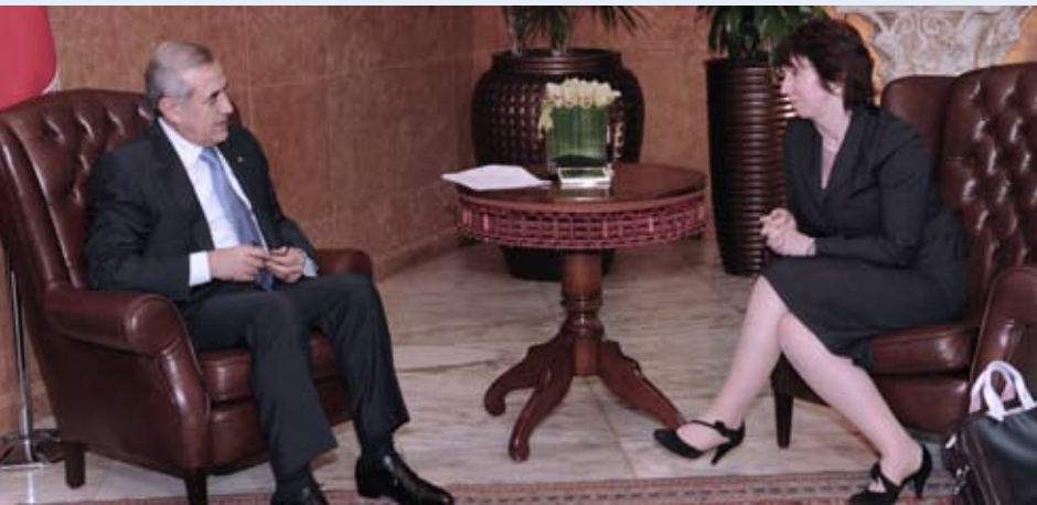
الرئيس مشال سليمان مع كاترين آشتون خلال زيارتها للبنان (آذار 2010)

دخلت معاهدة لشبونة حيز التنفيذ في الأول من كانون الأول 2009. وكجزء أساسي من هذه المعاهدة، ولد جهاز العمل الخارجي الأوروبي في الأول من كانون الأول 2010. وسوف يستفيد هذا الجهاز من شبكة بعثات الاتحاد الأوروبي ويضم موظفين من مؤسسات الاتحاد والأجهزة الدبلوماسية للدول الأعضاء. ووضعت بعثات الاتحاد الأوروبي في صلب هيكلية جهاز العمل الخارجي منذ إنشائه.