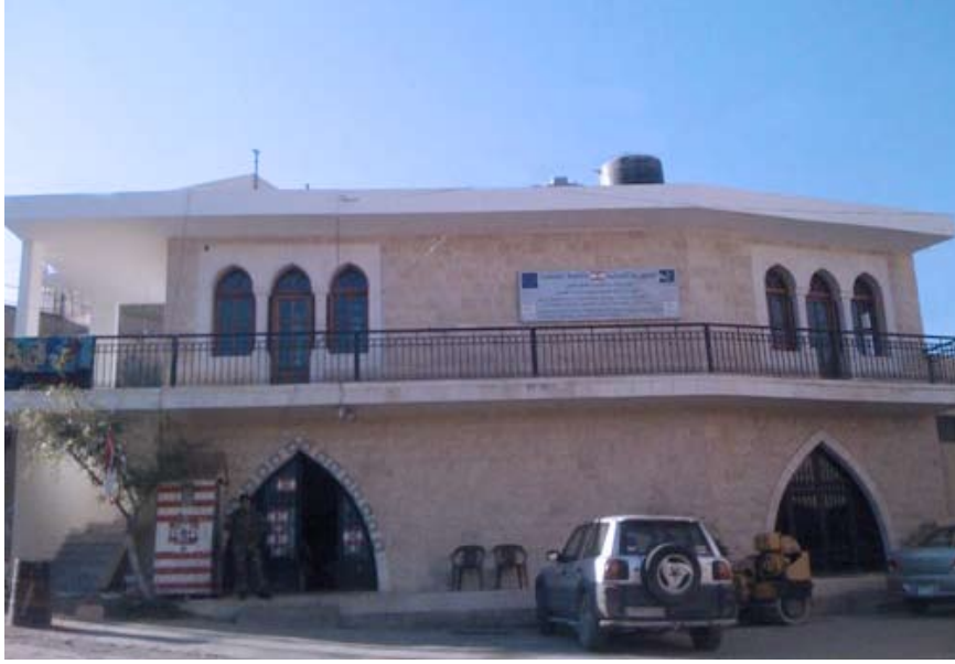
مكتب التنمية المحلية لاتحاد بلديات الهرمل

في إطار التعاون مع مكتب وزير الدولة لشؤون التنمية الإدارية لتأهيل الإدارة اللبنانية، أطلق الاتحاد الأوروبي في عام 2005 مشروع "الحكم المحلي" الهادف إلى تمكين السلطات المحلية في عملية التنمية.