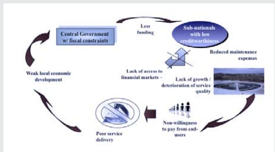
Breaking the Vicious Cycle

The EU programme is designed in close coordination with the Italian cooperation in an attempt to develop joint mechanisms to support the municipal sector.