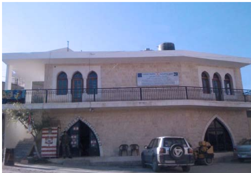
The Local Development Office of the Federation of Municipalities of Hermel

The programme also delivered targeted technical assistance to disseminate participative planning methods to the elect