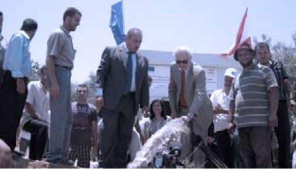
تدشين مشروع مياه في قرية مار توما عكار (25 حزيران 2009)

آلية مهمة لسياسة الحكومة اللبنانية للحد من الفقر في جميع مناطق البلاد، مما يسمح له بأن يشكل أداة فاعلة لمساعدة الجهات المانحة للمناطق والمجتمعات الأكثر حاجة.