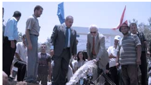
Inauguration of a water project in Mar Touma in Akkar (25 June 2009)

instrument of the Lebanese Government's policy for poverty alleviation in all regions of the country and as such can be an efficient vehicle for donors' assistance to vulnerable regions and communities.