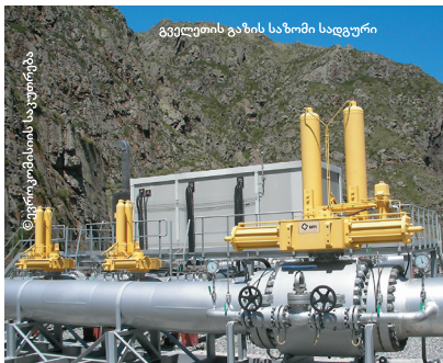
გველეთის ვანის საზომი სადგური