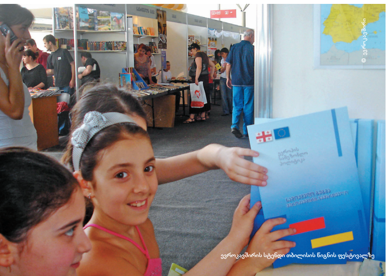
ევროკავშირის სტენდი თბილისის წიგნის ფესტივალზე

ევროკავშირის წარმომადგენლობა საქართველოში 1995 წელს გაიხსნა. წარმომადგენლობას წამყვანი როლი ეკისრება ევროკავშირისა და საქართველოს შორის ორმხრივი თანამშრომლობის ახალ ეტაპზე გადასვლაში. წარმომადგენლობა ხელს უწყობს ურთიერთობების და თანამშრომლობის განვითარებას, ერთის მხრივ, ქვეყნის მთავრობასთან და, მეორეს მხრივ, ევროკავშირის ინსტიტუტებთან. მას მინიჭებული აქვს სრული დიპლომატიური სტატუსი და უფლებამოსილება, აწარმოოს მოლაპარაკება ევროკავშირის თანამშრომლობის პროგრამებთან დაკავშირებით და მოახდინოს მათი კოორდინირება.