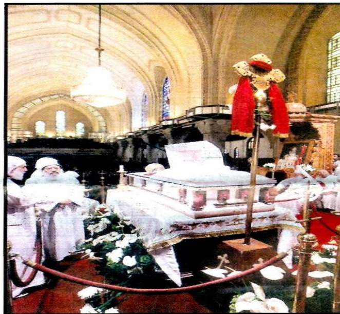
جثمان البابا في أثناء مراسم الصلاة

“Egypt bids farewell to Pope Shenouda with prayers for peace,” al-Ahram headlined its front page devoted entirely for photos taken at Pope Shenouda III’s funeral. In his funeral at Saint Mark’s Cathedral in Cairo, Pope Shenouda’s last will was read. Pope Shenouda called Copts to adhere to love and unity.