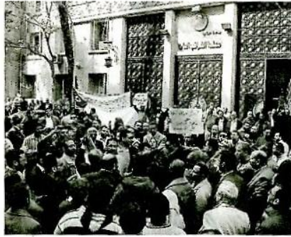
مظاهرات موظفي الضرائب مستمرة أمس